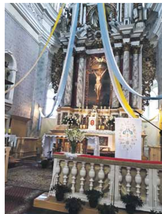
Skaistkalnes barokālajā, liliņām greznotajā katoļu baznīcā ir neatkārtojama gaisotne.

Gadu tūkstošiem cilvēci nodarbinājuši jautājumi par to, kas ir cilvēks, dzīve, nāve, pasaule. Tie ir lielie jautājumi par dzīvības un nāves attiecībām, par mūžību un laiku, labo un ļauno, par cilvēka dzīves jēgu. Atbildi cenšas sniegt gan reliģija, gan filozofija. Platons runā par patiesību, skaisto un