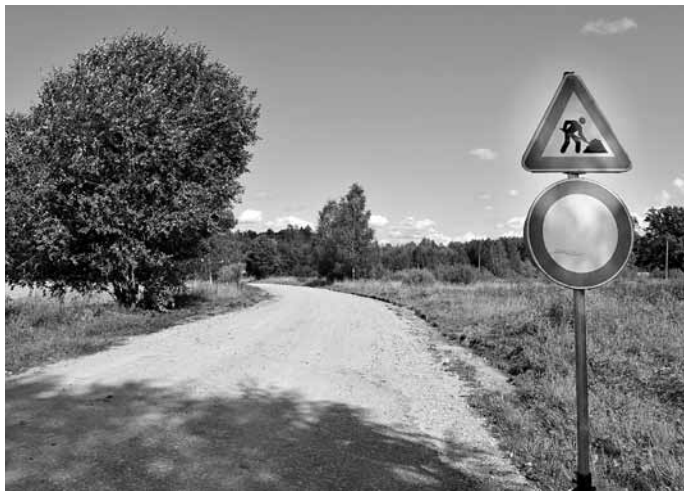
Šobrīd tiek sakārtots ceļš uz Vēgām. Par to bieži runāts iedzīvotāju sapulcēs.

Par Kuldīgas novada pašvaldības papildu iedalīto naudu pagastiem tiek labots ceļš Kalnieši–Saulieši–Jaunmuiža 900 metru posms – noņemts apaugums, tīrītas caurtekas un uzbērtas grants šķembu maisījums. Kopējās izmaksas ir