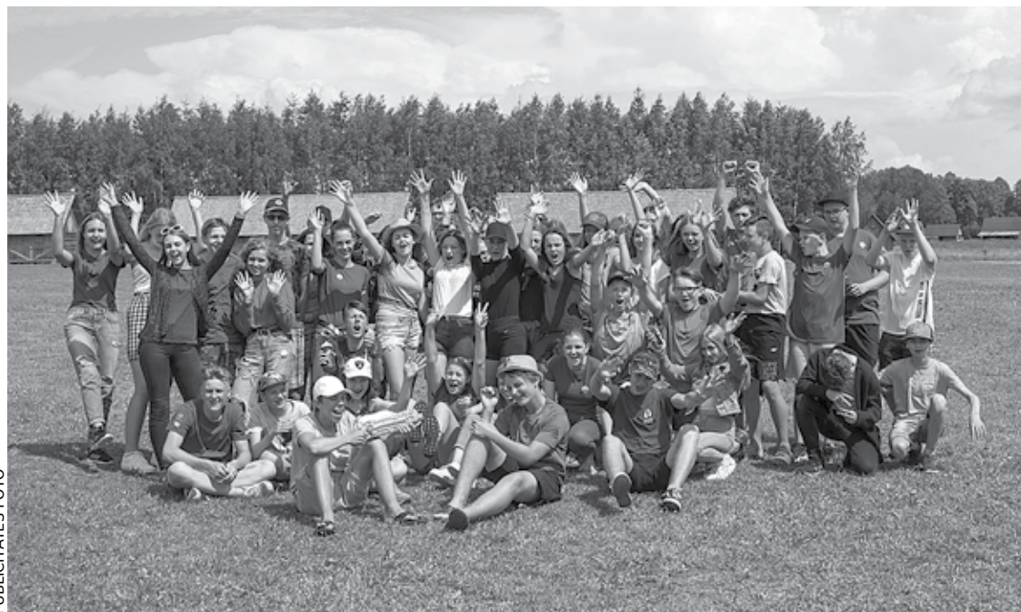
Nometnes jauniešiem „#WorldReady” dalībnieki.

BEZMAKSAS LEKCIJA “KĀ SAGLABĀT HARMONIJU IKDIENĀ”