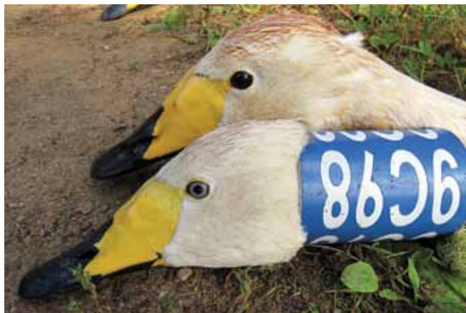
Zilo kakla gredzenu uz baltajiem gulbjiem viegli saskatīt. Šajā attēlā redzama arī acu krāsas atšķirība.

Kurzemē ziemeļu gulbis sastopams bieži, visvairāk esot vecajā Kuldīgas, Liepājas un Saldus rajona teritorijā. Skrunda, Sātiņi un Nagļi esot trīs vietas Latvijā, kurā ziemeļu gulbji atrodas spalvu maiņas periodā, kad vēl neligzdo. Tie ligzdo nevis pirmajā gadā, bet gan ceturtajā, piektajā vai pat astotajā. Spalvu maiņas laikā pulcējas baros drošā vidē un tur, kur daudz barības. Tad tiem ir izkritušas lidspalvas, tādēļ kādu mēnesi gulbji nespēj lidot, un tas gredzenotājiem ļauj izdarīt savu darbu, stāsta ornitologs.