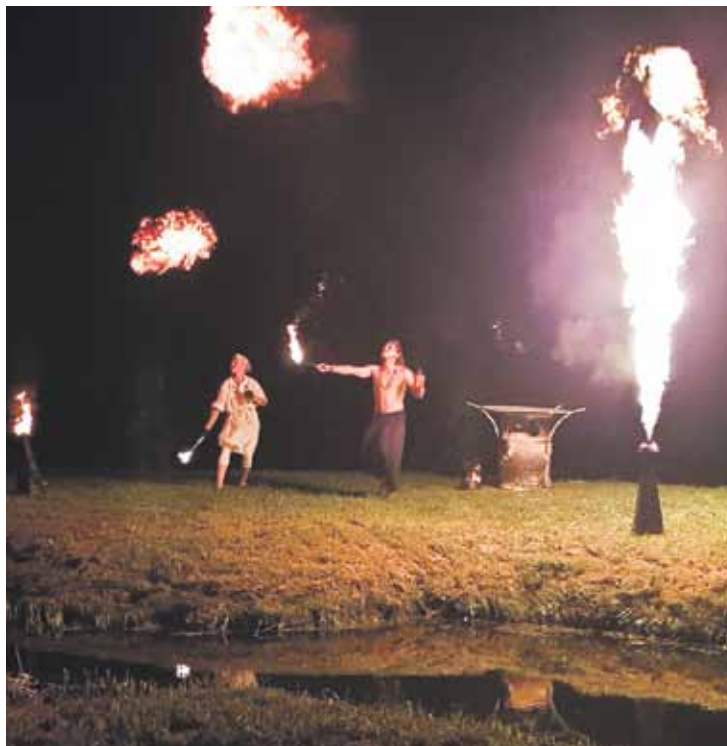
Liepājas ceļojošā cirka Beztemata ugunsšovu varēja vērot trīs reizes.

Nr. 438 rādīja Vara Klausītāja Zīmējumu teātris .