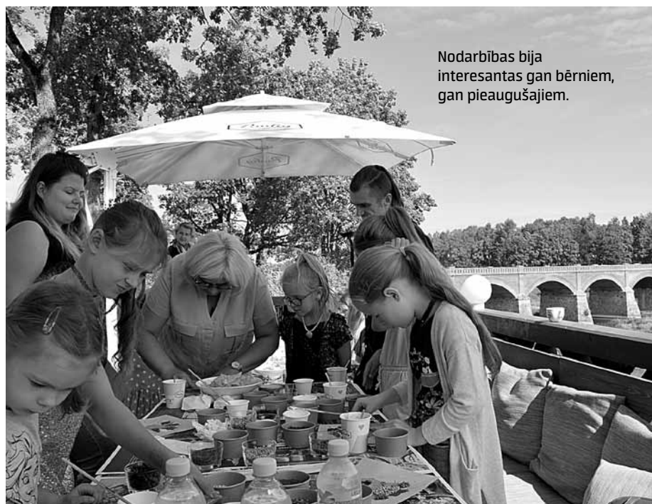
Nodarbības bija interesantas gan bērniem, gan pieaugušajiem.

Šāds pasākums Latvijā notiek trešo gadu. Tas rit apmēram trīs stundas, bet parasti ieilgst, jo bērni nevēloties beigt.