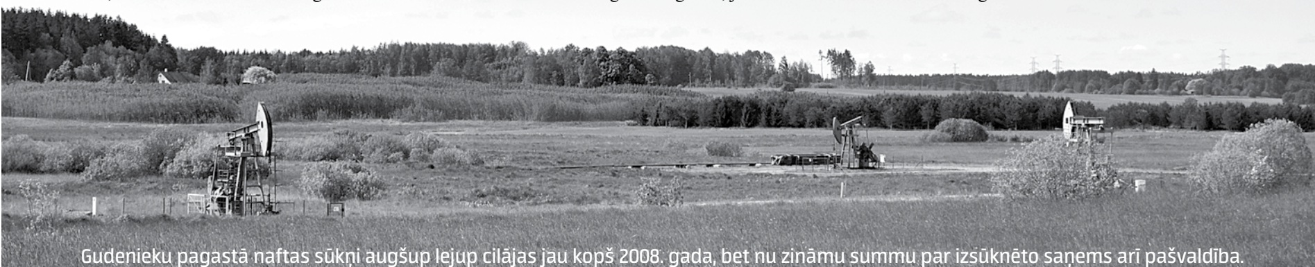
Gudenieku pagastā naftas sūkņi augšup lejup cilājas jau kopš 2008. gada, bet nu zināmu summu par izsūkņoto saņems arī pašvaldība.

Licence uzņēmumam iesniegta līdz 2036. gada 30. jūnijam, pašvaldība ar BOM līgumu noslēgusi līdz 2024. gada 30. jūnijam.