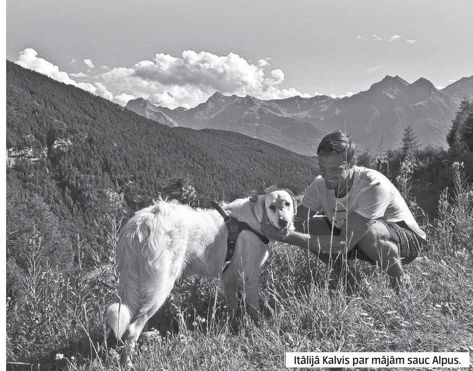
Itālijā Kalvis par mājām sauc Alpus.