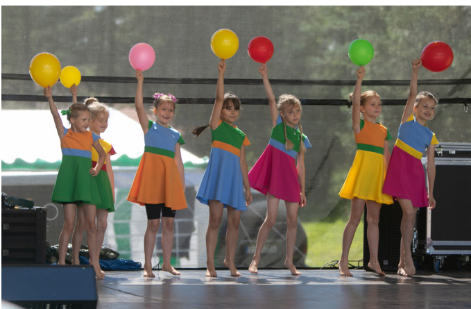
Priekšnesumi uz skatuves