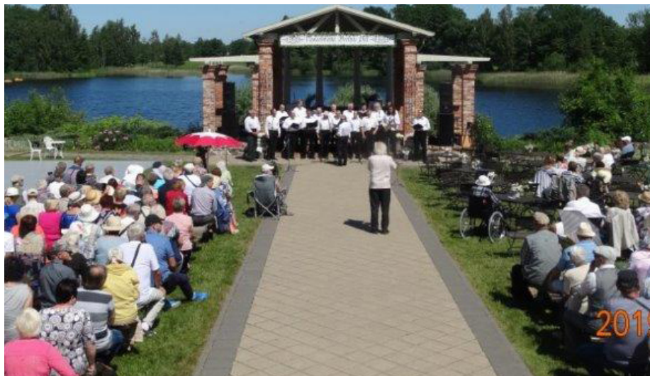
Vīru koris uzstājas Vasarsvētkos Bīriņu pilī.

finanšu resursi. Atbildu visiem: pirms daudziem gadiem kāda kundze, aizejot no šīs Pasaules, ziedoja daļu savu ietaupījumu lielo dzērveņu nozares attīstībai Latvijā un ieteica veltīt daļu topošas peļņas pašdarbības attīstībai. To arī ar prieku visus šos gadus darīju, protams, iespēju līmenī.