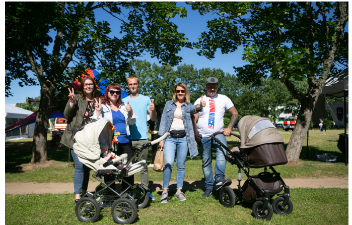
...nesteidzīgas pastaigas un sarunas