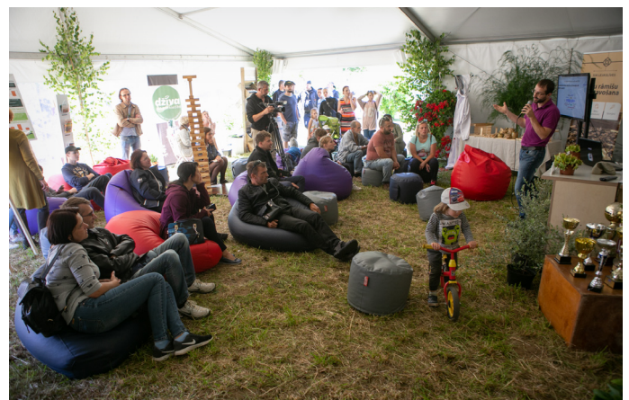
...un dalīšanās pieredzē Uzņēmēju teltī