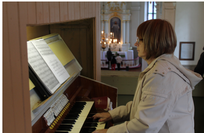
Ērģeļu mūzika Lēdurgas baznīcā