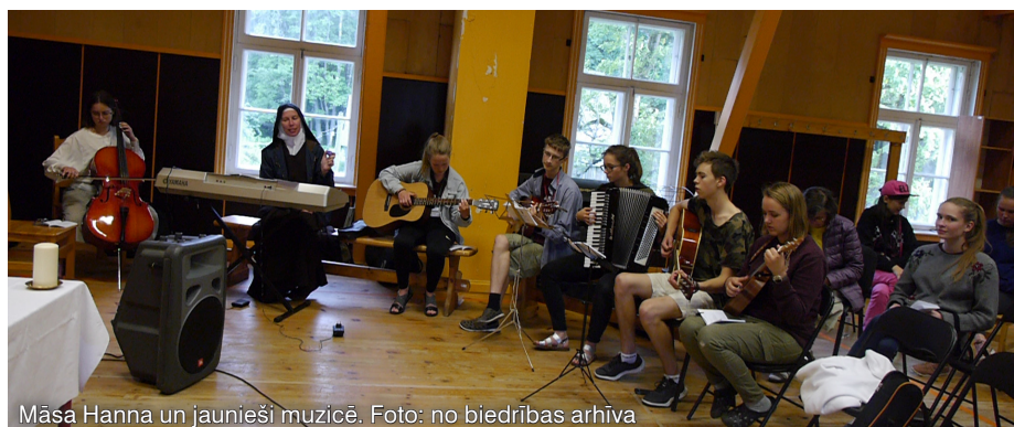
Māsa Hanna un jaunieši muzicē.