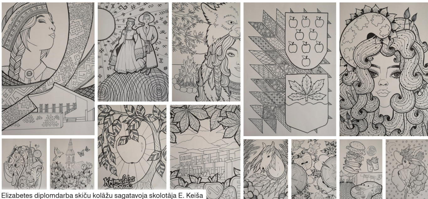
Elizabetes diplomdarba skiču kolāžu sagatavoja skolotāja E. Keiša