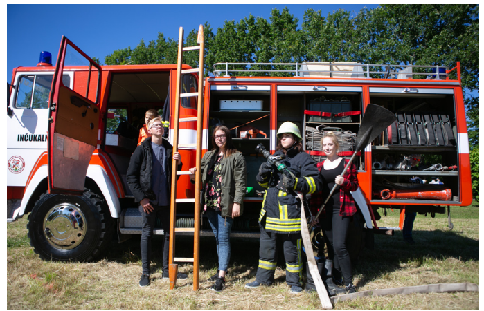
...ar ugunsdzēsēju palīdzību