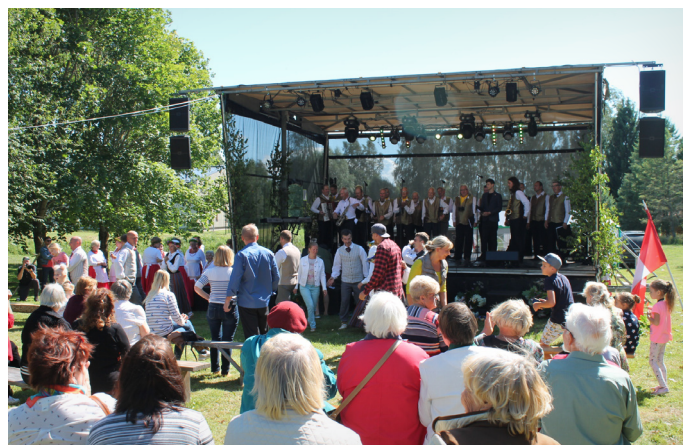
...un kopā dejošana