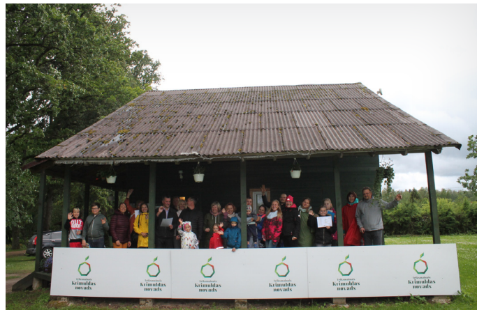
...veselību veicinošās aktivitātes