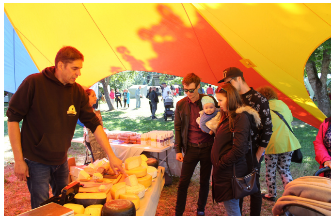
...un prasmīgs uzņēmējs