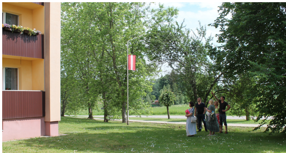
Konkursa pieteikumu vērtēšanas komisija apsekoja pieteiktos daudzdzīvokļu namus

Daudzdzīvokļu ēku īpašnieki un apsaimniekošanas biedrības, kuru nekustamais īpašums atrodas Krimuldas novada administratīvajā teritorijā, ir bijuši aktīvi un Krimuldas novada dome saņēmusi 9 pieteikumus daudzdzīvokļu dzīvojamo māju tehniskā un vizuālā stāvokļa uzlabošanai.