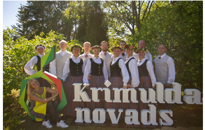
...arī VPK "Dzirnakmeņi"