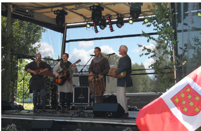
FK "Putni" dziesma