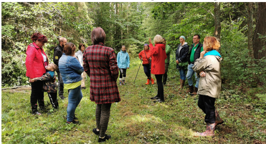
Objektu izpētes brauciena laikā tā dalībnieki guva vērtīgu pieredzi turpmākiem attīstības virzieniem, ideju realizācijai un situāciju risinājumiem.

Vidzemes lauku partnerība "Brasla" sadarbībā ar Somijas vietējo rīcības grupu Kehittämisyhdistys SILMU ry uzsāk īstenot starpvalstu sadarbības projektu "Maršruti pāri robežām Latvijā un Somijā", kura ietvaros iesaistīsies piecas – Alojās, Kocēnu, Krimuldas, Limbažu un Pārgaujas novadu pašvaldības.