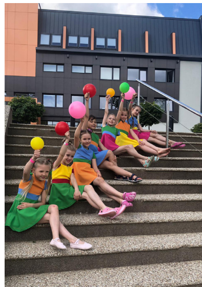
Ar aizrautību deju mākslā

◆ Lepojamies ar Krimuldas Mūzikas un mākslas skolas Dejas nodaļas audzēkņiem, kuri 2. jūnijā "Crystal cup" konkursā Smiltēnē izcīnīja 1. grupa 3. vietu un 2. grupa 5. vietu.