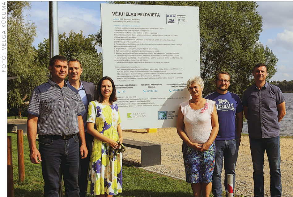
Svinīgi tiek atklāta Vēju ielas atpūtas vieta Ziedonī.

Jūlijā svinīgi tika atklāta labiekārtotā Vēju ielas atpūtas vieta Ziedonī, bet jau pirms tam vasaras tveicīgās dienas iedzīvotāji aktīvi pavadīja šajā vietā, to atzinīgi novērtējot.