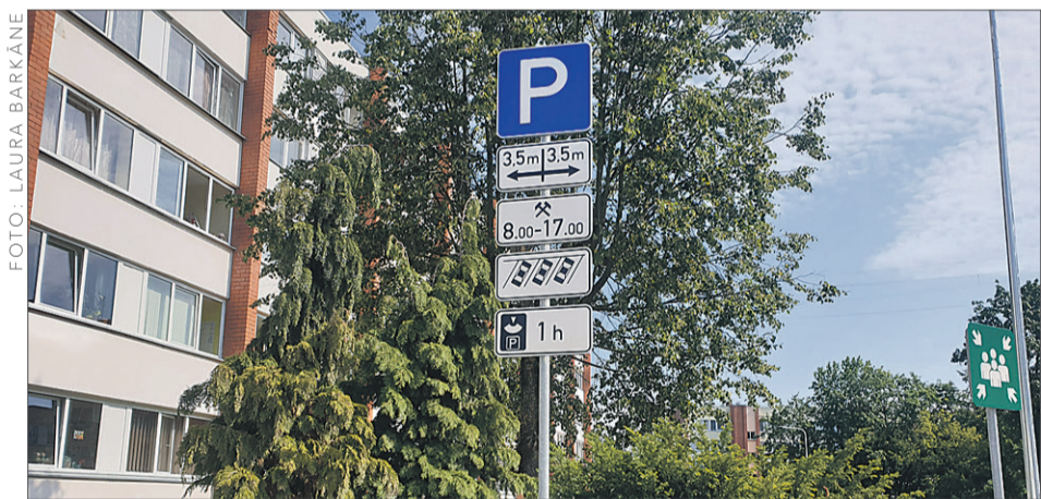
Uzstādītās jaunas ceļas zīmes.

Noslēdzoties stāvlaukuma rekonstrukcijas darbiem Ķekavā, Gaismas ielā 19, uzstādītas jaunas ceļa zīmes, kas paredz atsevišķus automašīnu kustības un stāvēšanas ierobežojumus.