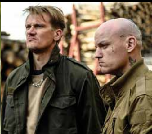
MARCO GHIDELLI FOTO