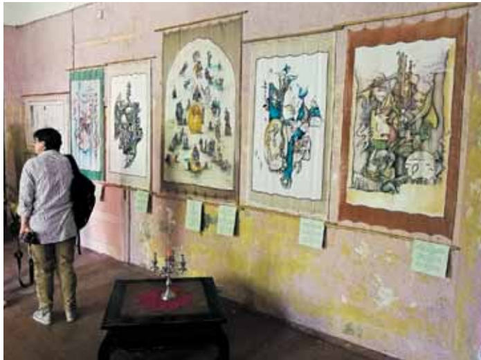
Padures muižā labi iederas starptautiskas mākslinieku grupas Pazarh darbi, kuros apvienoti visdažādākie materiāli.