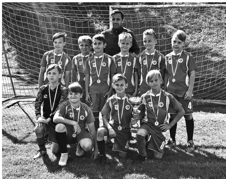
Kuldīgas novada sporta skolas futbolisti U10 grupā Kurzemē elites grupā izcīnījuši 5. vietu.

„Esmu runājis ar jaunatnes treneriem no tādiem klubiem kā Manchester United , Juventus , Tottenham Hotspur , Leverkusen un citiem. Viņus vieno šāda filozofija – individuālās meistarības celšana ir primāra, tikai tad spēles rezultāts.”