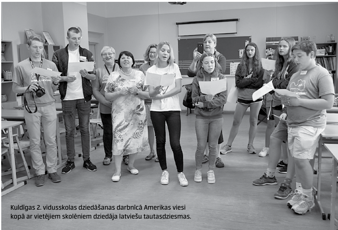
Kuldīgas 2. vidusskolas dziedāšanas darbnīcā Amerikas viesi kopā ar vietējiem skolēniem dziedāja latviešu tautasdziesmas.