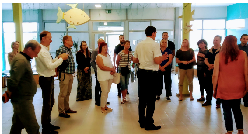
“Esam patīkami pārsteigti, prieks par šādu attīstību, pārdomātu darbību, pareizo stratēģisko plānošanu,” teic viesi no Aizputes novada

Ilūkstes novada Kultūras un tūrisma aģentūra