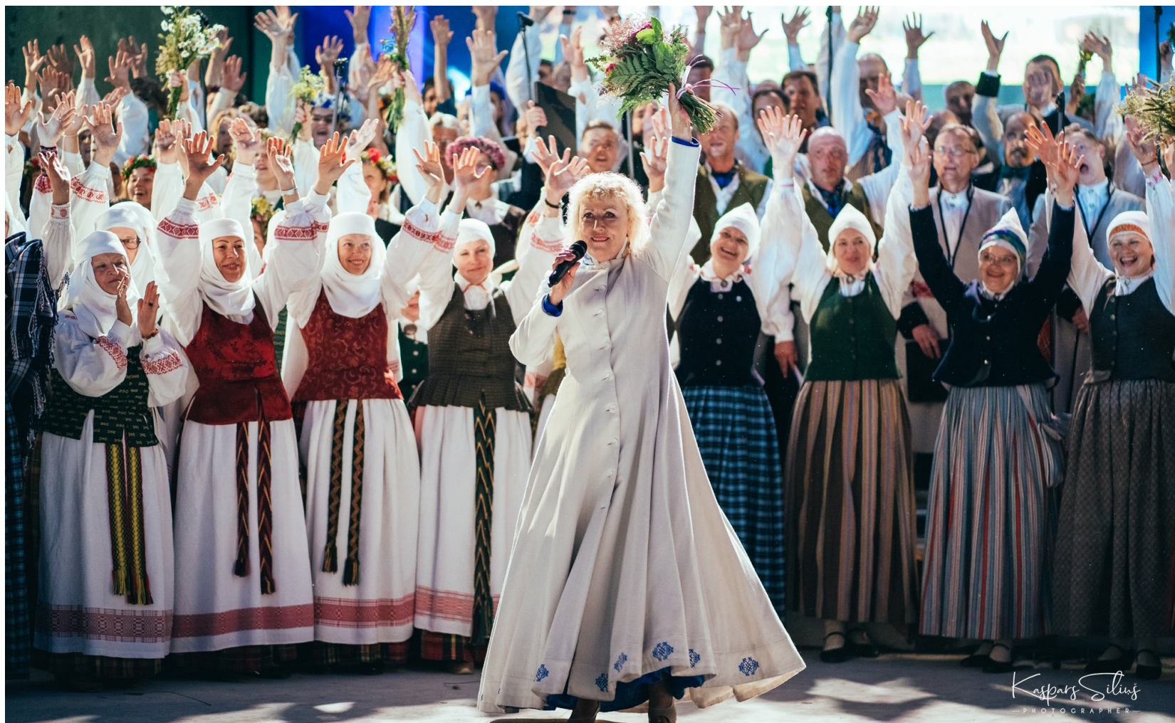
Simbolizējot mūžīgu Sēlijas nedalāmību, vienojāmies spēka dziesmās