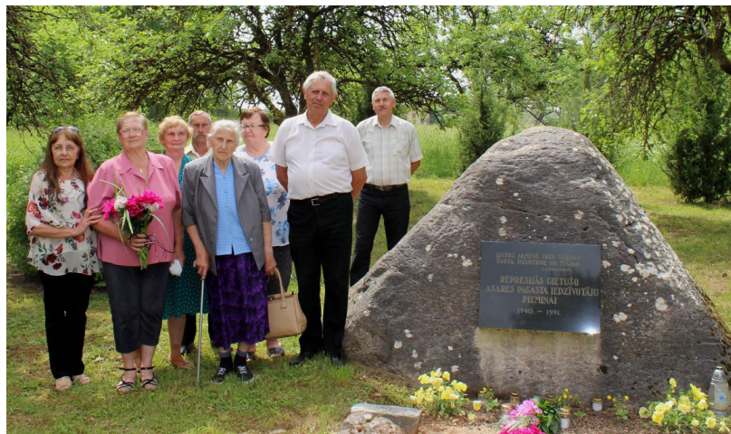
Pēc pasākumiem Ilūkstē represētie devās ekskursijā uz Asari

Cilvēku, kuri piedzīvoja izsūtījumu, kļūst aizvien mazāk, taču, pateico- ties tiem, kas atgriezās, mēs pārmantojam to tautas spēku, kas mita mūsu