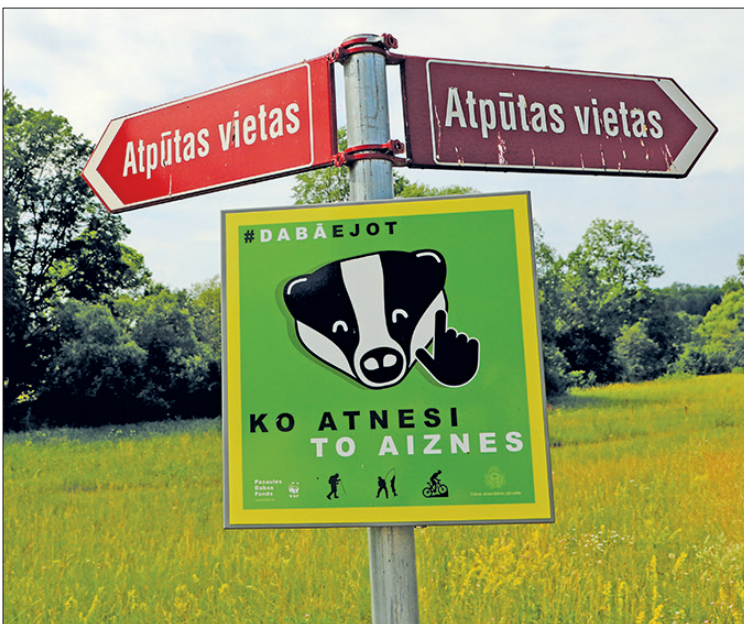
ZĪMES, kas cilvēkiem atgādina nemēsot dabā.

Dabas aizsardzības pārvalde kopā ar Pasaulē dabas fondu, izvirzot ambiciozu mērķi – mainīt sabiedrības priekšstatus un uzvedību, 2018. gada rudenī uzsāka kampaņu "Dabā ejot, ko atnesi, to aiznes!". Saistībā ar to jau pirms gada atsevišķās dabas takās un citos dabas tūrisma objektos tika noņemtas atkritumu urnas un uzstādītas informatīvas zīmes, kas aicina apmeklētājus aizdomāties par viņu radīto ietekmi uz dabas objektiem un atpūtas laikā radušos