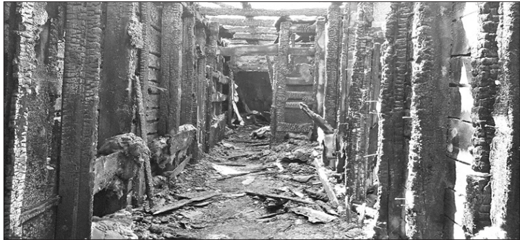
ĒKAI Dārza ielā ugunsgrēkā daļēji izdedzis otrais stāvs, sadegušas koka konstrukcijas.

A izkraukles novada dome nolēma nojaukt divstāvu ēku Dārza ielā 5, kura pirms vairāk nekā mēneša cieta ugunsgrēkā. Būvvalde, apsekojot ēku, secinājusi, ka tā var apdraudēt cilvēku drošību, savukārt to atjaunot nebūtu izdevīgi.