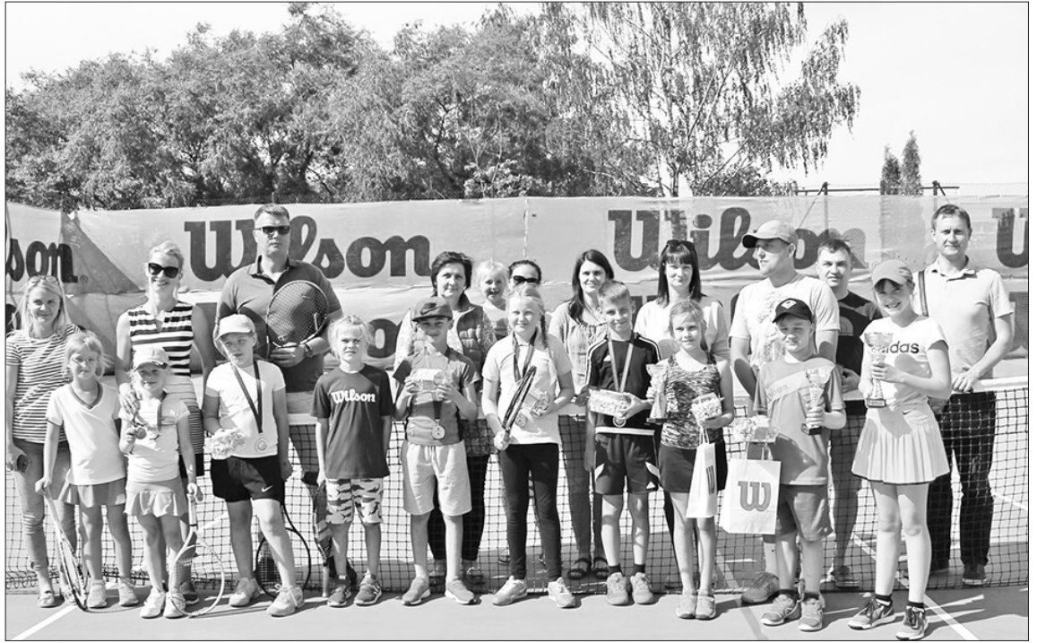
JAUNO TENISISTU prasmes tagad varēs pilnveidot, treniņos izmantojot iegādāto aprīkojumu.

Tenisa aprīkojuma iegāde veikta projekta „Tenisa aprīkojuma iegāde” (projekta Nr. 18-04-AL08-A019.2201-000001) ietvaros.