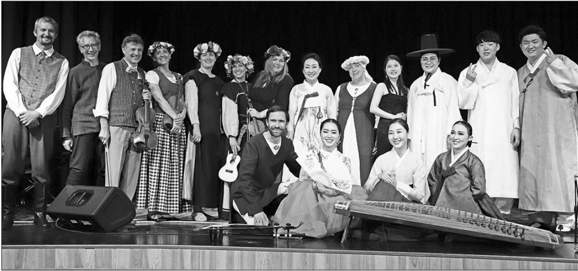
AIZKRAUKLĒ Korejas pārstāvji muzicēja kopā ar kapelu "Karikste".

Jūnija beigās Aizkrauklē notika unikāls pasākums – Korejas tradicionālās mūzikas koncerts. Atzīmējot Latvijas Universitātes (LU) 100 gadu jubileju un Latvijas Republikas 100 gadu jubileju, sadarbībā ar Busanas Nacionālo Universitāti Dienvidkorejā, no 21. līdz 27. jūnijam notika "Korejas dienas Latvijā 2019". Šī pasākumu cikla ietvaros bija iespējams izbaudīt Korejas kultūru un iegūt jaunas zināšanas par šo valsti.