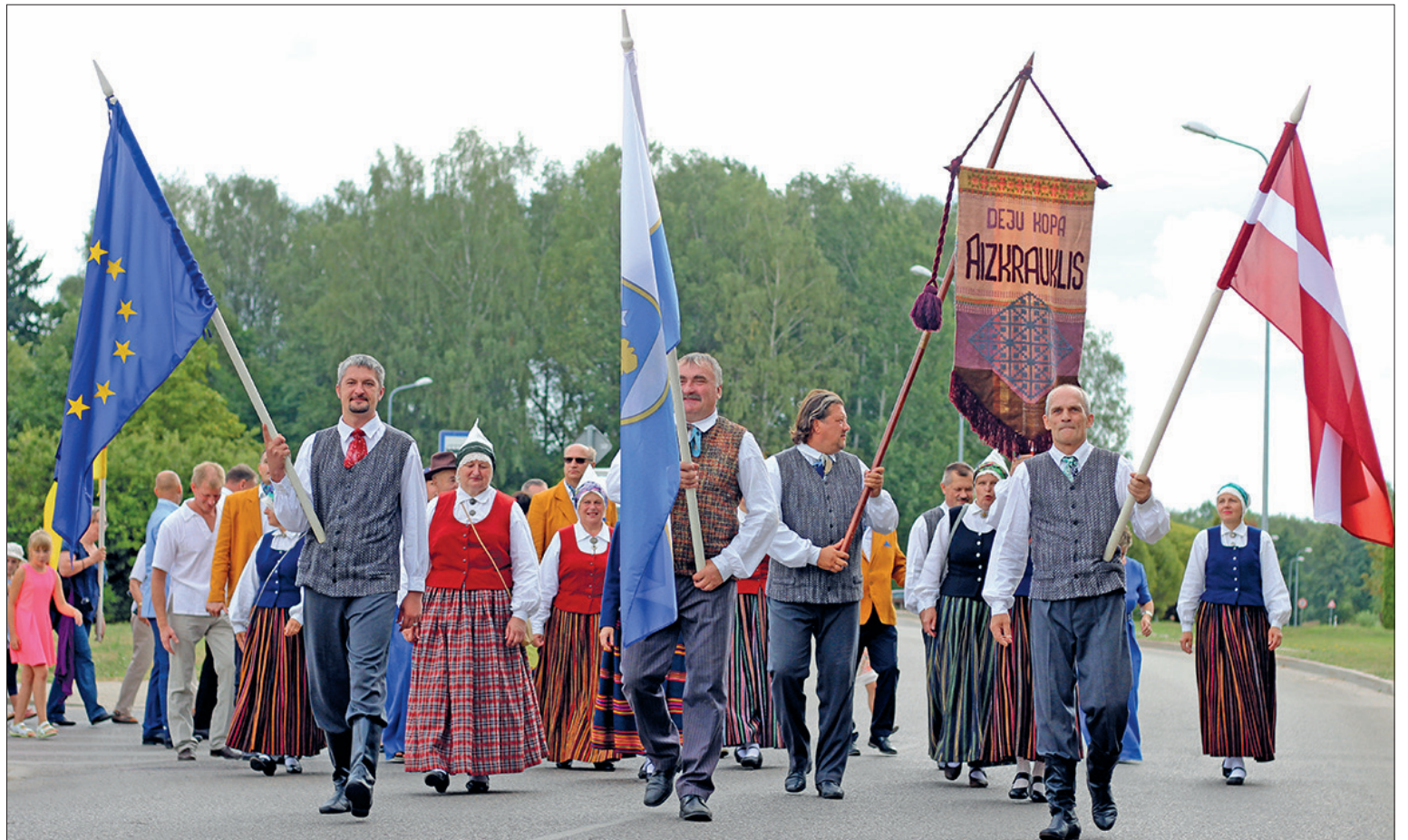
PĒRN AIZKRAUKLES NOVADA SVĒTKU GĀJIENĀ devās ap 500 dalībnieku, tostarp vietējie un sadraudzības pilsētu deju kolektīvi no ārvalstīm.

A izkraukles novada svētkos jau vairāku gadu garumā izveidojusies skaista tradīcija – vienoties kopīgā gājienā, radot prieku gājiena dalībniekiem un arī tā vērotājiem. Pacilātība, krāšņums un piederības sajūta savam kolektīvam un novadam – ar tādiem vārdiem cilvēki raksturojuši savas izjūtas pēc gājiena iepriekšējos gados. Ikviens kolektīvs ir aicināts kļūt par daļu no šī notikuma arī šogad! Tā ir lieliska iespēja parādīt savu organizāciju, radošo izdomu un kolektīvā