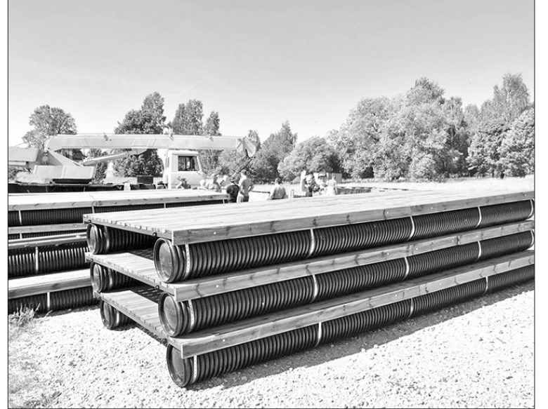
AIZKRAUKLES PAŠVALDĪBA meklēs iespējas pontonu laipas Daugavā ierīkot vairākkārt sezonas laikā.

Lai turpmāk savlaicīgi būtu informēti par plānotajām ūdenslīmeņa izmaiņām Daugavā,