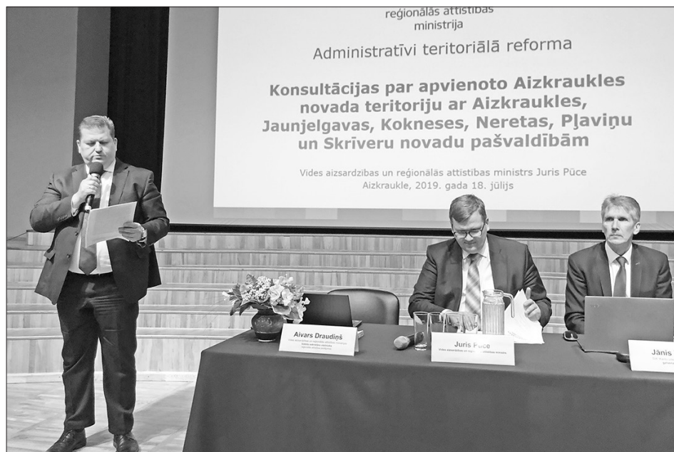
PĒC KONSULTĀCIJĀM ar deputātiem Vides aizsardzības un reģionālās attīstības ministrija plāno tikties arī ar iedzīvotājiem.

Sarunas pirmajā daļā ministrs un eksperti iepazīstināja klātesošos ar reformas rezultātā plānoto jauno novada modeli, kas apvieno visu bijušo Aizkraukles rajona teritoriju, izņemot Valles pagastu. Plašā prezentācijā, kas balstīta uz statistikas datiem, izanalizēja esošo situāciju visos sešos novados, kā arī iespējamo attīstības perspektīvu un reformas ieguvumus. Otrajā daļā ministrs uzklauzīja novadu pārstāvju viedokļus un atbildēja uz jautājumiem. Protams, skatījums uz reformu visiem nav vienāds. Dažos novados pastāv bažas, ka novads zaudēs savu identitāti, ka optimizācijas rezultātā pašvaldībā strādājošie var zaudēt darbu un ka jaunajā novadā vairāk līdzekļu no-