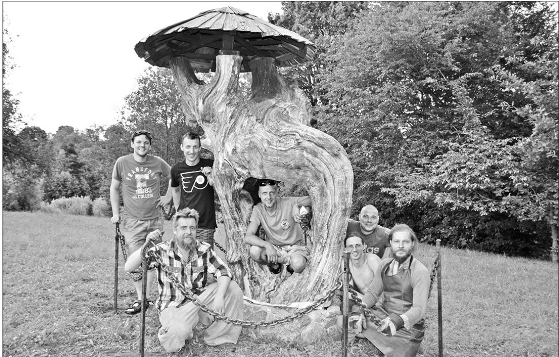
Ceturto reizi notikušajā kalēju dienā tika izkalts dekoratīvs nožogojums Svētozolam.