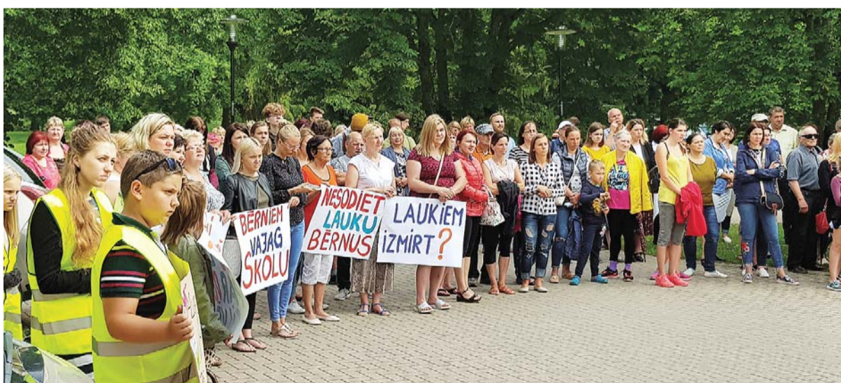
Teju 200 atbalstītāju 13. jūnijā pulcējās pie Alojas Ausekļa vidusskolas, pauzot atbalstu skolas remonta turpināšanai.

lielākā izglītības iestāde novadā un vienīgā, kas realizē vispārējo vidējo izglītību. Tajā mācās 267 skolēni. Jau iepriekšējā mācību gadā visa skolas saime bija spiesta pārcelties uz citām telpām. Lielās skolas ēkā mācības nevarēja turpināties, jo drīzumā bija jāuzsāk remontdarbi. Ēkas ekspertīzē konstatēja virkni nepilnību, kas norādīja uz ēkas bīstamību un katastrofālo stāvokli. Aizvadītajā mācību gadā izglītošanās process notika lielā saspīestībā – foajē, ģērbtuvēs, mūzikas un mākslas skolā, kā arī