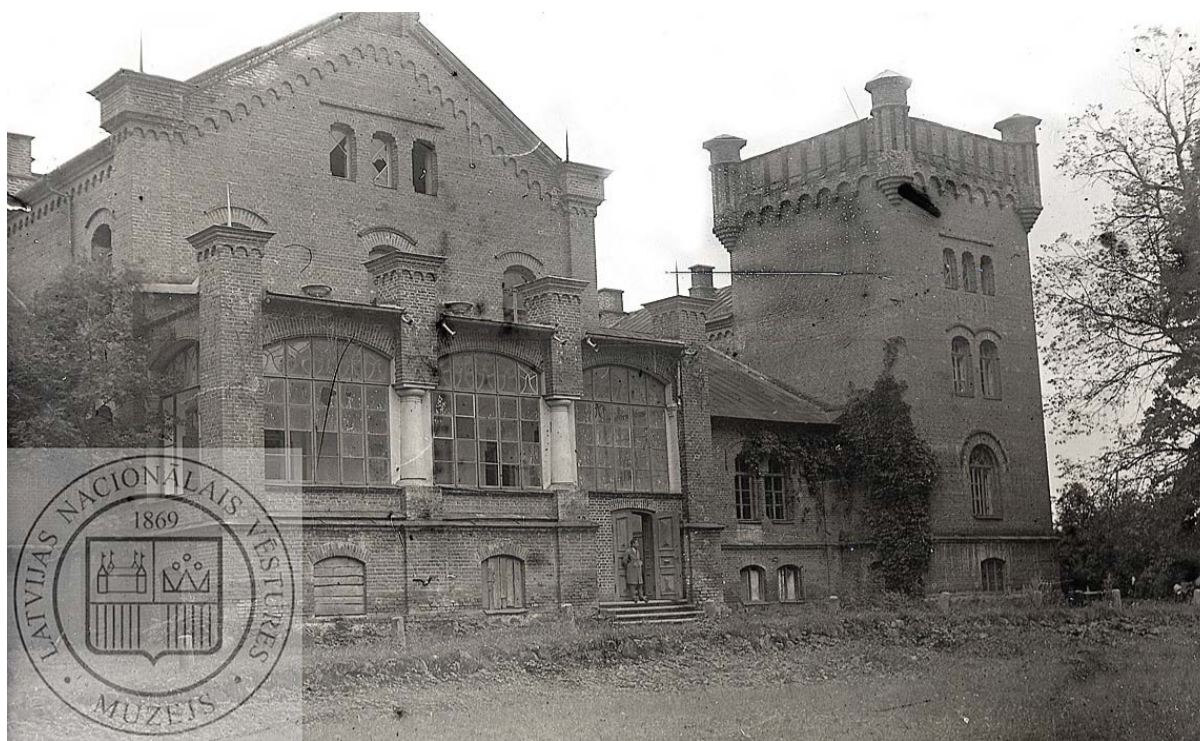
Muižas parādes ieeja, 30. gadi.

1880. gadā par muižnieka Reinholda fon Klotā līdzekļiem pagasta zemnieki sāka celt jaunu pamatskolas ēku „Ķikutos”. 1882. gada 5. oktobrī tā tiek iesvētīta un iegūst nosaukumu „Gaismas”.