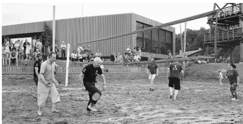
Draudzības spēle badmintonā raisīja lielu skatītāju interesi.