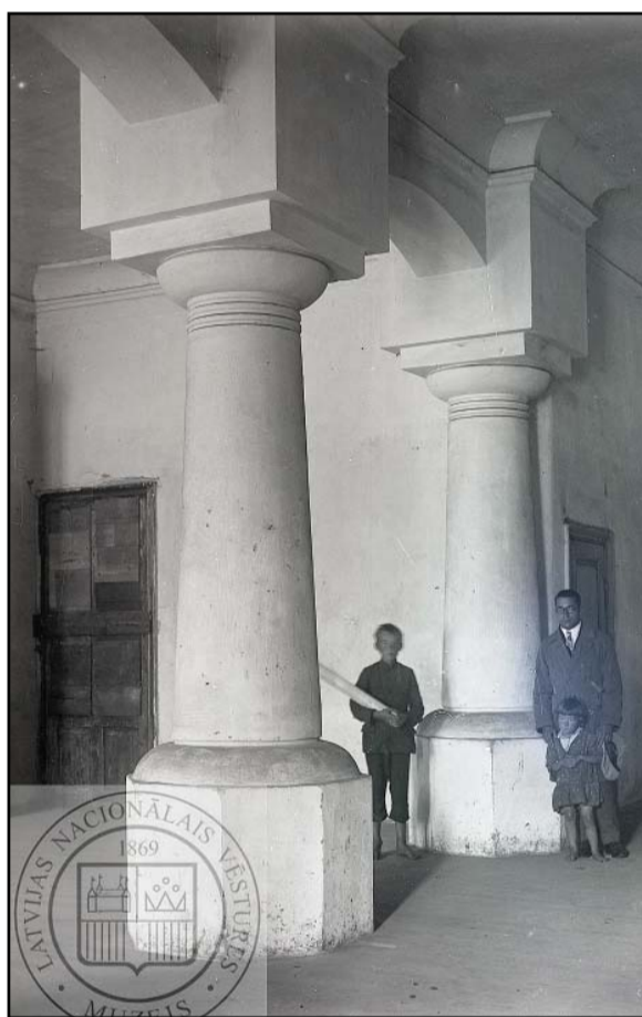
Kolonnu zāle, skats no parādes ieejas, 30. gadi.

Vilhelms Reinholds Gotlībs (1887–1960), kurš bija sestais Puikules muižas īpašnieks, apguva lauksaimniecību un mežsaimniecību Austrumprūsijas muižās.