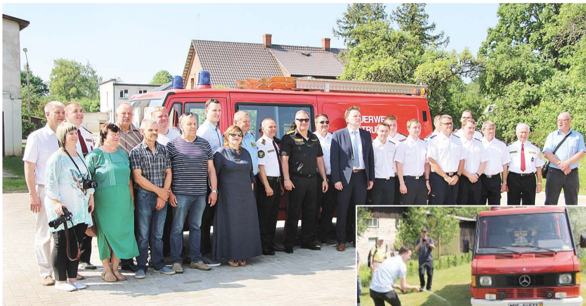
Ugunsdzēsības automašīnas sagaidītāju pulks un vācu delegācija Alojā pēc svinīgā pasākuma.

un automašīnas atslēgu nodošanas, visi sanākušie devās Staiceles virzienā, pa ceļam iegriežoties Ungurpilī, lai apskatītu glez-