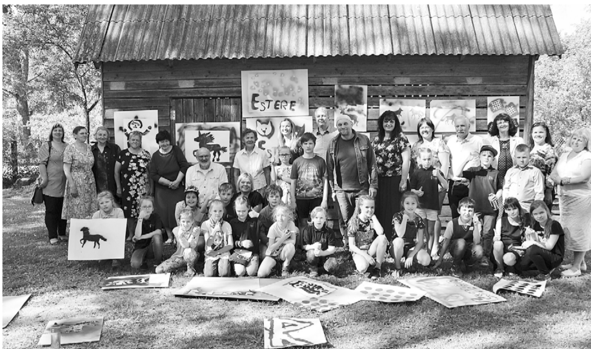
Radošās meistarklases dalībnieku kopbilde.