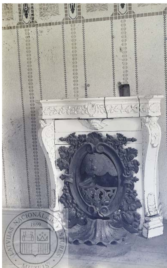
Torņzāles kamīns, 30.gadi.