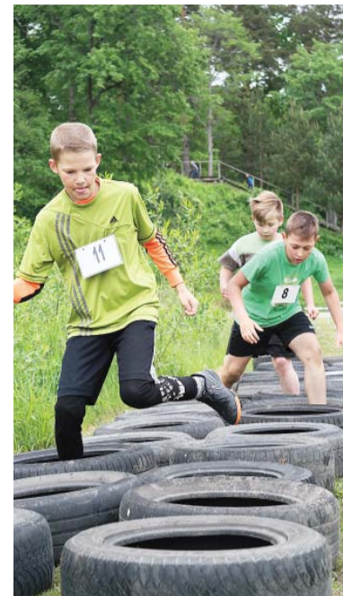
Viens no dalībnieku pārbaudījumiem apvienoja precizitāti un veiklību.

14 – 15 gadu vecuma grupā meiteņu konkurencē 1. vietā