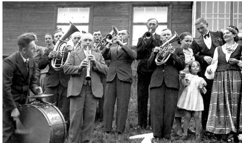
Muzikanti Staiceles parkā.