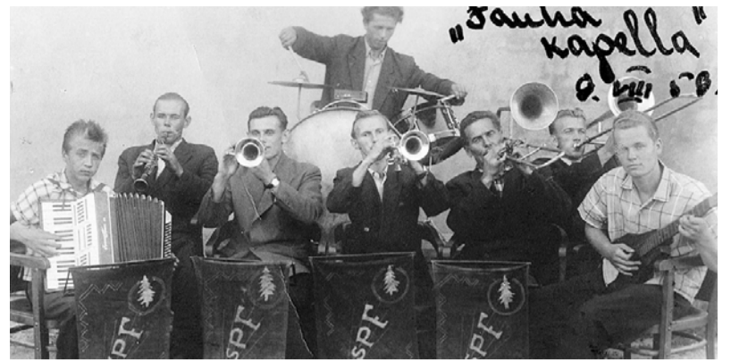
Staiceles muzikanti, 1959. gads.