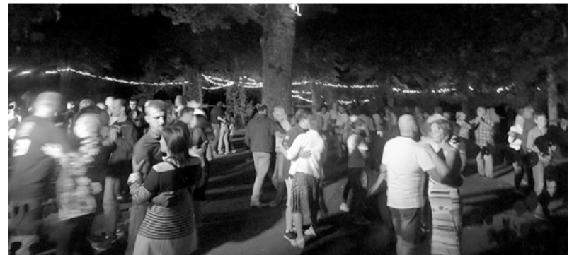
Smtgades zaļumballe „Zem ozola”.