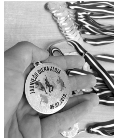
Pilsētas svētku ietvaros norisinājās arī Jauniešu diena 2019, šis notikums pulcēja kuplu skaitu dalībnieku.