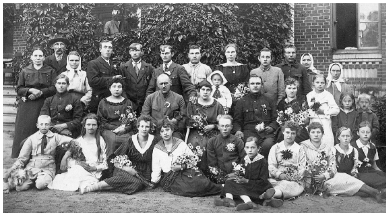
Zaļumnieki pie Viķu muižas.