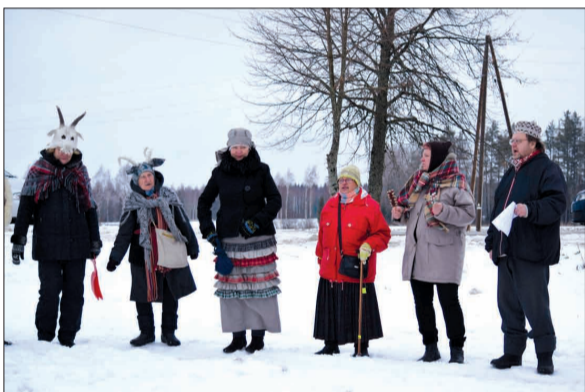
"Mežābele" Meteņos Mūrmuižā