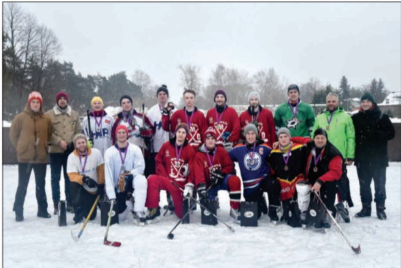
Ziemas sporta dienas dalībnieki