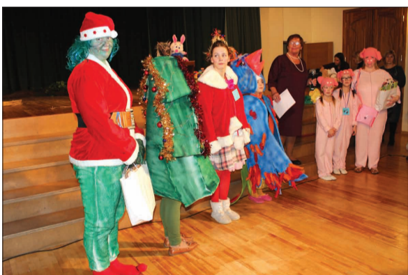
Bērnu karnevāla labākās maskas