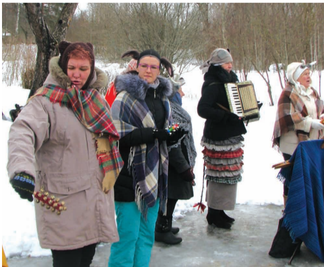
Folkloras kopa "Mežābele" Meteņu jampadraci Zilākalnā

"Piecas reiz deviņas dienas pēc Ziemsvētkiem pār kalniņu latvju sētās ierodas Dieva dēls Metenis – vārtu vērējs ilgi gaidītam pavasarim. Ziema metas uz pavasara pusi. No Meteņa dienas sāka skaitīt laik-metus jeb gadalaikus. Tā saukta arī par Laimas dienu: "...par Meteņa dienu mēdza teikt, ka šīs dienas vakarā Laima metot savas dāvanas, no kā tad arī cēlies vārds Metenis", – tā rakstīts "Cēsu Ziņās" pirms vairāk kā 100 gadiem.