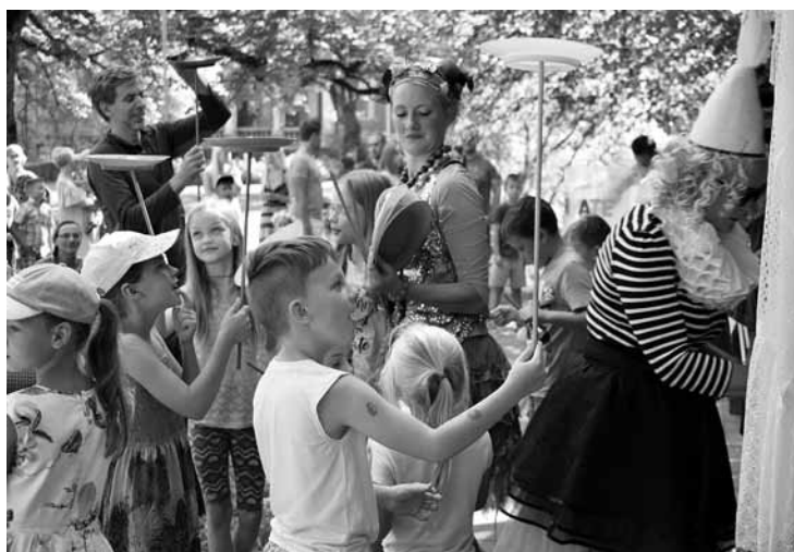
Katrs varēja pamēģināt kādu cirka triku, piemēram, šķīviša dancināšanu.