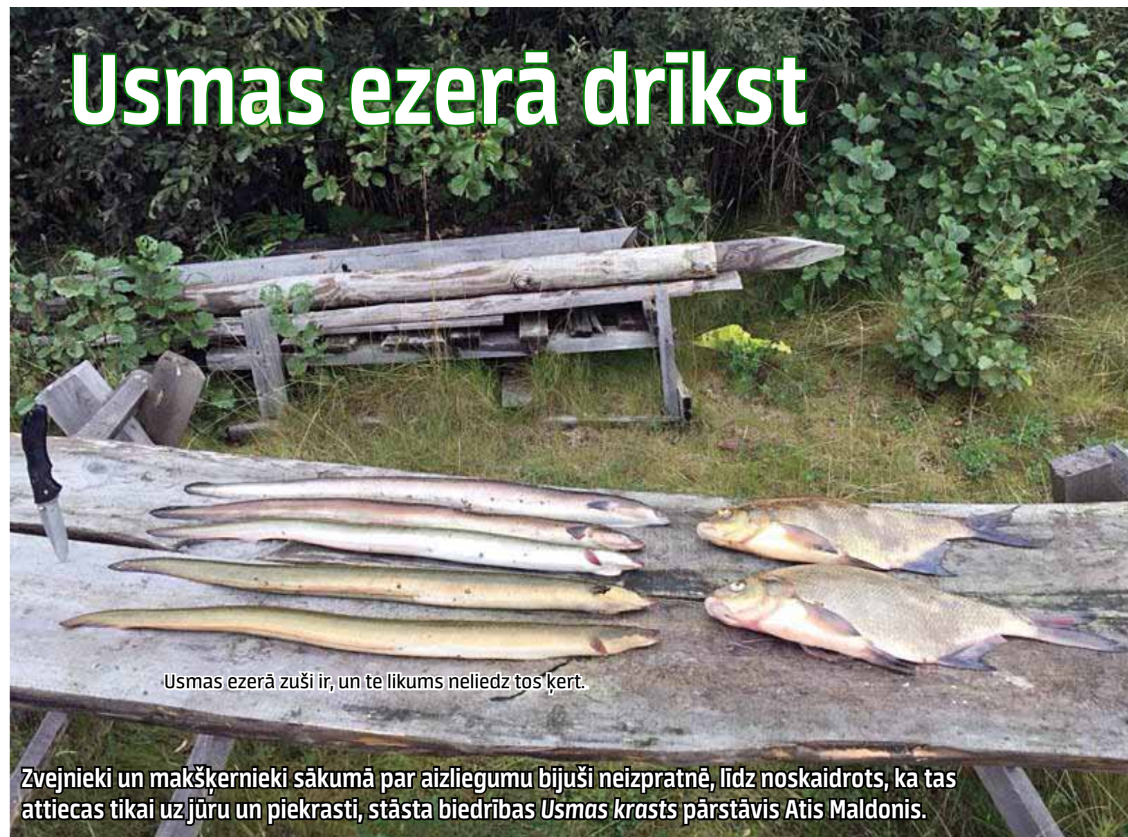
Usmas ezerā zuši ir, un te likums neliedz tos ķert.

Lai Eiropas zuti saglabātu nākamajām paaudzēm, PDF aicina sabiedrību pievienoties kampaņai Lai jūra čum un mudz , un tāpat kā mencas, arī zušus veikalos un citur nepirkt. Fonds kopā ar ES vides organizācijām arī aicinājis Eiropas Komisiju un dalībvalstu valdības ierobežot apraudzēto sugu nozveju, bet Eiropas zuša zveju apturēt pilnībā.