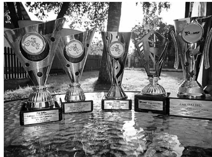
Gada laikā izcīnītās godalgas.