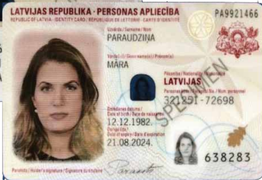
FOTO TRĪS VIETĀS

Valsts nodeva par dokumenta izsniegšanu mazāk nodrošinātajiem (bērniem līdz 20 gadiem, pensionāriem un cilvēkiem ar invaliditāti) samazināta no 7,11 līdz pieciem eiro. Citiem summa noapaļota uz augšu – no 14,23 eiro līdz 15. Parastā kārtībā apliecību izsniedz desmit darb dienās, paātrinātā – divās dienās, bet dārgāk. Mainījies arī nodeva par pases izsniegšanu atsevišķām iedzīvotāju grupām un pakalpojumu veidiem.