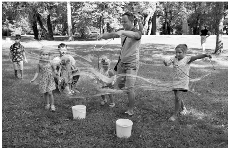
Lielie ziepju burbuļi sajūsmināja ne tikai Pelču pagasta bērnus, bet arī vecākus.