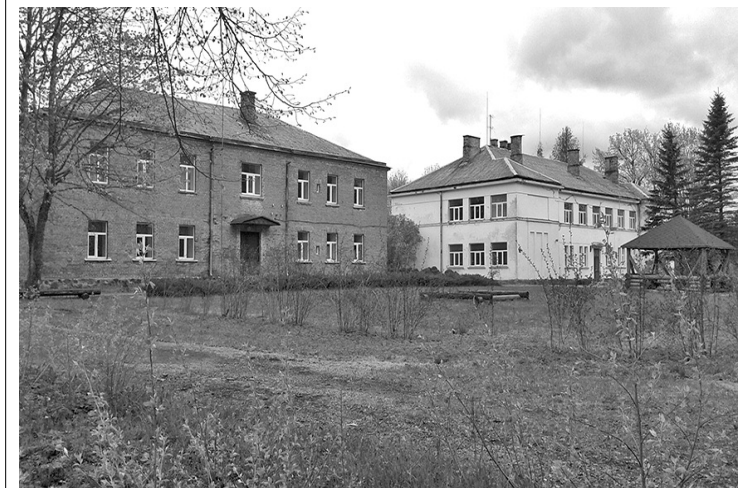
Šī gada 8. augustā notiks pašvaldībai piederošā īpašuma – Silajāņu pamatskolas mutiska izsole ar augšupejošu soli.

Riebiņu novada dome 2019. gada 8. augustā plkst. 11.00 Riebiņu novada domē (2. stāva 206. kabinetā) Saules ielā 8, Riebiņos rīko sev piederošā nekustamā īpašuma «Skolas», Silajāņu pagastā, Riebiņu novadā, ar kadastra numuru 7676 004 0455 mutisku izsoli ar augšupejošu soli.