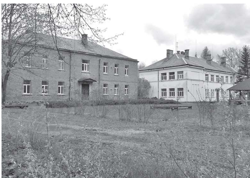
8 августа этого года состоится аукцион продажи принадлежащего самоуправлению имущества – здания Силаянской основной школы.

Дума Риебиньского края 8 августа 2019 года в 11.00 часов в здании Риебиньской краевой думы на ул. Саулес, 8 (2 этаж, 206-й кабинет) организует аукцион продажи принадлежащего ей недвижимого имущества «Сколас» в Силаянской волости Риебиньского края, кадастровый номер 7676 004 0455. Вид торгов – устные торги с поступательным шагом.