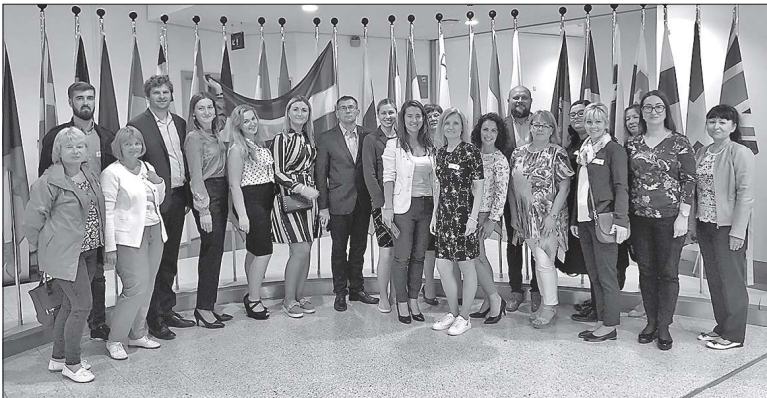
Участники визита в Брюссель: специалисты по связям с общественностью из самоуправлений Циблы, Вецумшьеки, Алуксе, Энгуре, Кулдиги, Лудзы, Даугавпилса, Лиенаи, Риебини, Озолниеки, Ризи и Яунпилса, а также, представители регионального планирования Курземы и Видземе, Общества латвийских самоуправлений, журналисты Курземского радио, «Латгалес лайкс» и Латгалес студии Латвийского Радио.

С 11 по 14 июня у специалистов латвийских самоуправлений по связям с общественностью и представителей медиа была возможность принять участие в учебном визите в Европейскую Комиссию и Европейский Парламент в Брюсселе (Бельгия), организованном представительством Европейской Комиссии в Латвии.