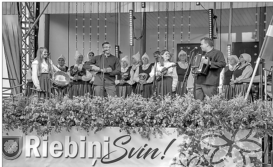
Attēlā: Ar Riebiņu novada ļaudīm svētkus kopā svinēja kapela «Augusti» un folkloras kopu «Jumaleņa» un «Vydsmuiža» dalībnieki.