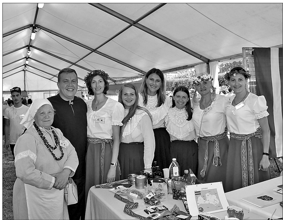
Riebiņu novada delegācija 10. Eiropas sanāksmē Francijā.