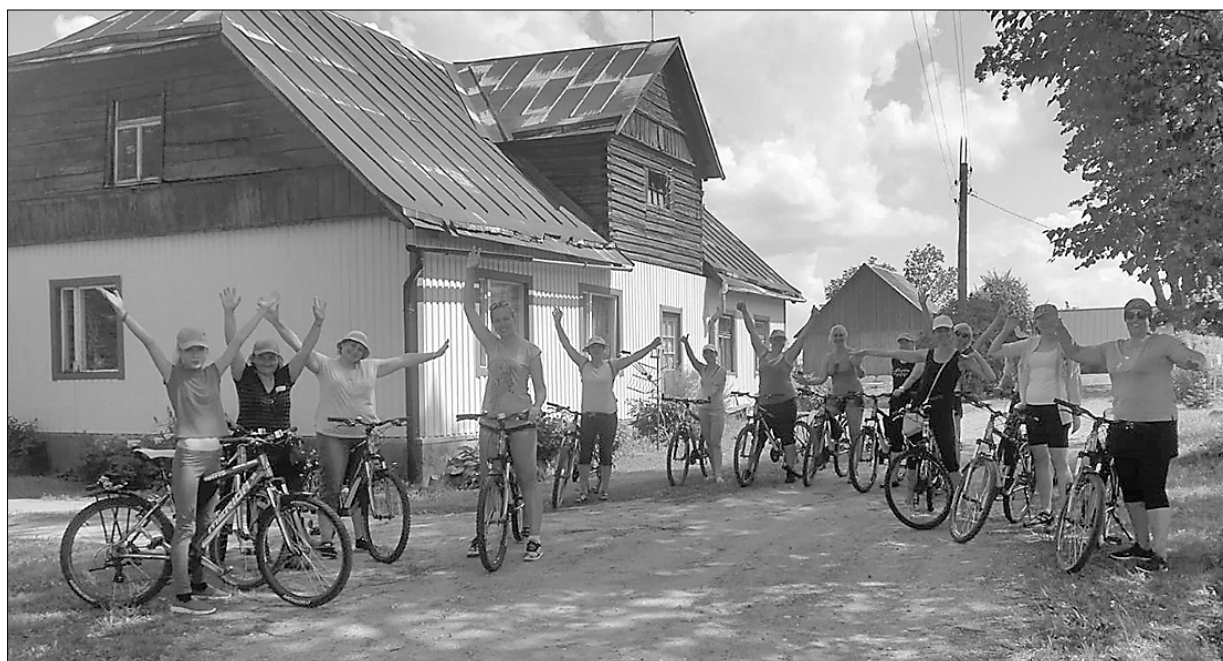
Noguruši, bet laimīgi. Nometnes dalībnieki ar riteņiem pievarēja 26 km.

Pasākuma «Veselīga dzīvesveida nometne» Eiropas Sociālā fonda projekta Nr. 9.2.4.2/16/I/099 «Veselības veicināšanas un slimības profilakses pakalpojumu uzlabošanas pasākumi Riebiņu novadā, 1. kārtā» ietvaros tika organizēta trīs dienu dienas nometne par Veselīgu dzīvesveidu, kurā dalībnieki klausījās gan lekcijas, gan piedalījās dažādās fiziskajās aktivitātēs. Šo nometni organizēja Riebiņu novada dome un biedrība «Ģimeņu atbalsta centrs «Puķuzirnis»».