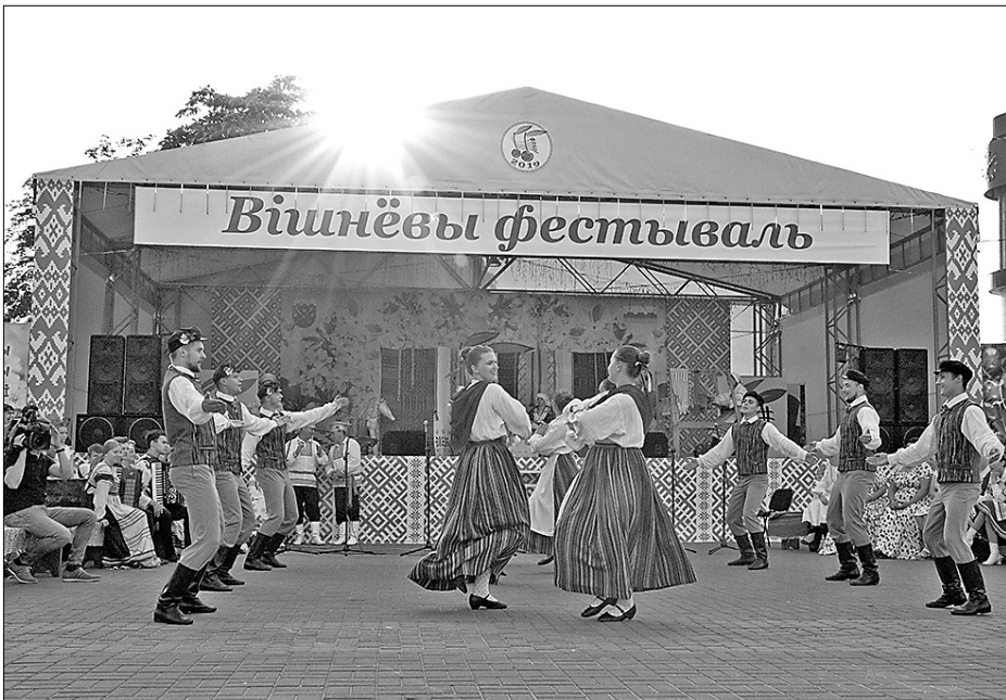
Festivālā Baltkrievijas pilsētā Glubokoje Riebiņus pārstāvēja Riebiņu novada Kultūras centra jauniešu deju kopa «Strūga».