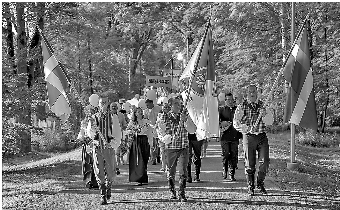
Attēlā: Novada svētku neatņemama sastāvdaļa – svētku gājieni uz Riebiņu parka estrādi.