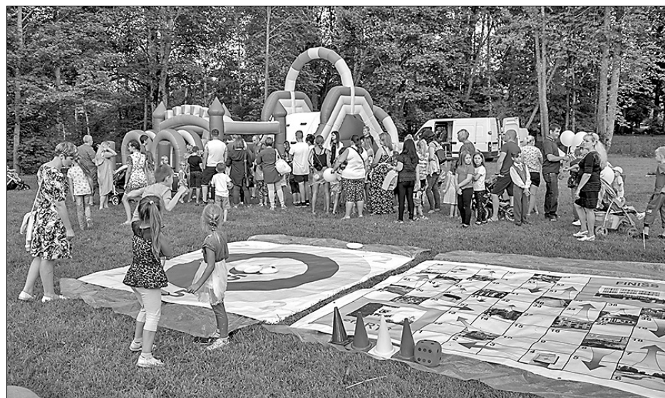
Dažādas aktivitātes tika piedāvātas svētku jaunākajiem dalībniekiem.