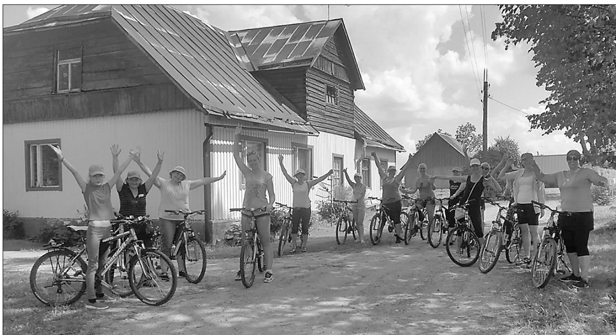
Усталые, но счастливые. Участники лагеря на велосипедах преодолели 26 км.

В рамках проекта Европейского Социального фонда № 9.2.4.2/16/1/099 «Мероприятия улучшения услуг способствования здоровью и профилактики заболеваний в Риебиньском крае, 1 очередь» был организован трёхдневный «Лагерь здорового образа жизни», участники которого слушали лекции и принимали участие в различных физических активностях. Лагерь организован думой Риебиньского края и обществом «Центр поддержки семей «Puķuzirnis»».