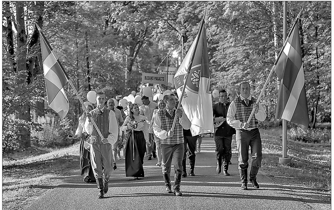
Неотъемлемая составная часть праздника края – праздничное шествие к эстраде Риебиньского парка.

С 26 по 28 июля в Риебине прошёл праздник края 2019 «Наколдуй счастье». Участники праздника в течение трёх дней могли наслаждаться теплой солнечной погодой, а также, провести эти дни в позитивной праздничной атмосфере. Празднование началось уже в пятницу вечером с киносеанса, организованного молодежным центром «Ступени», а в субботу состоялся главный концерт праздника, который был открыт ярким праздничным шествием жителей Риебиньского края, на котором были представлены учреждения края и коллективы самодеятельности. Всех участников праздника приветствовал председатель думы Риебиньского края Петерис Рожинскис.