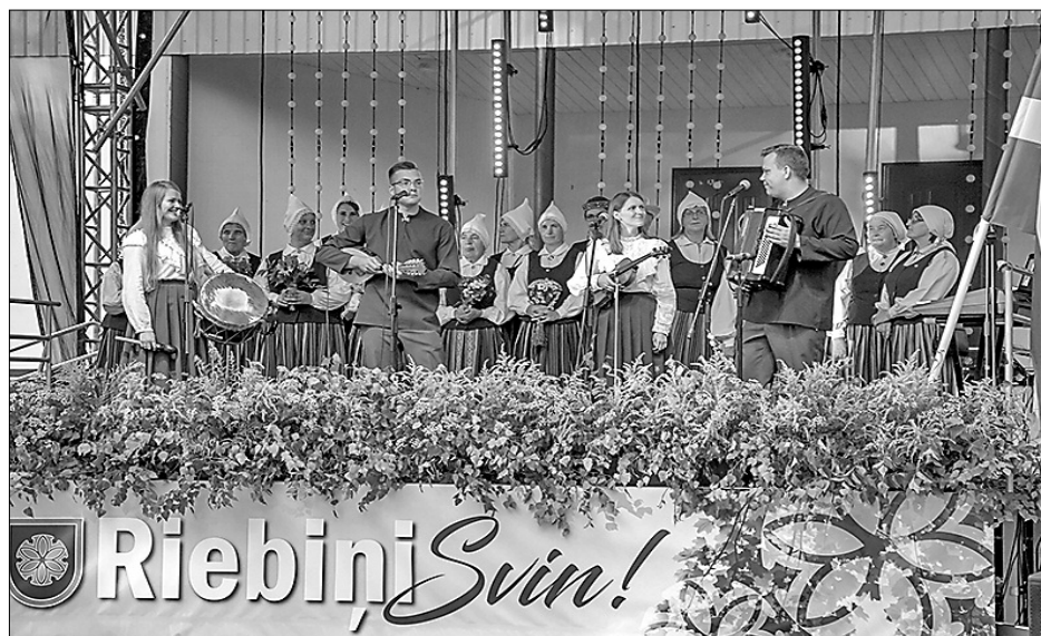
Вместе с жителями Риебиньского края праздник отмечали капелла «Аугусти» и участники фольклорных коллективов «Юмаленя» и «Видсмуйжа».