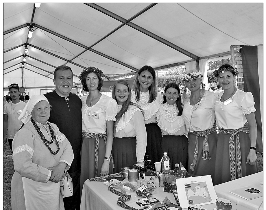
Делегация Риебиньского края на 10-м Европейском собрании во Франции.