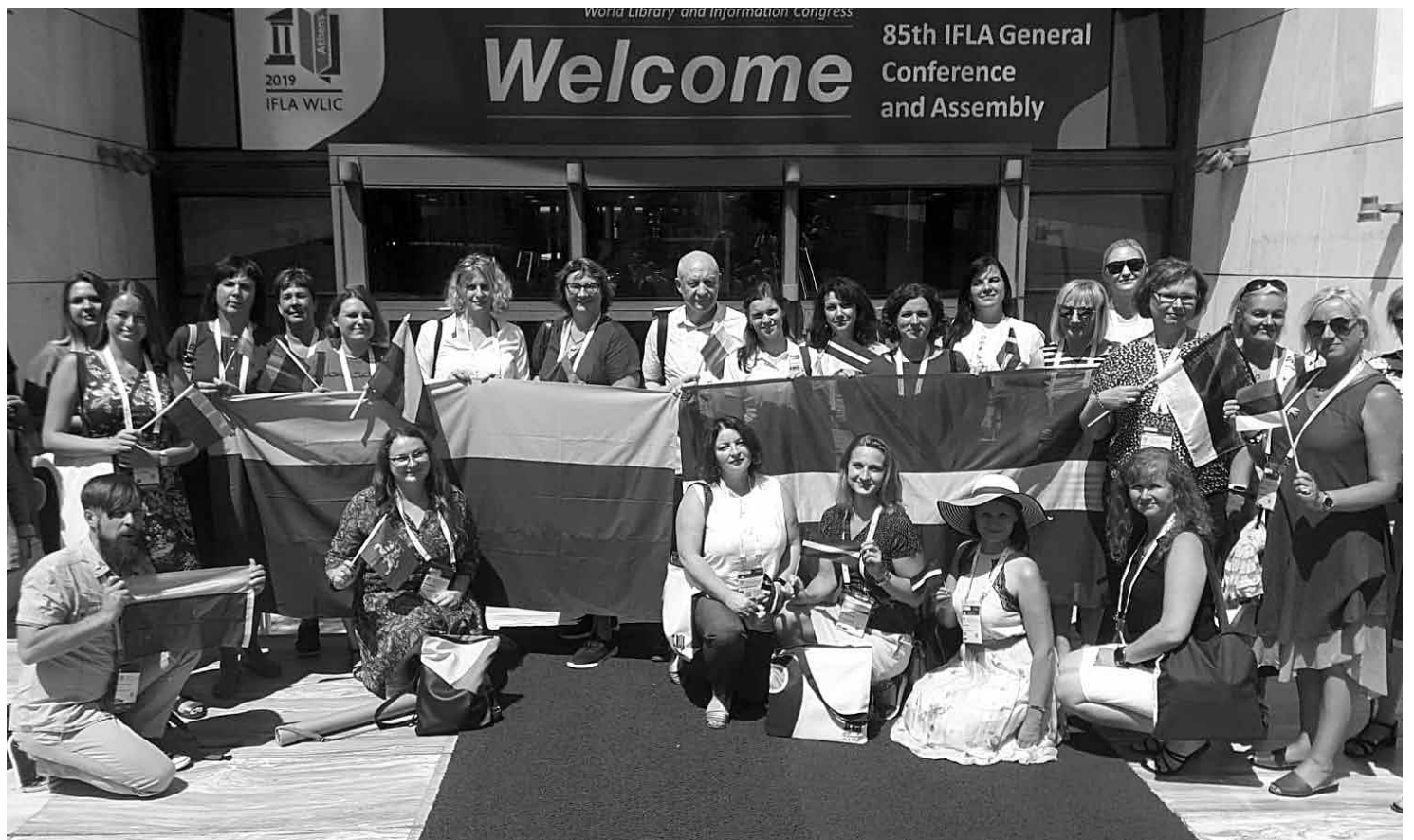
Vispasaules bibliotēku un informācijas kongresa laiks sakrita ar Baltijas ceļa 30. gadadienu. Latvijas, Lietuvas un Igaunijas delegācija vienotās atceres pasākumā pie ieejas konferenču centrā Atēnās.