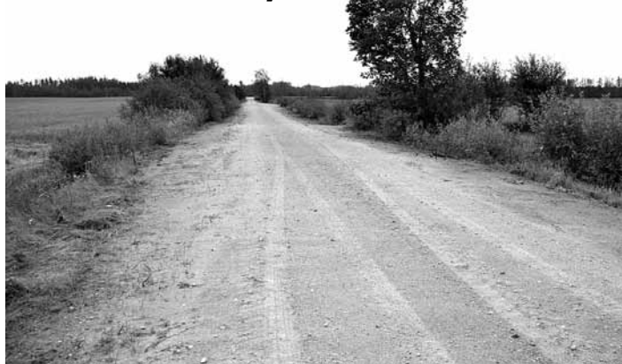
Tiek remontēts ceļa posms Rīgmaļi-Ūjas.