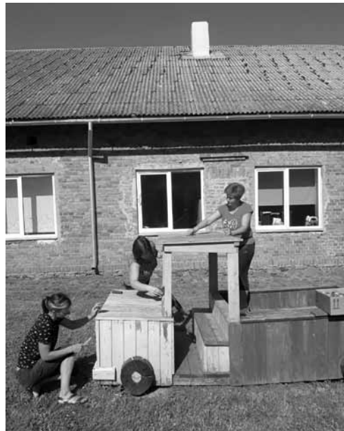
Ar konkursa Darīsim paši atbalstu atjaunots pirmsskolas izglītības grupas Lāčuks rotaļu laukums un izveidota sajūtu taka. Darbā piedalījies gan skolas kolektīvs, gan bērnu vecāki.