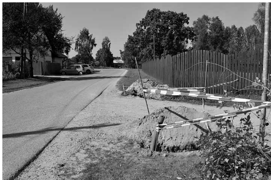
Ābeles ciemā top centrālās ielas apgaismojums. Pagaidām būs 13 laternas.

ielas apgaismojums Ābeles ciemā izmaksās 26 885 eiro: projektēšanai – 1815 eiro, būvuzraudzībai – 1936 eiro, būvniecībai – pārējā summa.