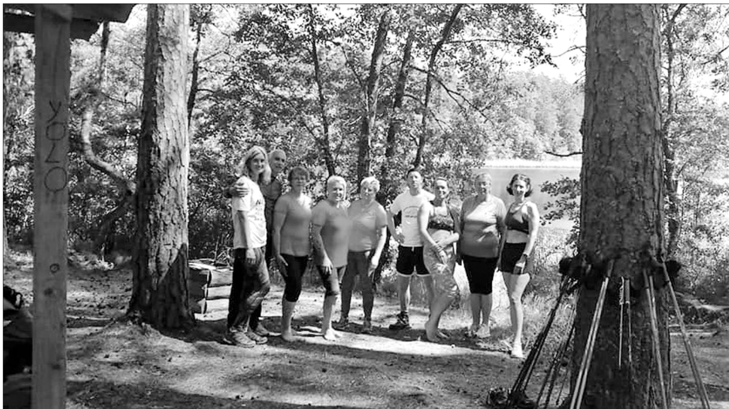
Pārgājiena dalībnieki atelpas brīdī.