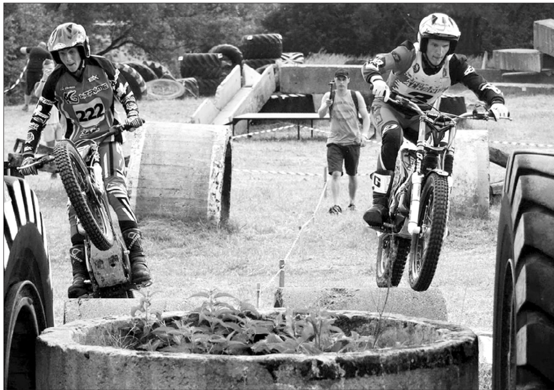
Sacensībās startēja arī mototriālisti.