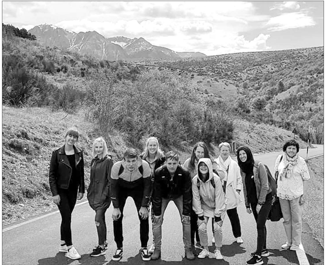
Uģālnieki saulainajā Itālijā.

Lai arī braucieni ekskursijās bija svarīga šī projekta daļa, tomēr vissvarīgākais bija cilvēki, kurus mēs iepazīnām nedēļas laikā – gan viesģimenes, gan visi pārējie projekta dalībnieki. Šajā nedēļā izbaudījām itāļu ģimeņu viesmīlību, mums tika piedāvāta izdevība, ko nevar aizstāt ar jebkāda veida ekskursijām, – mēs varējām iepazīt autentisko Itālijas sabiedrību. Kaut arī daudzi cilvēki nerunāja