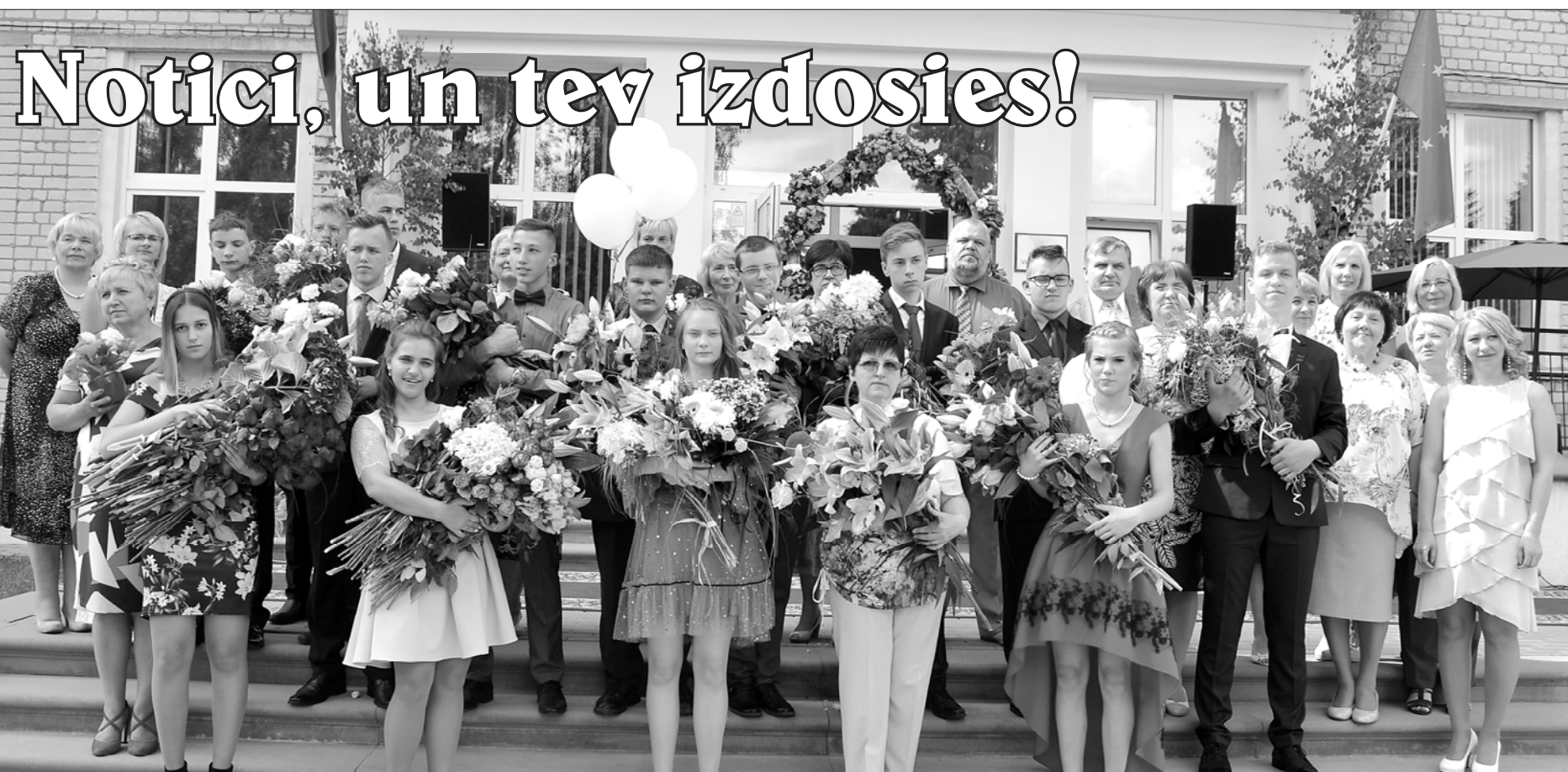
Ugāles vidusskolas devītās klases absolventi ar pedagogiem.