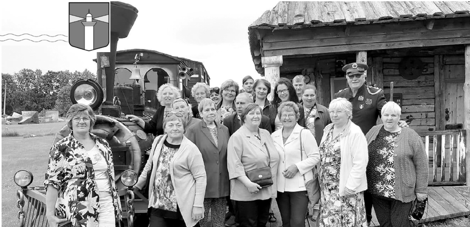
Užavas seniori ekskursijā redzēja daudz interesantu lietu.