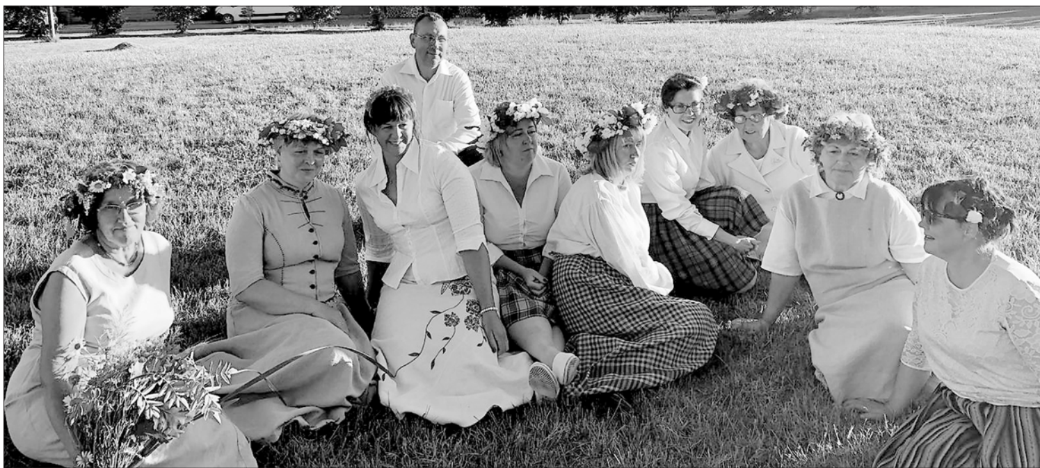
Sieviešu vokālā ansambļa "Saiva" dziedātājas.