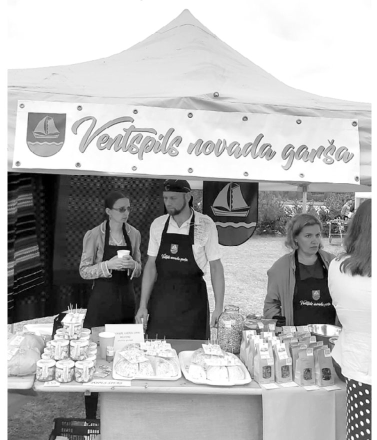
Ventspils novada uzņēmēji pasākumā "Nogaršo Latviju Kurzemē".