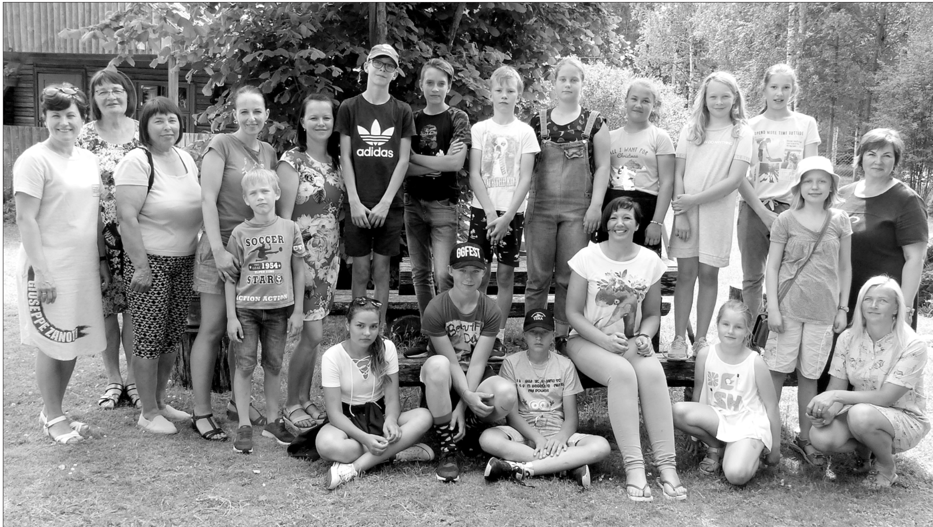
Projekta dalībnieku prieks par iegūtajām vērtīgajām zināšanām vācu valodā.