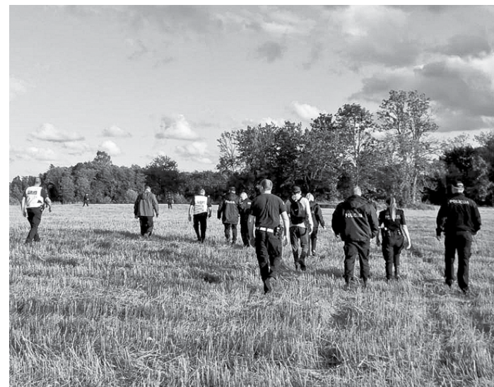
Ap 50 policistiem vairāk nekā trīs stundas meklēja Snēpeles mežā nomaldījušos sievieti.