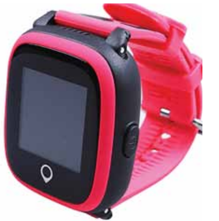
GPS pulkstenis bērniem Gudrutis R10 Roza. Šim pulkstenim raksturīga izturība un stingrums – lai mūsu supervaroņi varētu droši precīzies par mazām palaidinībām, bet vecāki būtu mierīgi par sava bērna drošību.

Bērnu drošības pulksteni iespējams ievadīt tikai dažus telefona numurus, kurus bērns varēs sazināt. Tāpat iespējams norādīt telefona numurus, no kuriem būs iespējams piezvanīt uz bērna pulksteni, un tas nepieņems zvanus no citiem. Pulksteni izslēgt var tikai aplikācijā, bērns pats to izdarīt nevar.