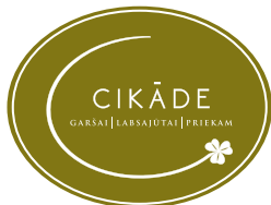
Konkursu atbalsta veikals Cikāde.