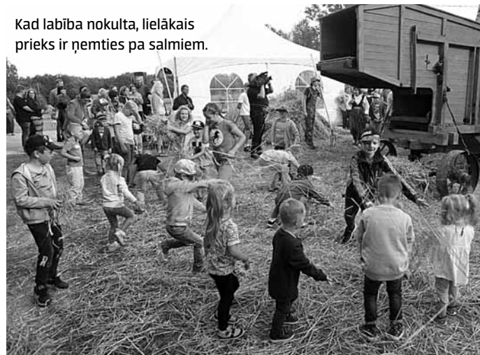
Kad labība nokulta, lielākais prieks ir ņemties pa salmiem.