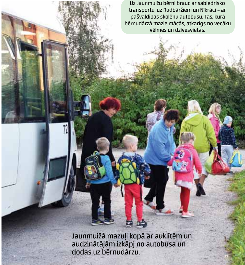
Uz Jaunmuižu bērni brauc ar sabiedrisko transportu, uz Rudbārziem un Nīkrāci – ar pašvaldības skolēnu autobusu. Tas, kurā bērnudārzā mazie mācās, atkarīgs no vecāku vēlmēs un dzīvesvietas.

I.Flugrāte turpina: „Bērnudārza darbinieki, kuri brauc kopā ar bērniem uz Jaunmuižu šajā autobusā, ir kā pavadoņi. Tas viņiem iekļaujas darba laikā. Nav noteikumu, uz cik bērniem vajag vienu pavadoņi, bet uz Jaunmuižu brauc diezgan daudz darbinieku, sākumā pat sanāca uz trim bērniem viens. Maršrutā iekļauta vēl viena jauna pietura – Jaunmuižas skola, bērni ar pavadoņiem izkāpj. Arī atpakaļceļā tika mainīts sabiedriskā transporta kustības grafiks. Sešos vakarā no Jaunmuižas skolas bērni ar pavadoņiem