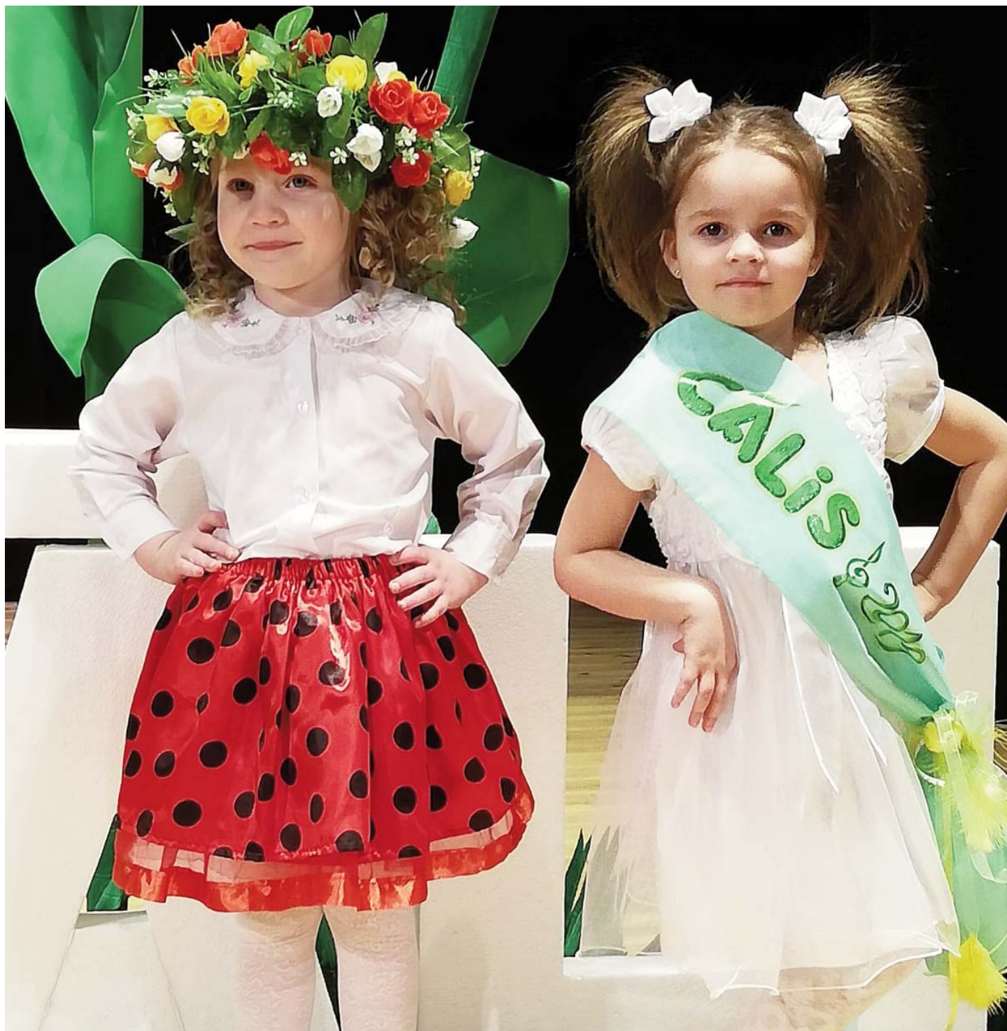
Mazo vokālistu konkurss „Cālis – 2019”