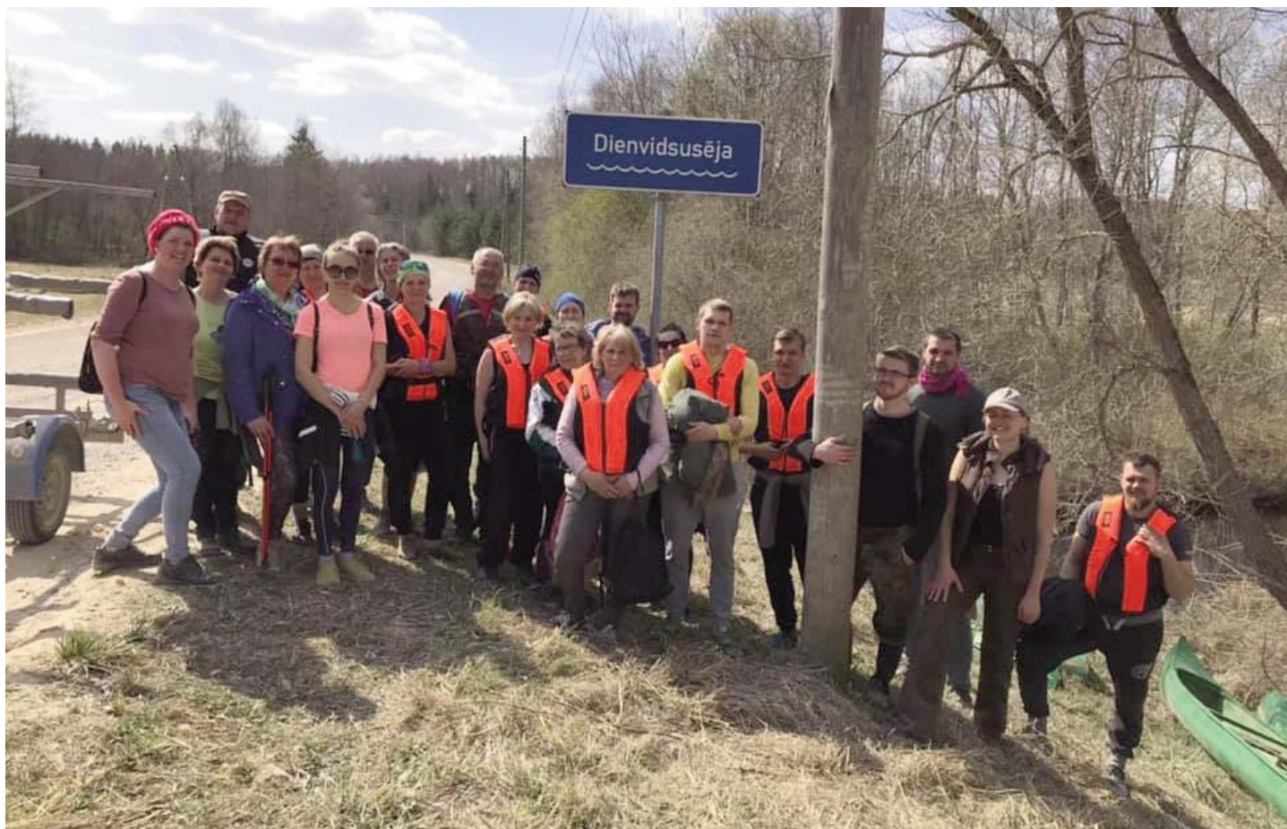
Turpinājums 15. lpp