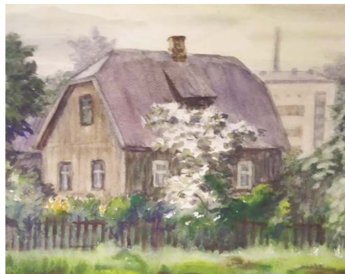
1. Irma Vīksne jaunībā