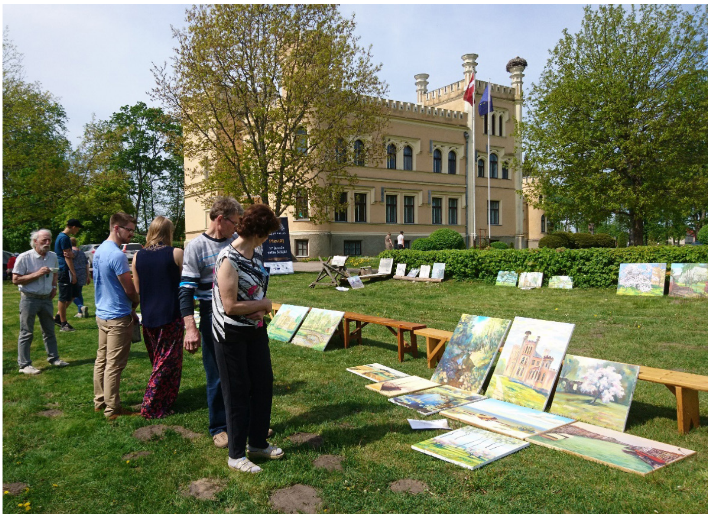
Pasākums “Gārsene – bagātību Sala”. Turpinājums 12. lpp