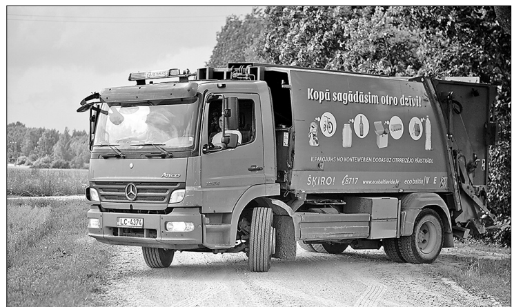
Kopumā SIA «Eco Baltia vide» rīkotās «Stikla šķiratlonis» akcijas ietvaros Riebiņu novadā tika savāktas 7,14 tonnas stikla.