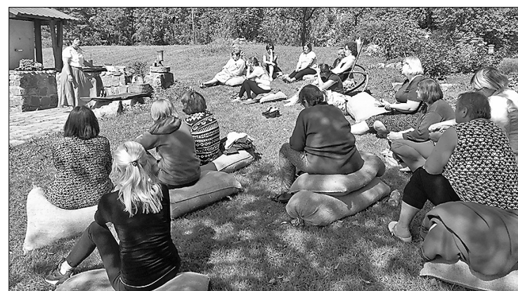
Daudzas nometnes nodarbības bija saistītas ar sevis izzināšanu un prāta miera stāvokli, ko vislabāk bija panākt, atrodoties ārpus telpām.

Kopumā vērtējot, var izdarīt secinājumu, ka pasākums ir bijis efektīvs attiecībā uz Riebiņu novada iedzīvotāju garīgo veselību un veselīgo dzīvesveidu, jo pasākuma laikā novadītās lekcijas sniedza teorētisko un praktisko informāciju par dzīves kvalitāti – emocionālo labsajūtu, kādā veidā