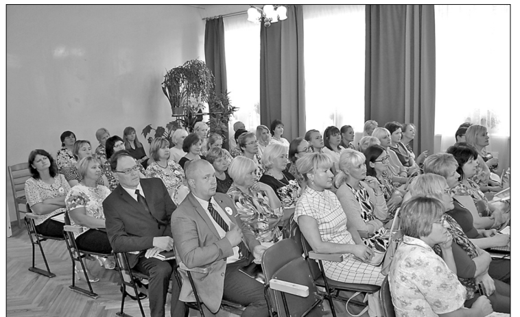
Novada skolotāji jau tradicionāli īsi pirms jaunā mācību gada sanāk uz kopīgu konferenci. Šogad – Galēnu pamatskolā, kura ir ESF projekta «Kompetenču pieeja mācību saturā» pilotskola.

Īsi pirms jaunā mācību gada – 29. augustā Galēnu pamatskola, kā ESF projekta «Kompetenču pieeja mācību saturā» pilotskola, organizēja konferenci Riebiņu novada pedagogiem, kur dalījās pieredzē gan ar intensīvās apmācības iegūto, gan mācību procesā ieviestos darbus ar pētniecības metodēm, prezentējot konkrētu tēmu; izskatīja 9 mācību notikumus stundā (pēc R. Gagne), atkārtotot teoriju un minot piemērus no prakses, kā arī izsniedza materiā-