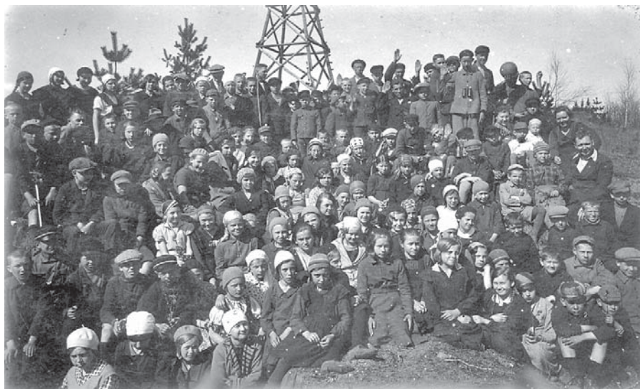
“Sēlpils skolēni pie skatu torņa Taborkalnā 20. gs. I pusē”; Salas novada pašvaldības arhivs

Laimīgi atgriezies uz zemes un tad apjautu, ka trīs kājas. Dīvaini, jo baiļu sajūtas nebija nevienu brīdi. Beidzot sapratu, ka starp pakāpieniem bija tik lielas atstarpes, ka personīgais svars bija