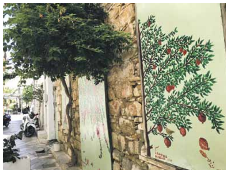
Ieliņas ir šauras, romantiskas un dienas laikā pustukšas.