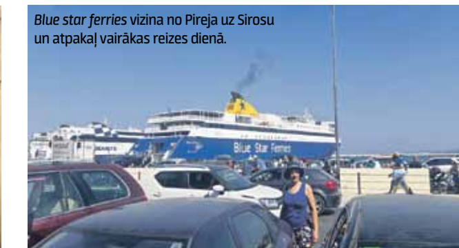
Blue star ferries vizina no Pireja uz Sirosu un atpakaļ vairākas reizes dienā.