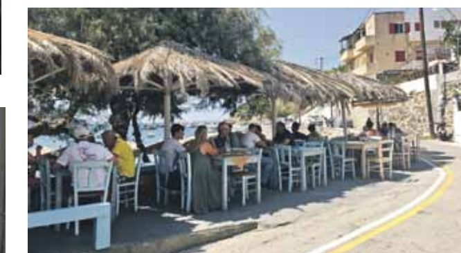
Kafejnica Aeiko Kini pludmalē.