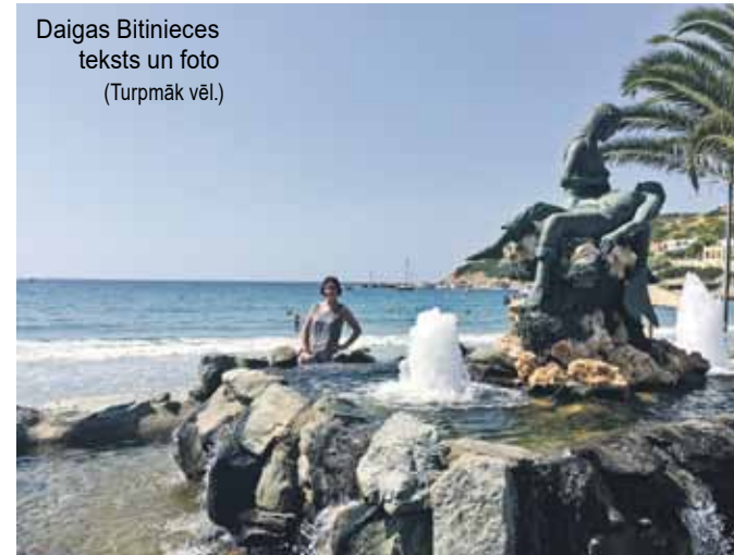
Daigas Bitīnieces teksts un foto (Turpmāk vēl.)