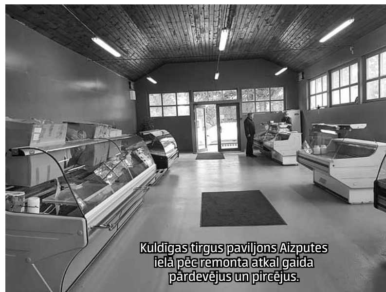
Kuldīgas tirgus paviljons Aizputes ielā pēc remonta atkal gaida pārdevējus un pircējus.

Tomēr, ņemot vērā izplatību kaimiņvalstīs, PVD aicina mājdzīvniekus regulāri pret trakumsērgu potēt, kā arī ziņot veterinārārstam vai PVD par katru šīs slimības aizdomu gadījumu.