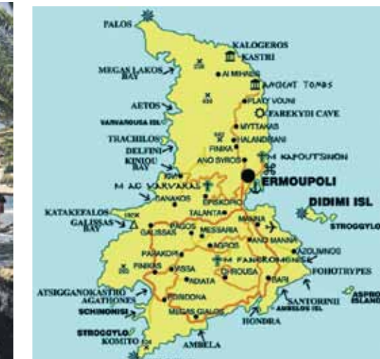
Sirosas sala ar 20 tūkstošiem iedzīvotāju atrodas 144 km no Atēnām.