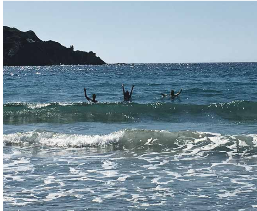
Kini pludmalē parasti ir lieli un stipri vilņi.