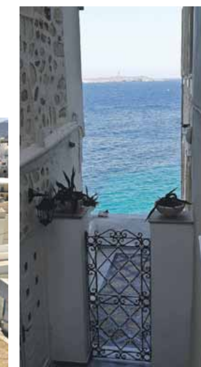
Skats uz Egejas jūru caur kādu Sirosas ieliņu.