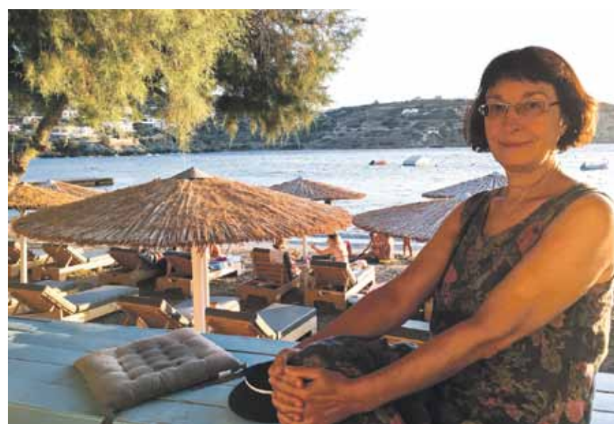
Vakariņu laiks Kini pludmalē.