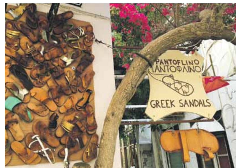
Mazie veikaliņi reklamējas, kā nu katrs izdomā.