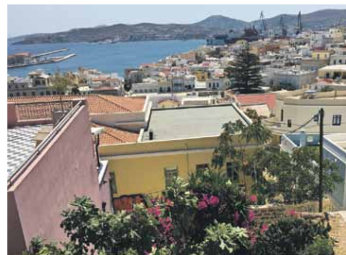
Skats pa logu no nakstmitnes.

AEGEE* – saīsinājums no franču valodas, pilnā vārdā Association des Elats Généraux des Etudiants de l'Europe jeb Eiropas Studentu forums