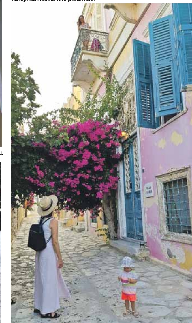
Ēka Siroasā, kur dzīvojam.