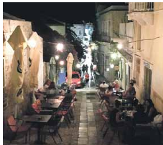
Vakara noskaņas ir visromantiskākās.