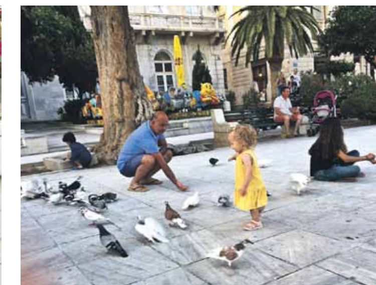
Sirosas galvenais laukums pašvaldības administrācijas ēkas priekšā ir pilns baložu un mazu bērnu.