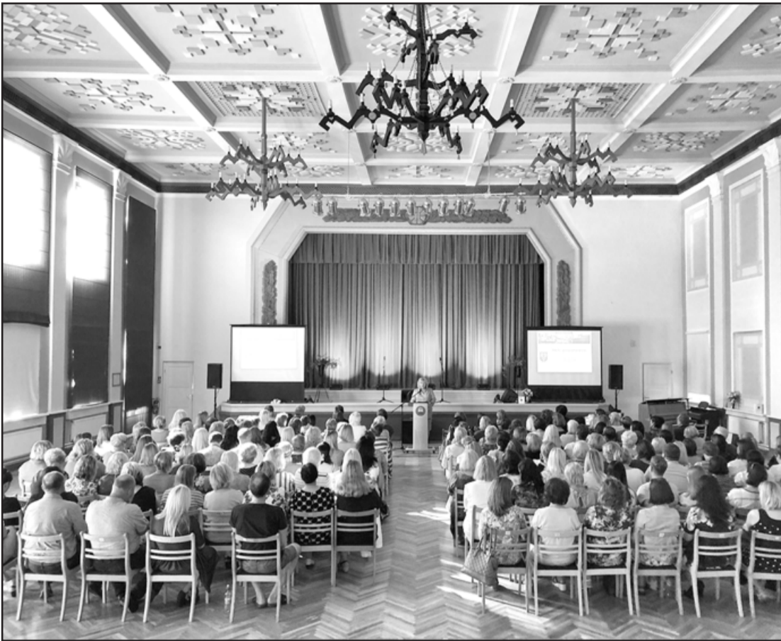
Pedagogu mācību gada ievadsanāksme Kazdangā