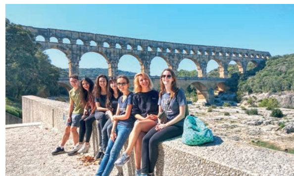
Pie Pont du Gard, augstākā romiešu akvedukta pasaulē.