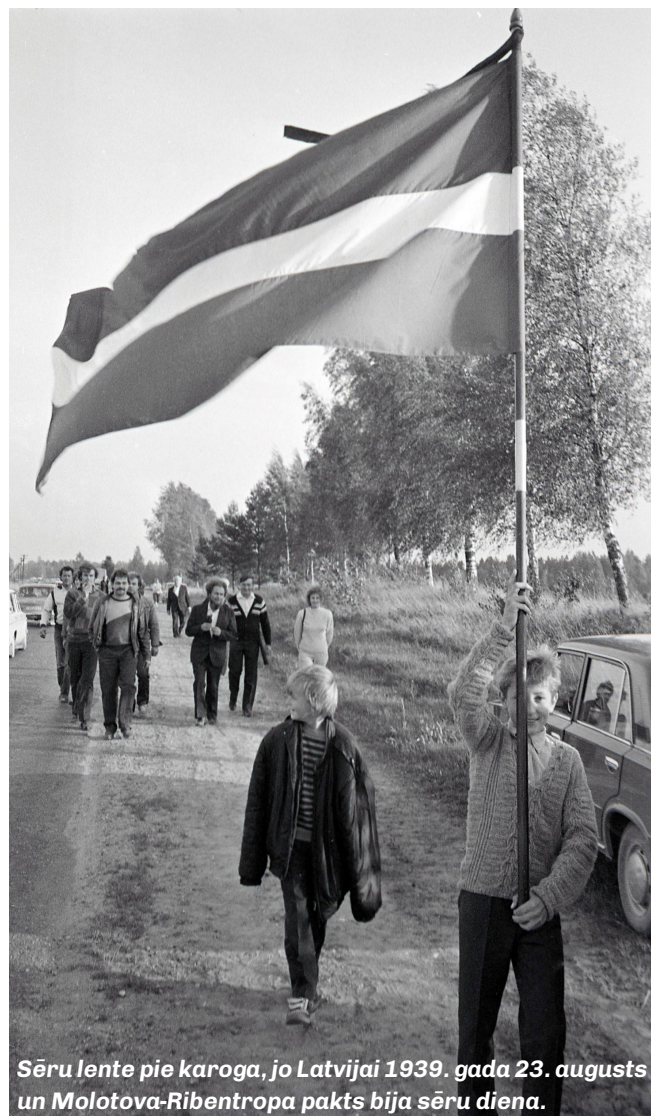
Sēru lente pie karoga, jo Latvijai 1939. gada 23. augusts un Molotova-Ribentropa pakts bija sēru diena.

Foto: Māris Zariņš, Tautas frontes grupas vadītājs Mazsalacas mežrūpniecības saimniecībā (MRS).