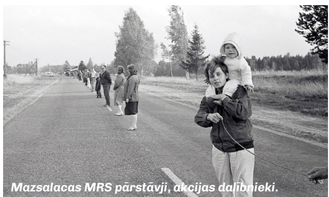
Mazsalacas MRS pārstāvji, akcijas dalībnieki.