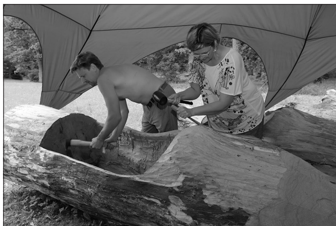
Darbs pie vienocū soliēm rit pilnā sparā