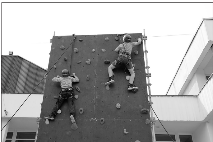
Drosmīgie iemēgina alpinisma sienu