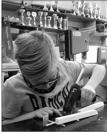
Top katram savs kuterītis Klaipēdas interešu izglītības centrā