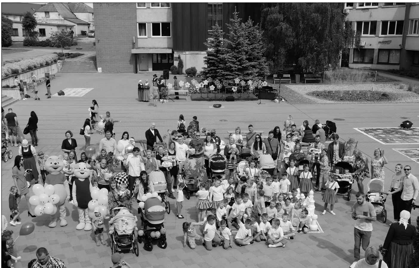
Jaundzimušie ar vecākiem un svētku dalībniekiem