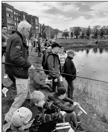
Pašu būvētie kuterīši tiek nolaisti ūdenī