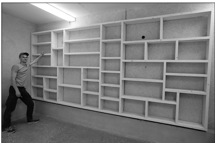
Tikko uzstādītais grāmatu maiņas plaukts kultūras centrā