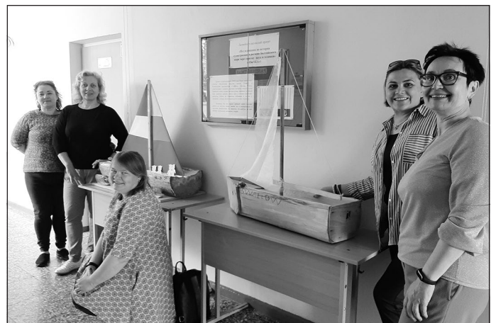
Abu skolu skolotājas pie partneru izveidotajiem kuģiem no raupjās koka sagataves