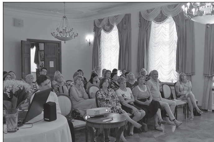
Pasākuma dalībnieki no visām mūsu skolām un viesi

COLENT (Kooperatīvās mācīšanās metodes un digitālās