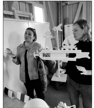
Pie jūras vēja virziena noteikšana ir svarīga – tādēļ mums arī 2 pašu krāsoti vējrāži