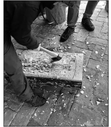
Abām grupām katram sava kuģa izveides sagatave (nedaudz izgriezts koka bluķēns)