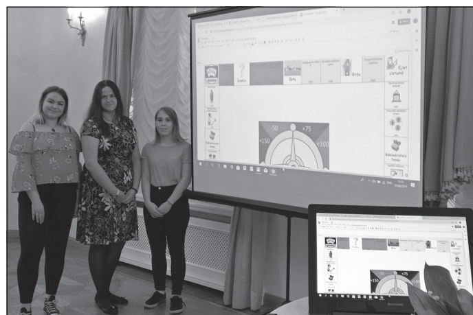
Profesiju MONOPOLA spēles veidotājas