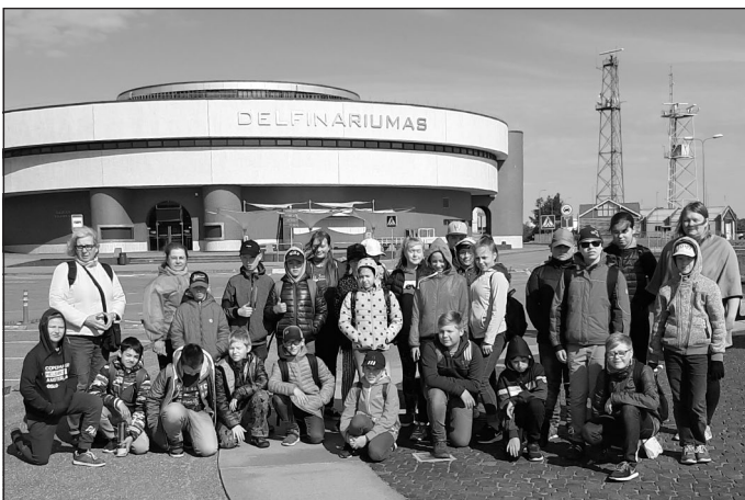
Mūsu grupa pie Delfinārija