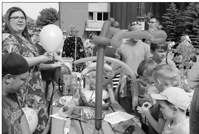
No baloniem top visdažādākās figūras