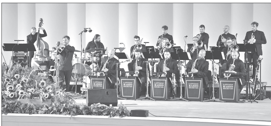
Uz jaunās estrādes skatuves kā pirmajiem bija gods uzstāties Latvijas radio bigbendam. Tik augstvērtīgu mūziku Rojā nedzirdam bieži, par ko liecināja arī skatītāju vētrainie aplausi.