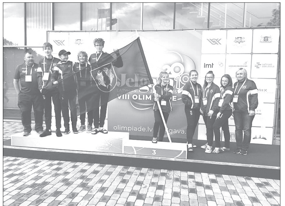
Basketbolisti pirms sacensību atklāšanas ceremonijas.