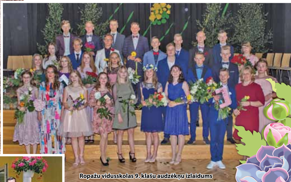
Ropažu vidusskolas 9. klašu audzēkņu izlaidums