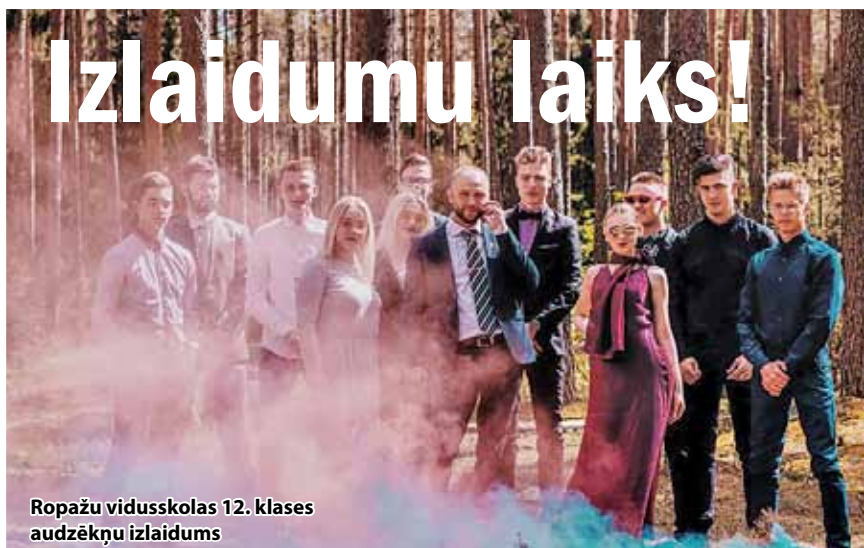
Ropažu vidusskolas 12. klases audzēkņu izlaidums