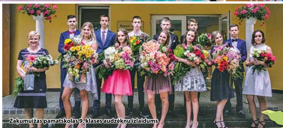
Zaķumuižas pamatskolas 9. klases audzēkņu izlaidums