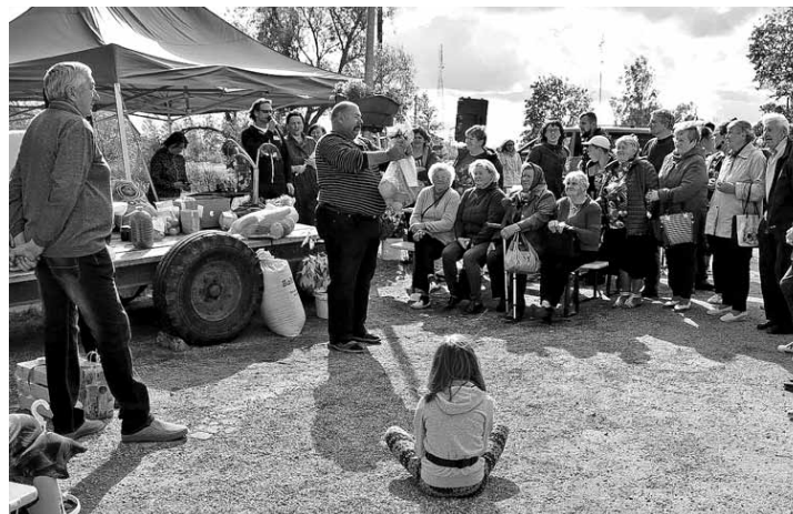
Pirmo reizi Kabiles rudens tirgū sarīkota izsole.

Kabiles rudens tirgū pirmoreiz sarīkota izsole – tajā varēja iegūt trusi, gaili, dārza veltes, gardumus, adījumus, pat malku un kūsmēslus. Par iegūto naudu pie saieta nama Sencis tiks izveidota rožu dobe.