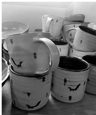
Keramikas darbnīcā Ciparnīca māla krūzītes ar izcirsto mežu un pa to skraidošo lapsu esot viens no tūristu iecienītākajiem pirkumiem.