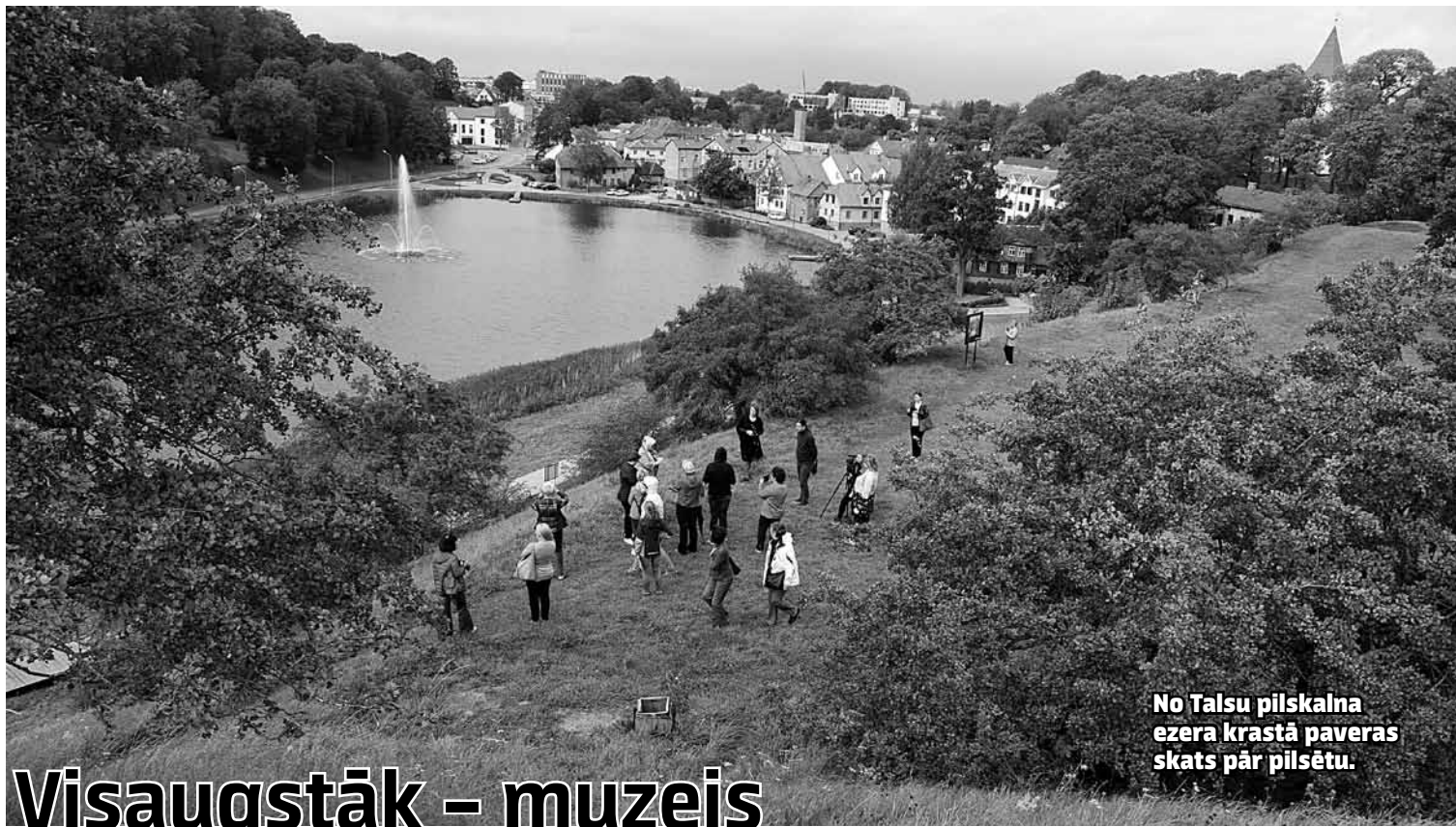
No Talsu pilskalna ezera krastā pavēras skats pār pilsētu.

Maršrutā Baltu ceļš Talsos iekļauti tādi objekti kā Talsu pilskalns, Vilkmuižas ezers un novada muzejs. Vēl tūrisma un informācijas centrs ceļotājiem iesaka apskatīt citus pakalnus, kas kopā esot pat vairāk nekā deviņi. Arī bez radošās darbnīcas Patrepe , keramiķu darbnīcas Ciparnīca un folkloras takas Jāņkalni apmeklējuma kaimiņpilsētas apskate nebūšot pilnīga.