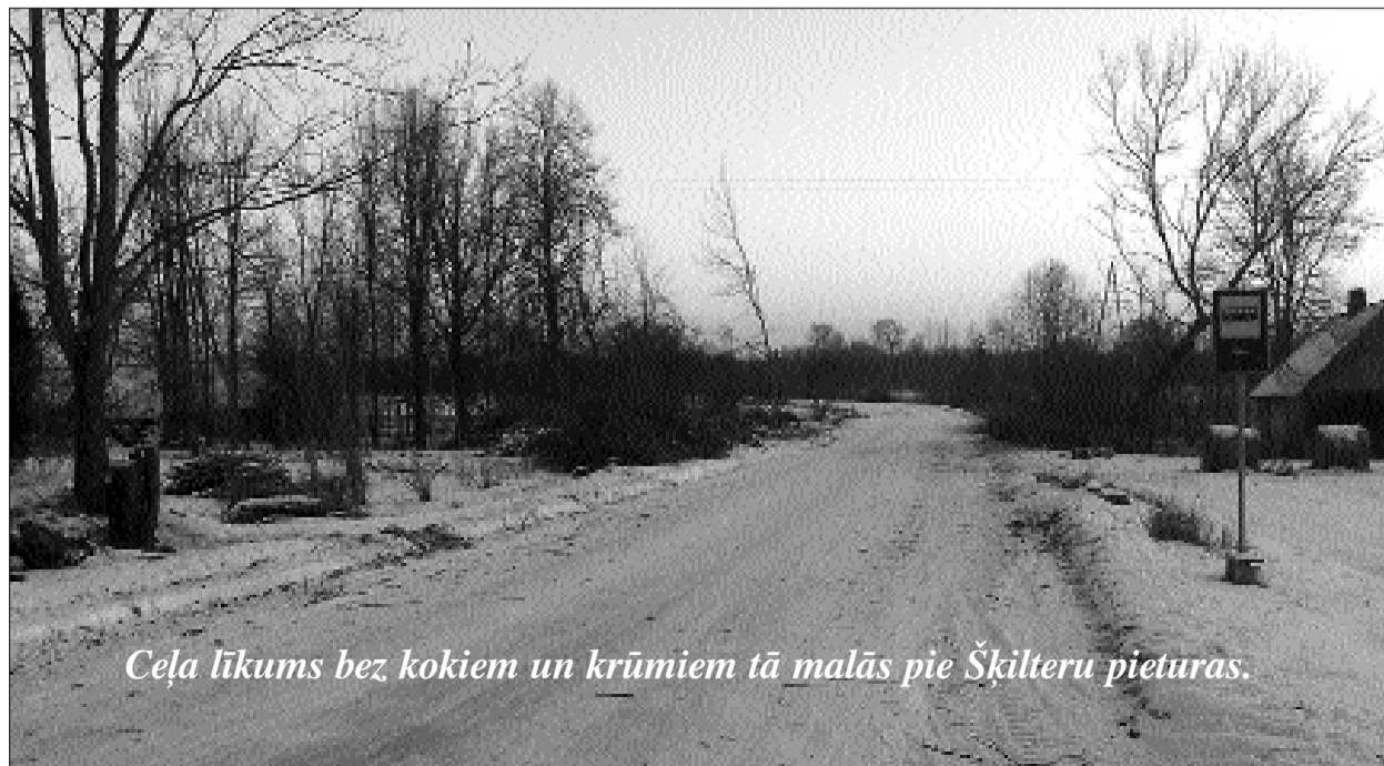
Ceļa līkums bez kokiem un krūmiem tā malās pie Šķilteru pieturas.