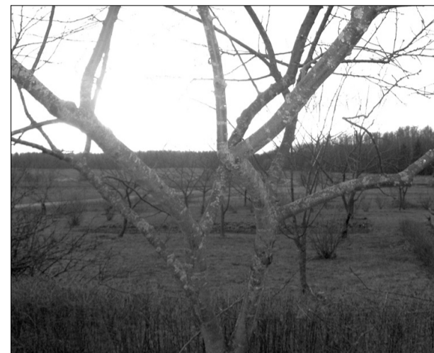
„Liepu” augļudārzs vakara saules spēlēs.

Saimnieki intensīvi atjauno ganības, audzē lielu augļu dārzu, kas tiek rūpīgi un cītīgi kopts, arī tagad, ar dēla palīdzību, kas no Rīgas brauc katru brīvu dienu un palīdz, kur vien var, jaunajām ābelītēm izgriezt zari. Saimniece no ražas vislabprātāk spiež sulu, un visi dzer to ziemā, lielo augļudārzu slavēdami.