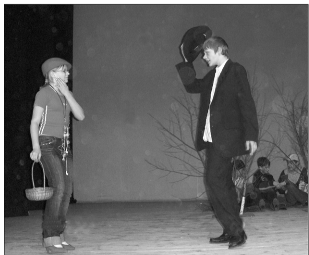
Vārkavas vidusskolas 7. klases teātra grupa rāda pasakas "Sarkangalvīte un vilks" lokalizējumu Preiļu rajona skolu teātra svētkos 27. martā.