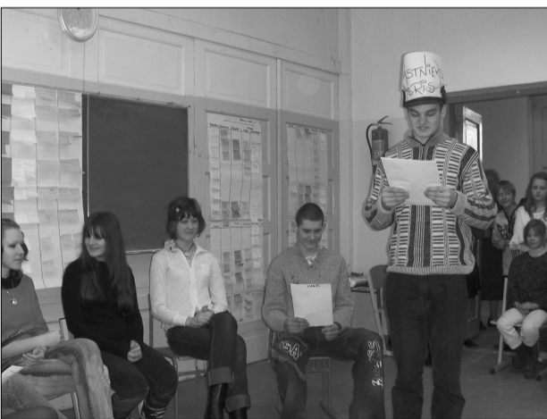
Skolēni uz sociālo karšu fona prezentē savu veikumu.

Problēmas bija laicīgi apzinātas, jāteic, ka idejas bija gan fantastiskas, piemēram, Disnejlendā izveide, gan visai reālas - bērnu diennakts aprūpes centrs, klubīņš jauniešiem un ģimenēm, sporta laukuma sakārtošana un vēl vesela virkne dažādu citu ieceru. Diemžēl stiprais sals mainīja mūsu nodomus, tādēļ projektu prezentāciju un diskusiju starp skolas, pašvaldības, iedzīvotāju pārstāvjiem un uzņēmējiem nācās pārcelt uz 7. martu. Tajā viesojās arī skolēni un skolotāja no Kalupes pamatskolas, kas arī ir iesaistīti šajā projektā, kā arī Lauku Partnerības „Sēlija” valdes priekšsēdētāja un skolu sadarbības tīkla izveides ko-