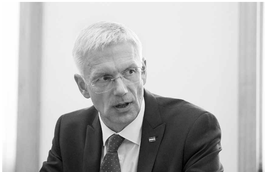
„Pašvaldību budžets un budžeta deficīts ir valsts kopējais deficīts,” žurnālistiem sacīja Ministru prezidents Krišjānis Kariņš.

rās tādu nav, bērns vidusskolas līmenī nogādātu līdz centram, kur ir spēcīgākā mācību iestāde, pārējo atstājot pamatskolai. Bet jānodrošina mobilitāte un skolēni jāved, nevis jāpasaka: „Tiec, kā gribi!” Jābūt skaidrībai, vai ir transports un kurš maksās, lai ir labs ceļš. Skaidri jādefinē, kas ir valsts (kopējā) un pašvaldības (vietējā) budžeta atbildība. Pašlaik skolotājiem algas maksā valsts, bet