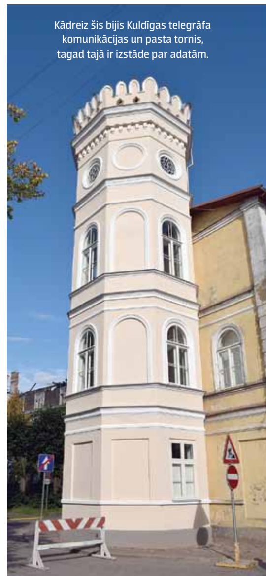
Kādreiz šis bijis Kuldīgas telegrāfa komunikācijas un pasta tornis, tagad tajā ir izstāde par adatām.