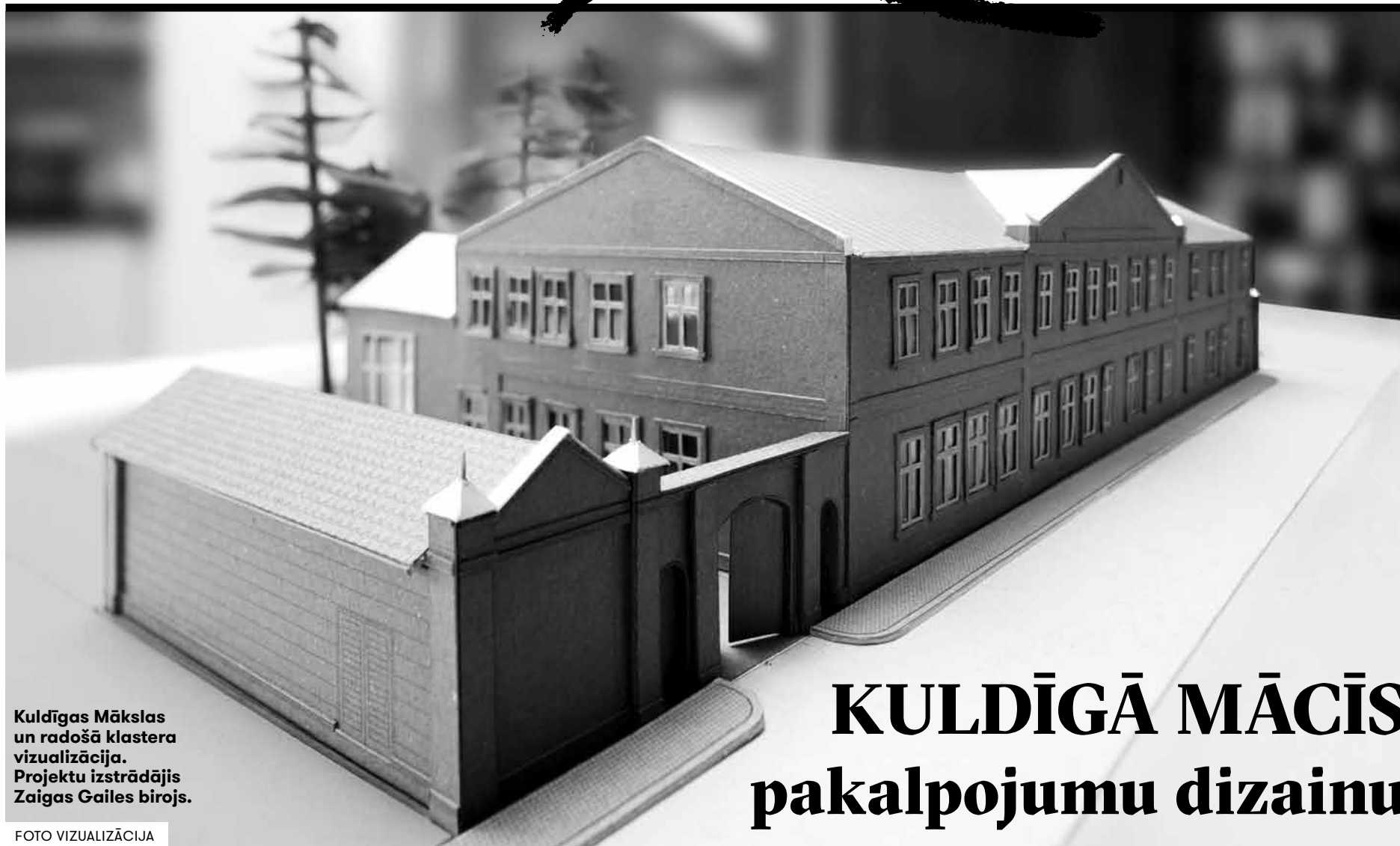
Kuldīgas Mākslas un radošā klastera vizualizācija. Projektu izstrādājis Zaigas Gailis birojs.