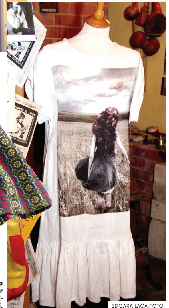
Zīmola "Rakstu raksti" cenu zīmes ir ar pašas mākslinieces sacerētām tekstiem.