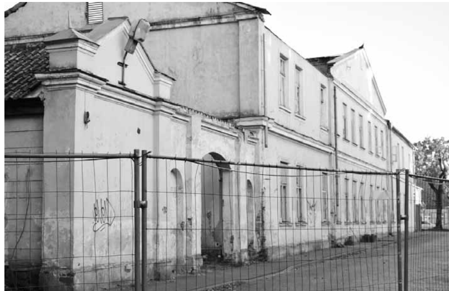
Vecajā ēkā, kur atradīsies Latvijas Mākslas akadēmijas filiāle, vēstures gaitā bijusi gan adatu fabrika, gan Kuldīgas slimnīcas ķirurģijas nodaļa.

Projekta vadītāja skaidro, ka Ķelnes Tehniskā universitāte programmā vairāk izstrādājusi dizaina un tehnoloģiju studiju sadaļu: "No Ķelnes projektā piedalās arī Informācijas tehnoloģiju fakultāte, kas izveidojusi programmu par tehnoloģiju lomu sabiedrības funkcionēšanā, pakalpojumu vidē utt. Ķelne bija pirmā augstskola, kurā pagājušā gadsimta 90. gados tika attīstīta pakalpojumu dizaina pieeja, viņiem uzkrāta liela pieredze. Rīgas Ekonomikas augstskolas sadaļa ir saistīta ar biznesu, organizāciju izveidi, funkcionēšanu, daudzveidību tieši pakalpojumu sektorā. Tas skar ne tikai biznesu, bet arī valstisko pārvaldi, publisko un nevalstisko sektoru. Latvijas Mākslas akadēmija sadarbībā ar