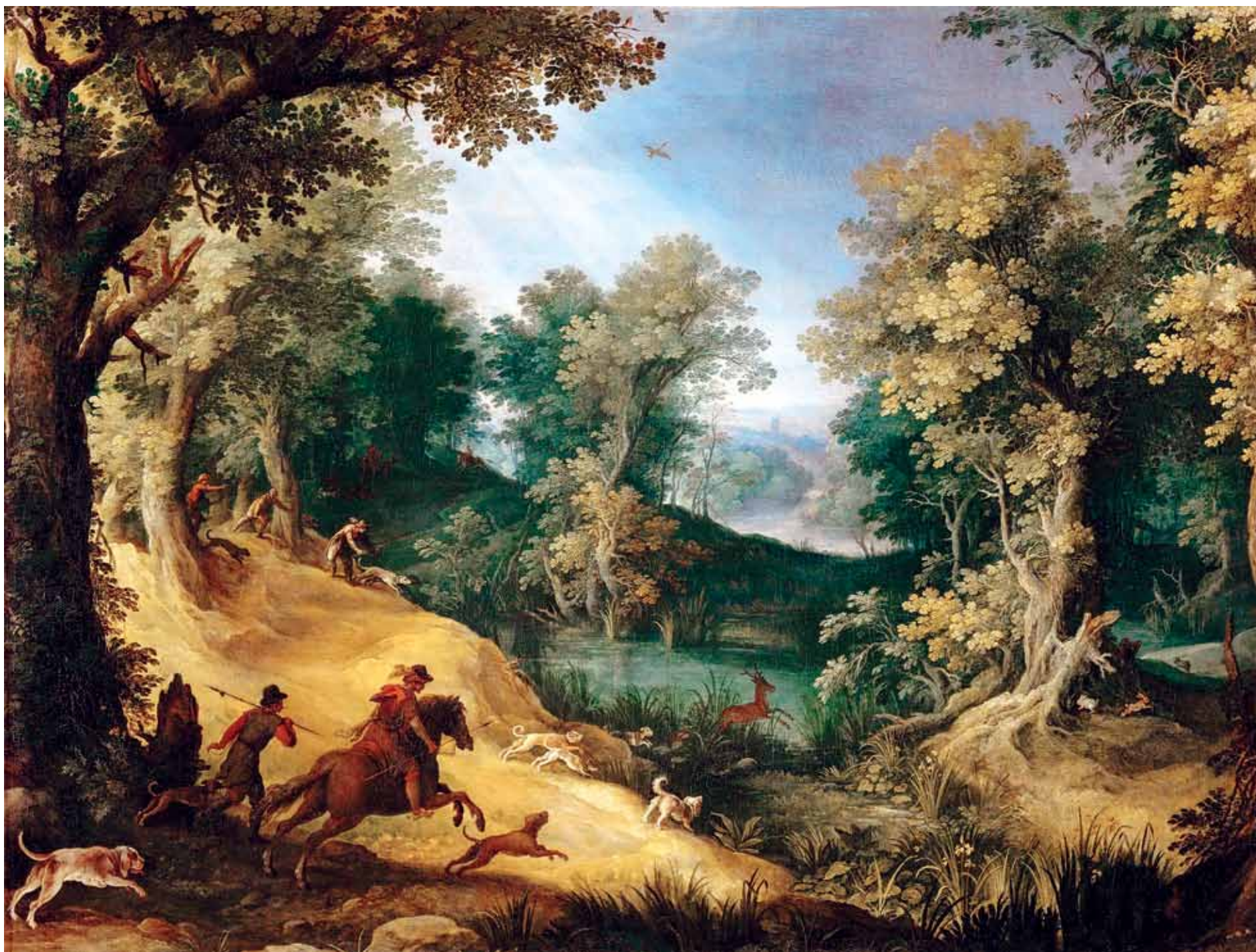
17. gadsimta flāmu gleznotāja Paula Brila gleznas Briežu medības (1590. g.) reprodukcija. Oriģināls atrodas Luvrā.