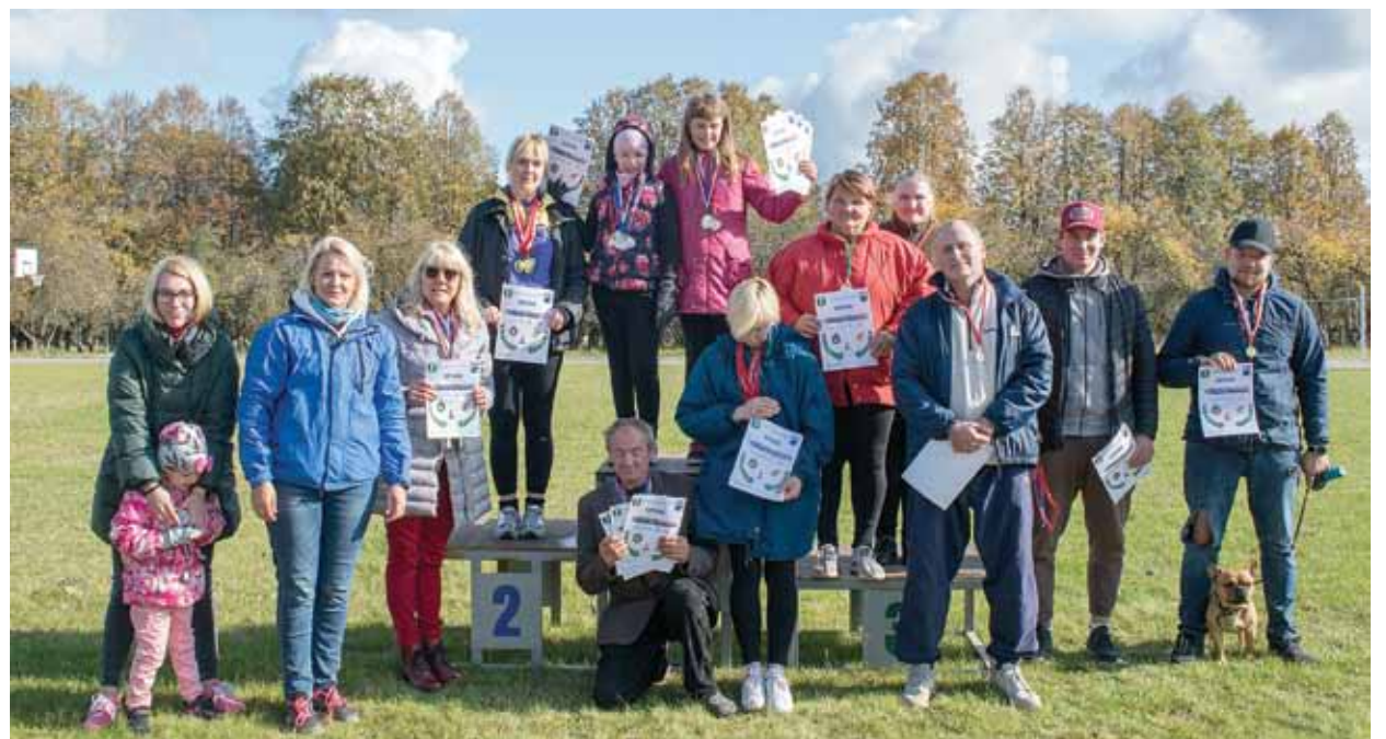
Aktīvajiem nīkrācniekiem prieks par veselīgi pavadīto rudens dienu.