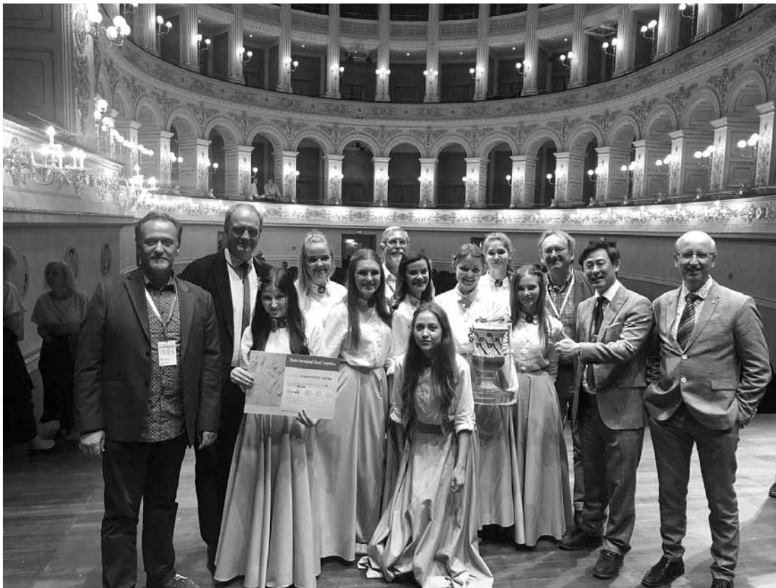
Kuldīgas kultūras centra ansamblis Karameles pēc apbalvošanas konkursā Itālijā kopā ar žūriju.