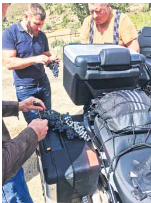
Spānijas vīnogas milzīgajos ķekaros esot īsta delikatese – saldās un sulīgās.