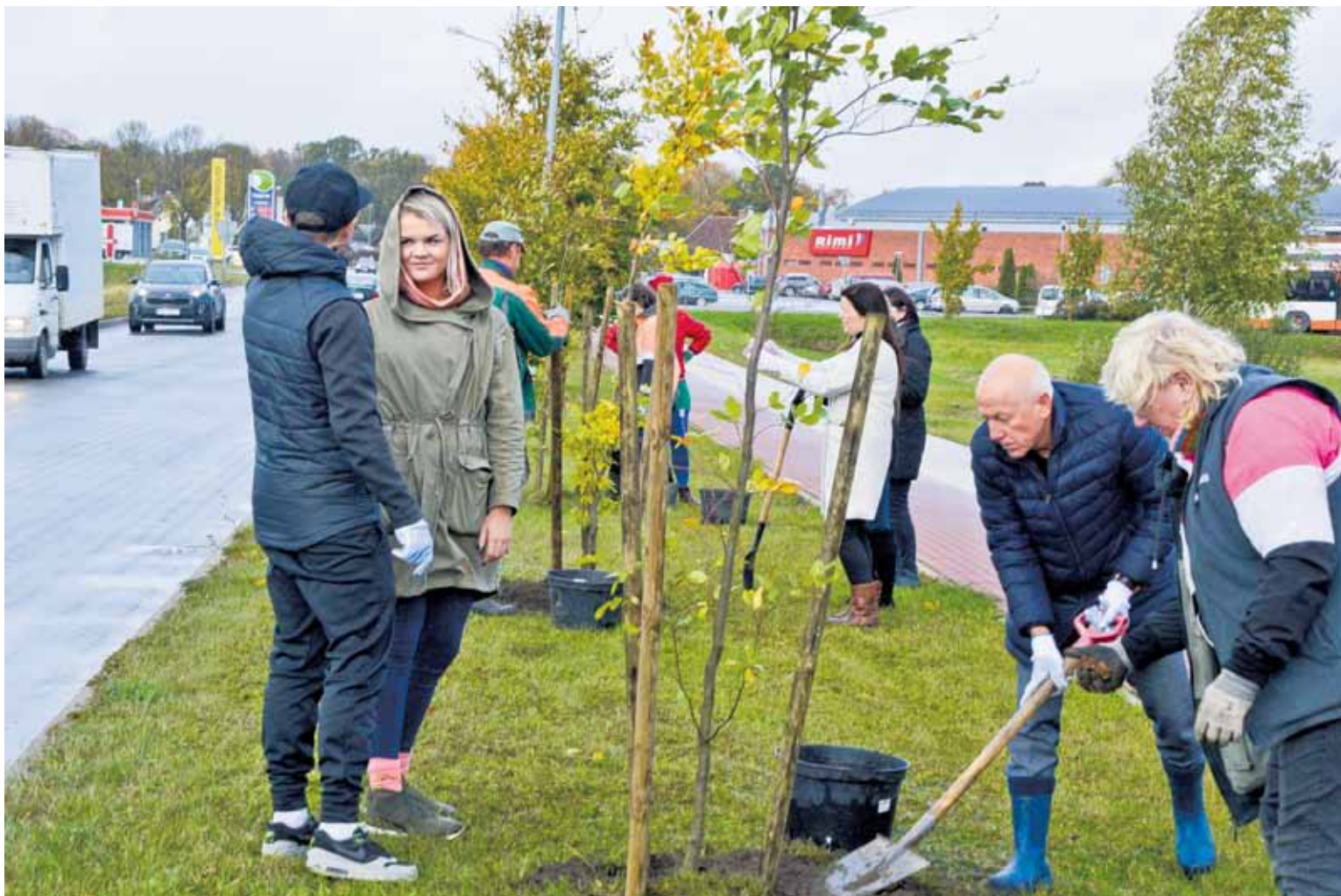
Kuldīgas komunālo pakalpojumu un novada pašvaldības pārstāvji, kā arī skolēni un daži jaunie skolotāji, kas piedalījās dižskābaržu stādīšanā Sūru ielā, izteica cerību, ka jaunie kociņi labi iesaugs un cilvēka roka tos nepostīs.

Piektdien Kuldīgā, Sūru ielā, tika iestādīti desmit dižskābarži, tādējādi atjaunojot un papildinot iepriekšējos stādījumus.