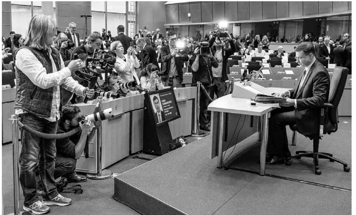
Eiropas Komisijas priekšsēdētājas izpildvietnieka amata kandidāta Valda Dombrovska iztaujāšana Eiropas Parlamentā Briselē 8. oktobrī bija raisījusi lielu žurnālistu interesi.

miku runājot, bet par cilvēkiem maz dzirdams. Vai sociālās garantijas būs visiem EK priekšlikumiem vai būs veto tiem, kam negatīva sociālā ietekme? „Nāksim ar likumdošanas iniciatīvu par ietvaru minimālām algām, par jauniešu garantijām, par bezdarba pārāpdrošināšanas programmu. Visiem likumdošanas priekšlikumiem tiek vērtēta sociālā ietekme.”