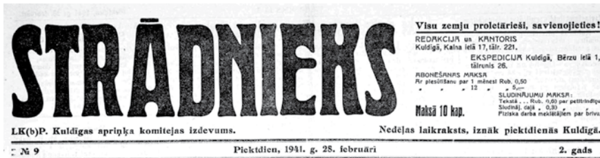
Strādnieka galviņa un dzejolis Saulainā brīve 1941. gada 28. februārī.

No 1940. gada 9. jūlija līdz 1941. gada vasarai vienīgais preses izdevums Kuldīgas rajonā ir Strādnieks . Tajā ziņas par darbaļaužu sasniegumiem darba frontē.