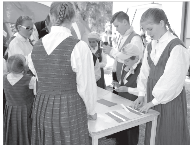
Radošajā darbnīcā tiek darināti mazi karodziņi.