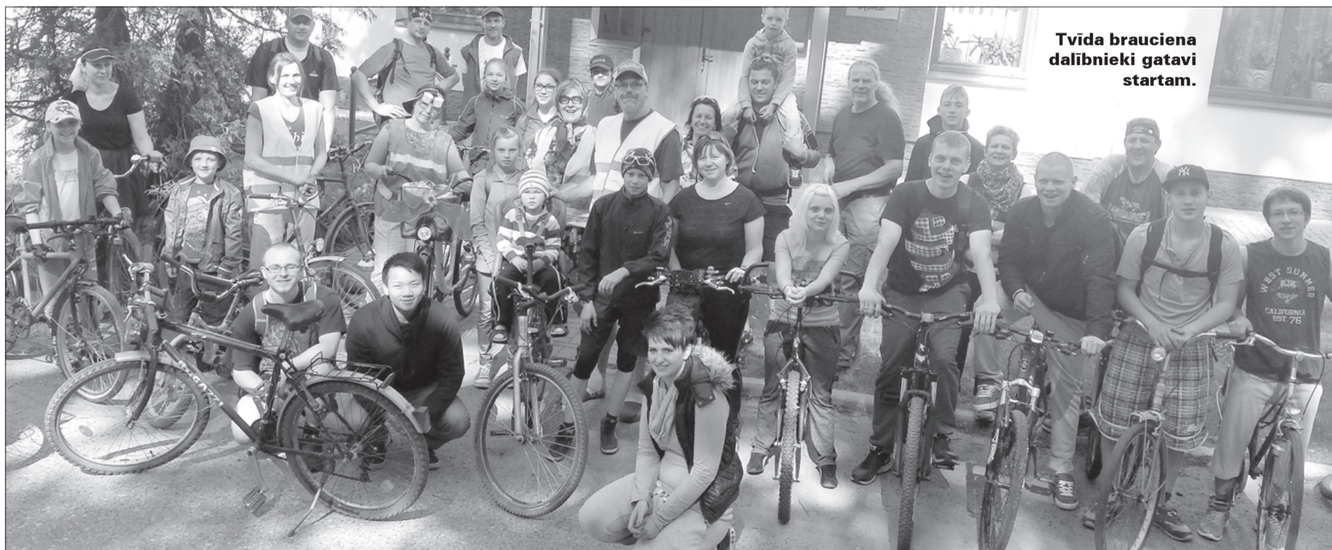
Tvīda brauciena dalībnieki gatavi startam.