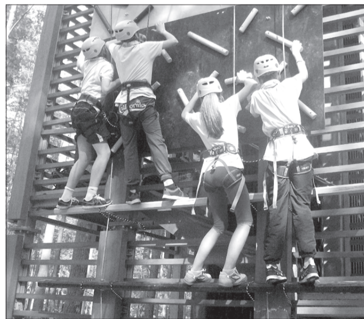
Veikli rāpjosies klints sienā.

Popes pamatskolas 5. klases skolēni un audzinātāja