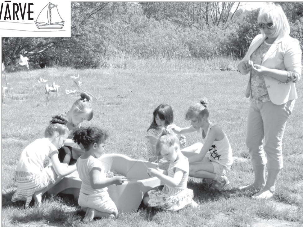
Rotaļas un dabas prieki.