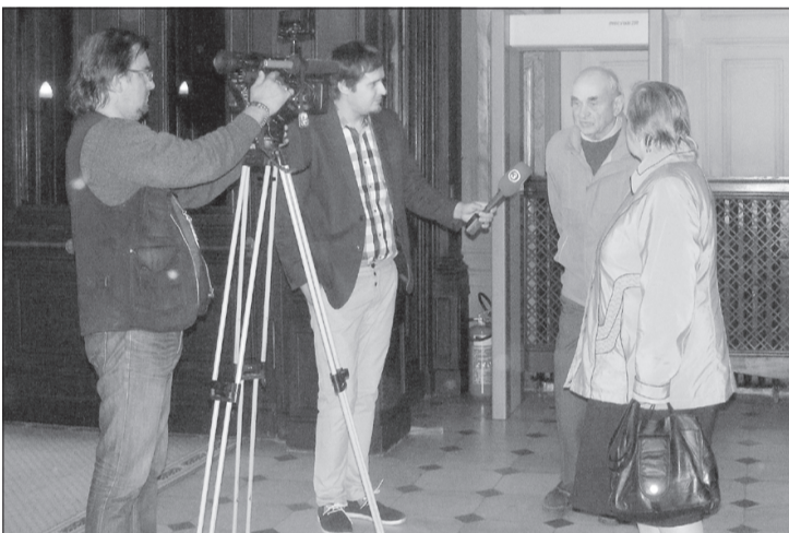
Usmeniekus intervē televīzijas žurnālisti.

Ja cilvēks sasniedzis pensijas vecumu, tas nebūt vēl nenozīmē, ka nu tik jādzīvojas pa māju vien. Tāpēc – laižam uz Rīgu ekskursijā! Pagājušajā gadā bijām Latvijas Universitātes Botāniskajā dārzā un Rīgas lidostā. Šā gada apskatāmie objekti ļoti nopietni un svarīgi.