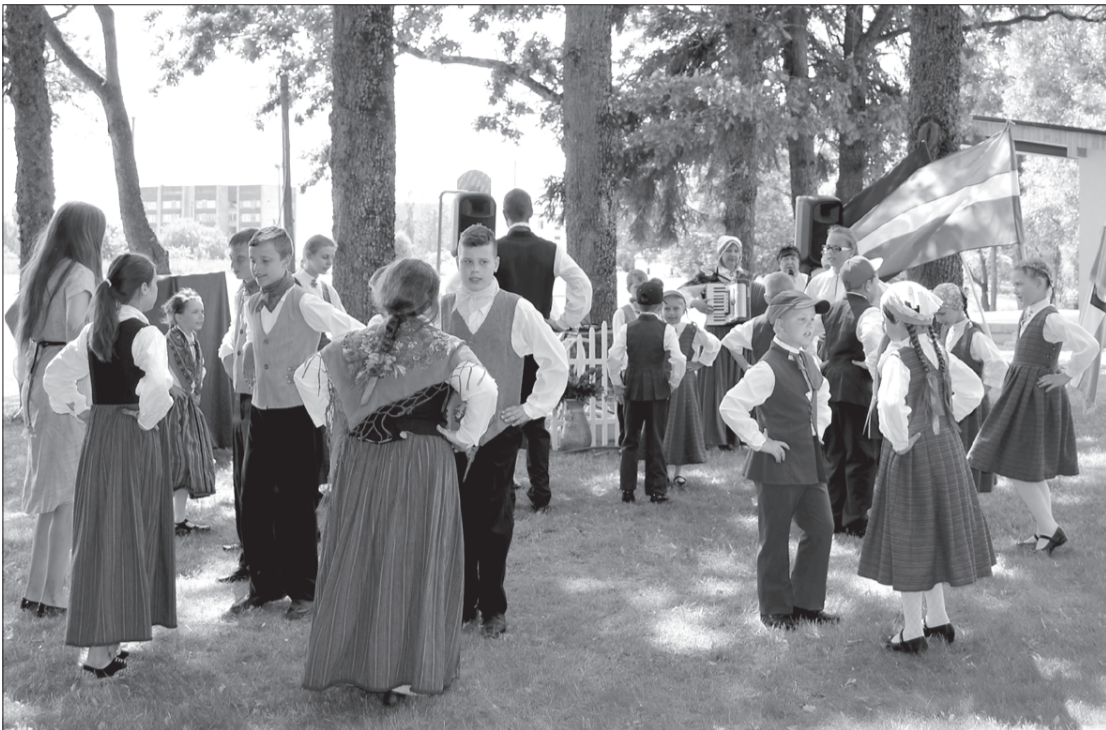
Dejas un rotaļa – tradicionālās kultūras mantojuma daļa.