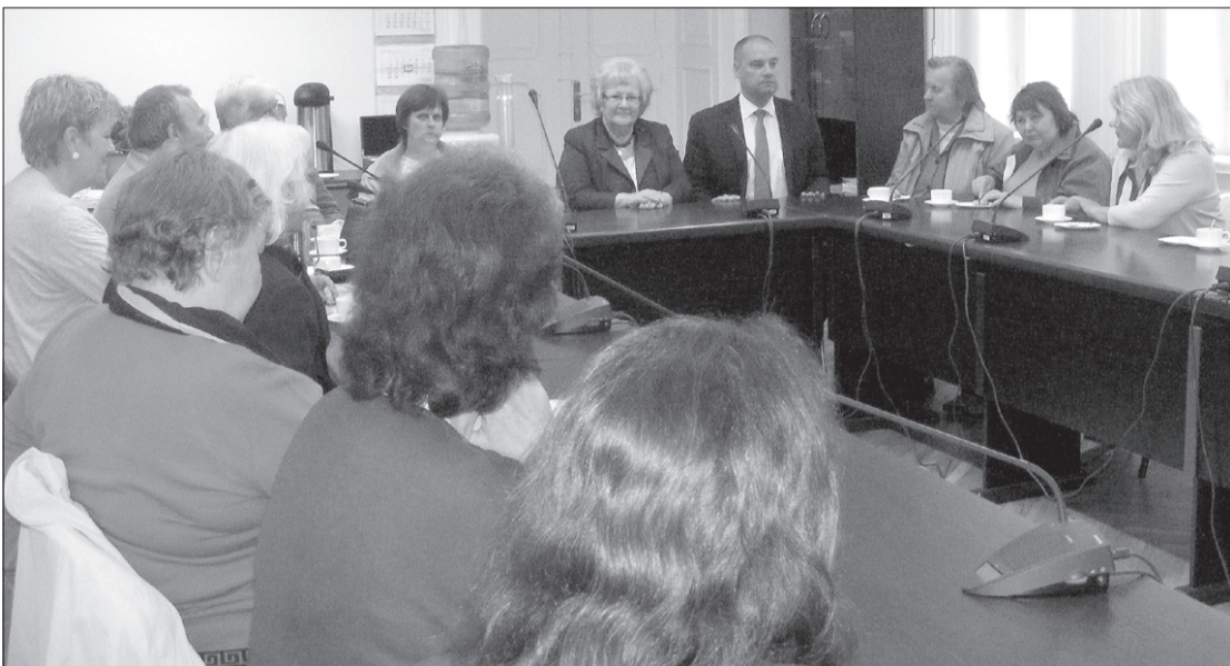
Vērtīga tikšanās ar politiķiem.