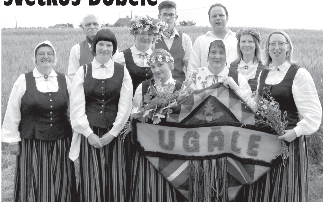
Kora dalībnieku grupa ceļā uz Dobeli, kur dziedāja kopkorī.

Ir dzirdēts un lasīts, ka Ugāles pagasta amatierkolektīvi piedalās dažādos pasākumos un festivālos – pūtēju orķestris "Ugāle" brauc uz festivālu Čehijā, folkloras kopa "Urdava" piedalās folkloras festivālā "Baltica" ieskaņas koncertā Dundagā, deju kolektīvs "Spiekstiņi" – vidējās paaudzes deju kolektīvu svētkos Jelgavā. Bet kur gan palicis Ugāles jauktais koris "Eglaine"? Nekur jau neesam pazuduši. Arī mēs bijām lielā un nozīmīgā pasākumā – Kurzemes dziedātāju svētkos Dobelē.