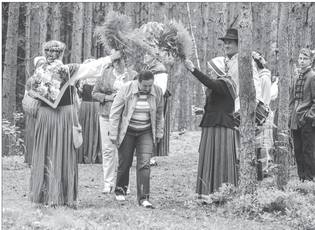
Čikstelē varēja izbaudīt Jāņu līgotnes, rotaļas un dejas.

Mūsu senči acimredzot bijuši labi pazīstami ar augu enerģētisko