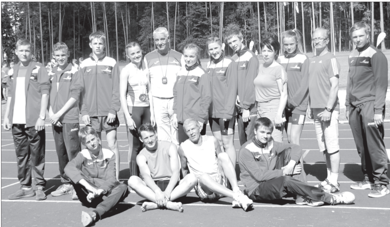
Mūsu novada komanda – sportisti kopā ar treneriem.