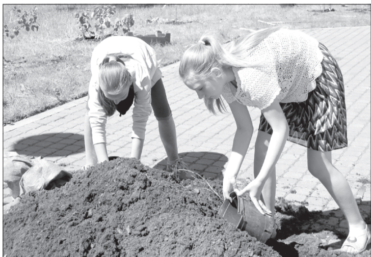
Košumkrūmus stādīja arī Popes pamatskolas audzēknes.

Popē jūlijs sākās ar ceriņu stādīšanas talku. Daži talcīnieki bija tik čakli, ka sāka darbu ātrāk, nekā tas bija iecerēts, tādēļ jau pēc pārdesmit minūtēm krāšņumaugi bija iestādīti un vēl pēc brīža – aplaistīti.