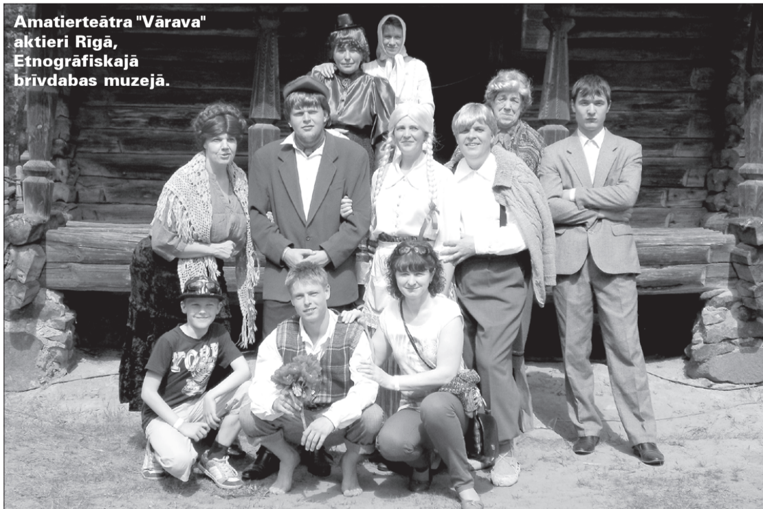
Amatierteātra "Vārava" aktieri Rīgā, Etnogrāfiskajā brīvdabas muzejā.