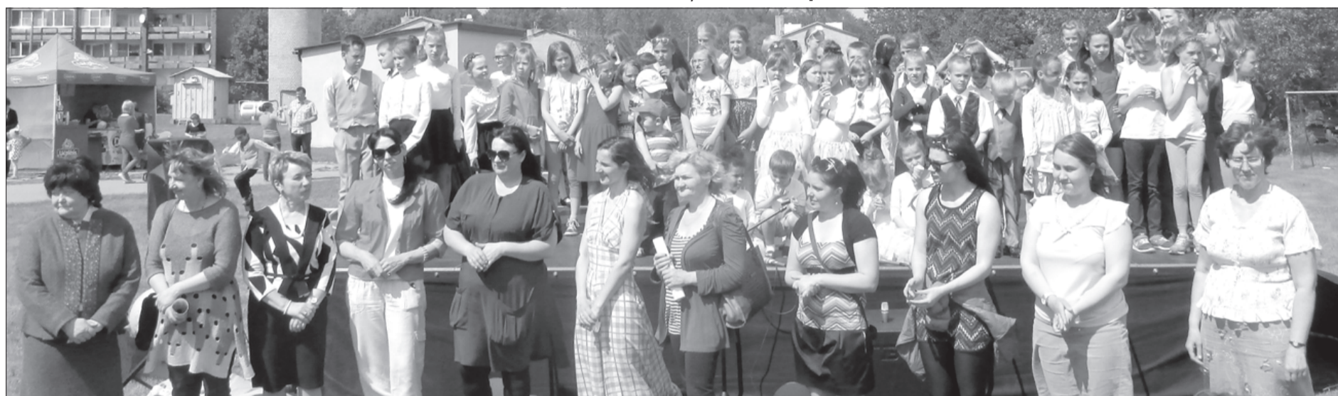
Priekšplānā skolotājas, kuras ikdienā rūpējas par bērnu attīstību.