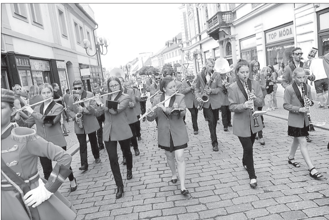
...tauru skaņās kad vilņojas Čehijas gaiss.