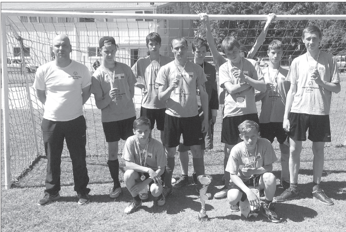
Kurzemes komanda ieguvusi pirmo vietu.