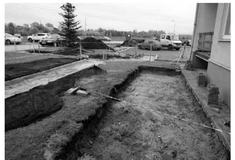
Tiek realizēts labiekārtošanas projekts, kuru iesniedza nami Nometņu ielā 38, Griezes ielā 19 un Griezes ielā 17. Pavisam drīz šeit būs jaunas autostāvvietas, ietves, ielu apgaismojums un apstādījumi.

Apzinoties šo situāciju, pašvaldība jau vairāku gadu garumā piedāvā ieguldīt līdzekļus daudzdzīvokļu māju pagalmu labiekārtošanas projektos. Iedzīvotājiem ir savā starpā jāvienojas, ko tieši savā piemājas teritorijā vēlas uzlabot, un jāiesniedz projekts pašvaldībā. Saprotot, ka pieteikumu sagatavošana iedzīvotājiem var būt sarežģīta, ir iespēja konsultēties pie