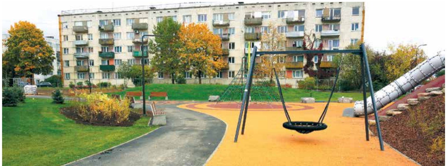
Jaunais atpūtas laukums lieliski papildina skaisto rudens ainavu Saulkalnē.