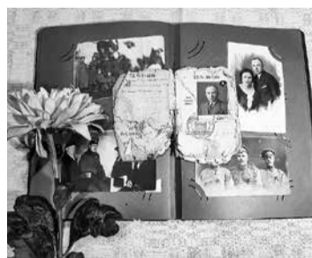
"Pieminot vecvectēvu" – Jēkaba darbs, kuru žūrija atzina par vienu no labākajiem.

Saeima, savukārt rīkoja Saeimas Aizsardzības, iekšlietu un korupcijas novēršanas komisija sadarbībā ar Nacionālajiem bruņotajiem spēkiem (NBS) un Jaunsardzes centru. Uzvarētāju darbus iekļaus izstādē, kuru svinīgi atklās Saeimas namā šī gada 7. novembrī. Konkurss uzvarētāji tiks aicināti uz izstādes atklāšanu, varēs apmeklēt NBS Jūras spēku Patruļkuģu eskadru, doties ekskursijā pa Saeimas namu, kā arī viesoties Saeimas Aizsardzības, iekšlie-