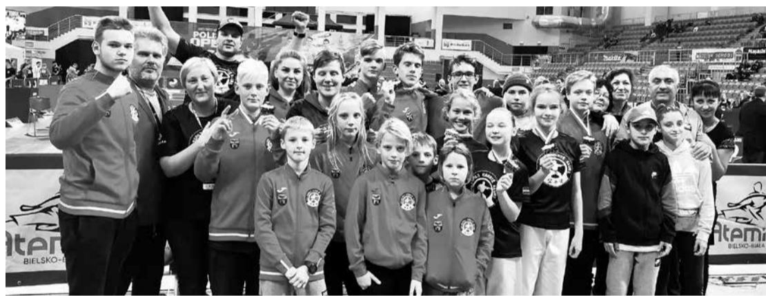
Ar uzvarām no Polijas atgriezās mūsu karatisti.

sībās palīdzētu mūsu sportistiem tālākajā izaugsmē," saka treneris. "Vēlamies izteikt pateicību Salaspils novada pašvaldībai par finansējumu un iespēju mūsu komandai kuplā sastāvā startēt Eiropas līmeņa sacensībās un nest mūsu pilsētas vārdu."