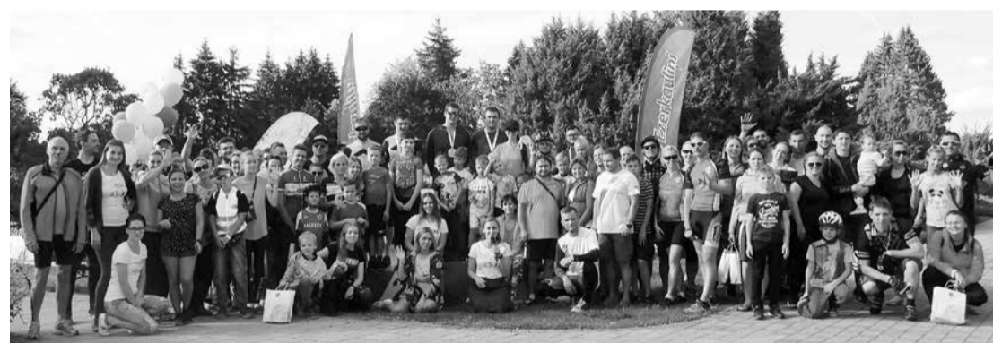
Šogad velo- foto orientēšanās sacensības pie mums pulcēja rekordlielu dalībnieku skaitu.

3. TIC piedāvā iespēju iegādāties dažādus suvenīrus ar Salaspils simboliku, kas ir lieliska dāvana ne tikai mūsu novada viesiem, bet arī vietējiem iedzīvotājiem. Salaspils saules simbols ir raisījis interesi, tāpēc esošais suvenīru klāsts – magnēti, vasaras cepures, t-krekli – ir papildināts,