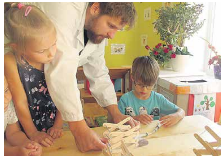
Bērni kopā ar zinātniekiem būvē hidraulisko pacelāju.

sarūpēja medu, kā arī centīgi mācījās dzejoļus un dziesmas. Bērnu piedalīšanās pasākumā bija saviļņojošs, emocionāli patīkams piedzīvojums!