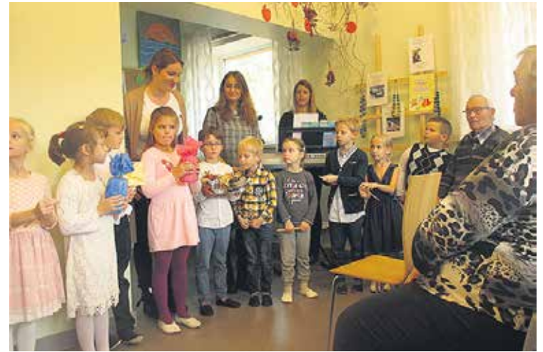
Bērni sveic Babītes novada seniorus Starptautiskajā senioru dienā.

Oktobri ieskandinājām ar sirsnīgu pasākumu Starptautiskajā senioru dienā. Bērni cītīgi gatavojās Babītes novada senioru sveikšanai Daudzfunkcionālā sociālo pakalpojumu centra filiālē „Babītē” – kopīgi cepa gardus cepumus,