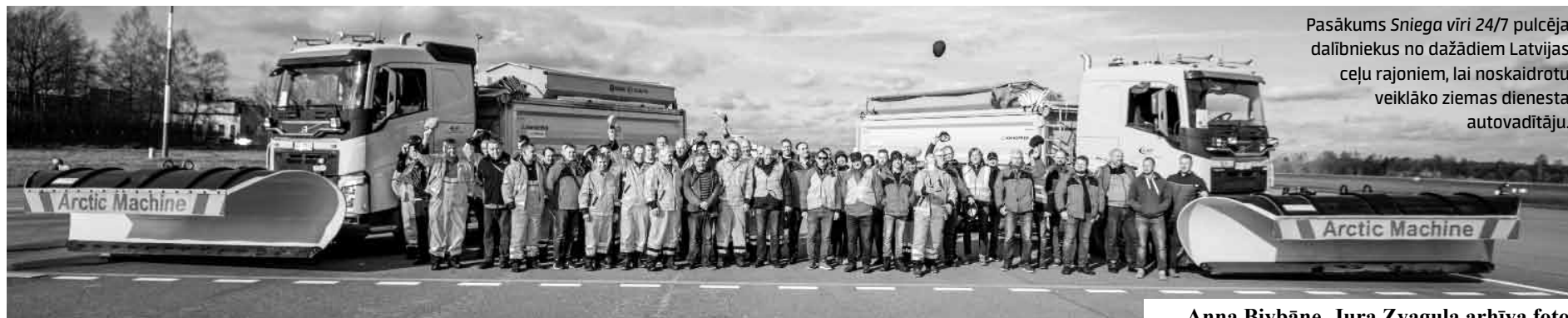
Pasākums Sniega vīri 24/7 pulcēja dalībniekus no dažādiem Latvijas ceļu rajoniem, lai noskaidrotu veiklāko ziemas dienesta autovadītāju.

Skrundenieks atzina, ka sacensībām īpaši nebija gatavojies, bet, rezultātus sasummējot, trasē parādījās labāko laiku. J.Zvagulis: „Piedalīšanās deva iespēju satikt kolēģus no visas Latvijas, kā arī atsvaidzināt zināšanas, kas tuvākajās dienās būs jāliet. Liels prieks, ka izdevās uzvarēt un iegūt iespēju Latviju pārstāvēt Eiropas mēroga sacensībās.”