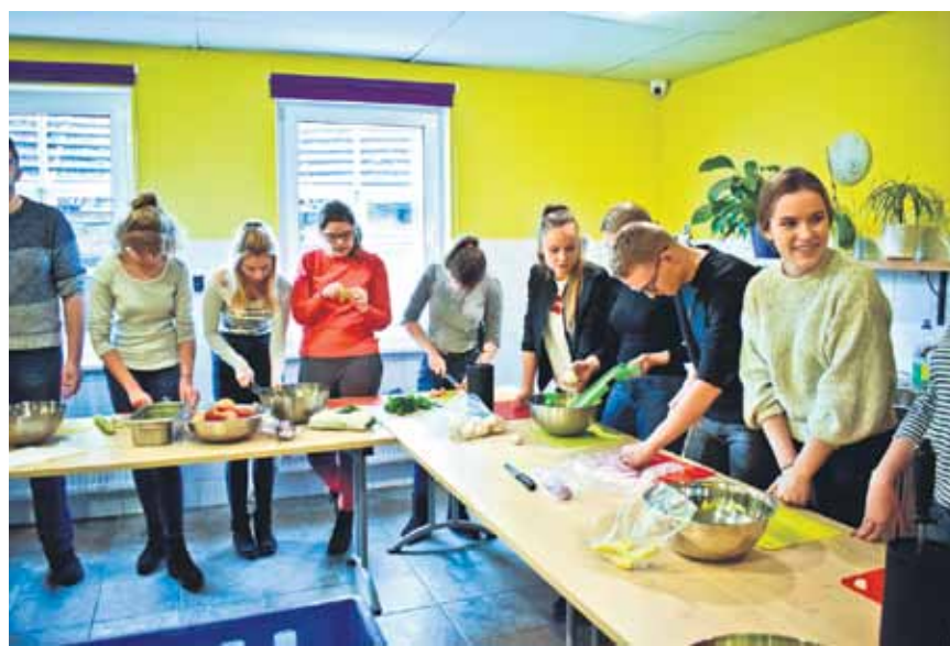
Katram jauniešim savs uzdevums.

Te tika gatavoti pieci ēdieni: ķirbju biezzupa ar kazas sieru un sēklām, svaigie salāti ar ātri apceptām liellopu gaļas strēmeliņiem, kartupeļu biezenis ar sēnēm, panēta menca un pērļu