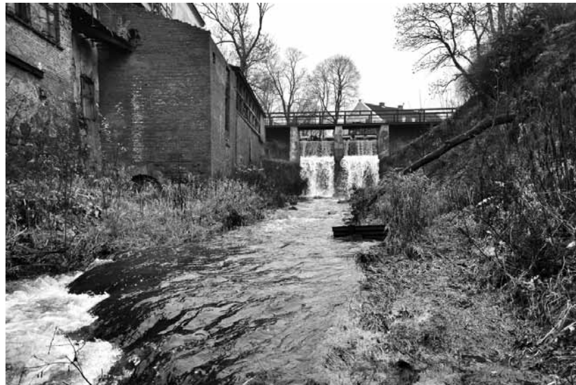
Alekšupītes posms Kuldīgā, kurā uzdarbojas maluzvejnieki.

Valsts vides dienesta konfiscētie rīki – cemmeri , ar kuriem maluzvejnieki zivis iegūst nežēlīgi, tās aizķerot un izraujot no ūdens.