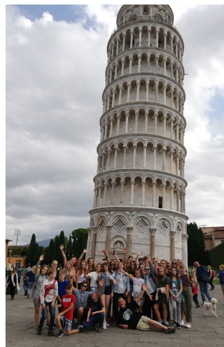
Ceļotāji priecīgi atpūtā pie Pizas torņa

Nākošajā dienā – pēc brokastīm, kuras katru dienu mums laipni pasniedza bārā kāds no kora dziedātājiem, diemžēl, bija jākāpj autobusā, lai dotos garajā mājupceļā.