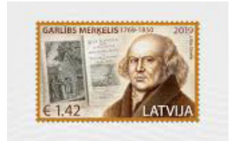
AS “Latvijas Pasts” izdotā pastmarka Garlība Merķeļa piemiņai