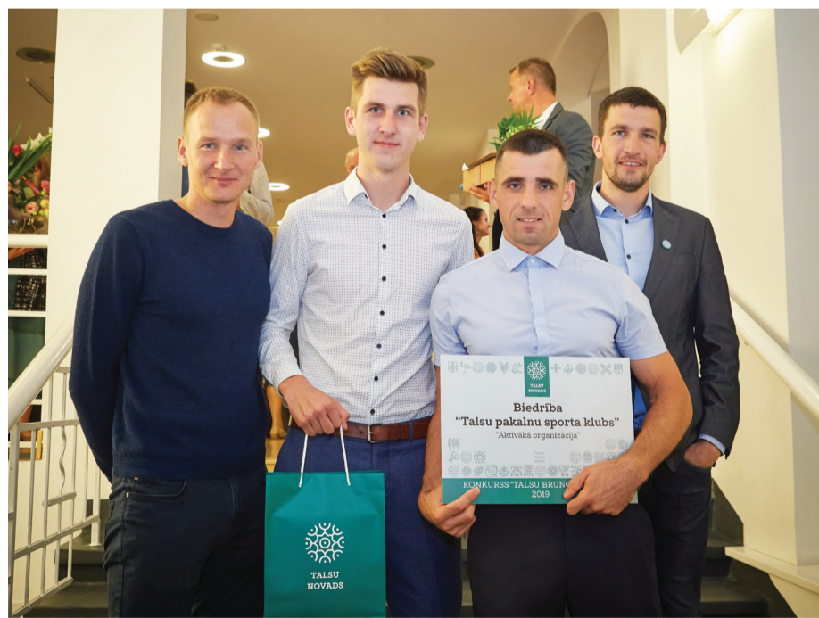
„Aktīvākās organizācijas” titulam bija izvirzītas septiņas organizācijas. Uzvaru ieguva Talsu pakalnu sporta klubs.