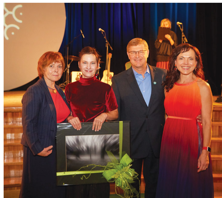
Reģionālais laikraksts „Talsu Vēstis” savu balvu piešķīra domubiedru grupai „Kaimiņu būšana” Ģibuļu pagastā.