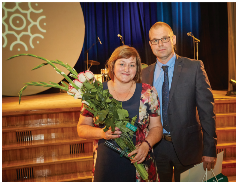
Par „Draudzīgāko zemnieku saimniecību” atzīta ZS „Jaunstrauti”, kur ar graudkopību nodarbojas Jēču ģimene no Balgales pagasta.