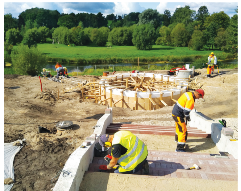
Būvdarbi Sabiles pilsētas laukumā.

Šobrīd Sabilē sezonāli ir ievērojama tūrisma plūsma, ņemot vērā kultūrvēsturiskā mantojuma pievilcību