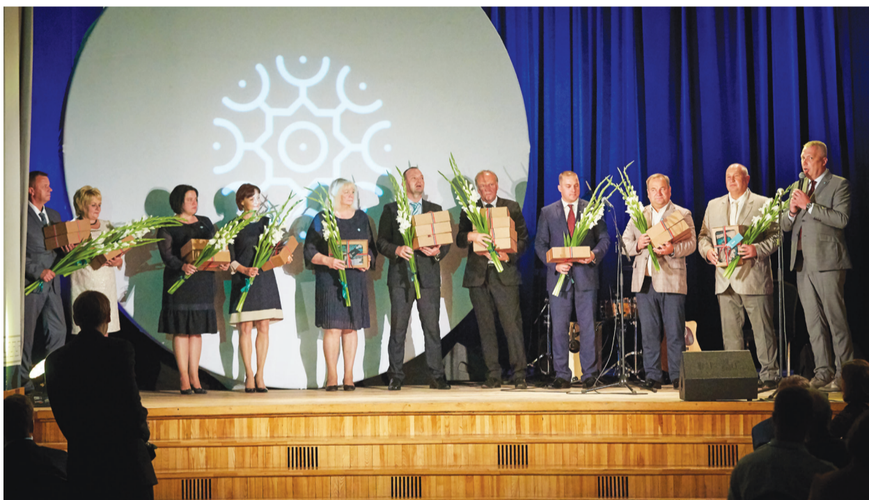
Pasākumā Talsu novada pilsētu un pagastu pārvaldes vadītājiem tika pasniegti karogi ar jaunizveidotajiem ģerboņiem.