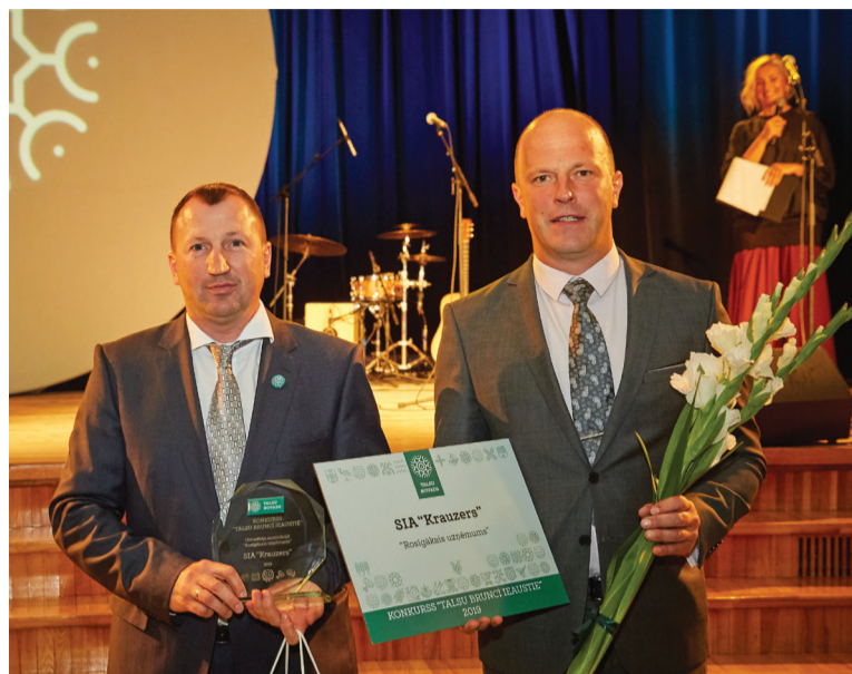
Titulu „Rosīgākais uzņēmums” šajā gadā nopelnījis SIA „Krauzers” – ilgtspējīgs un korporatīvi sociāli atbildīgs uzņēmums.