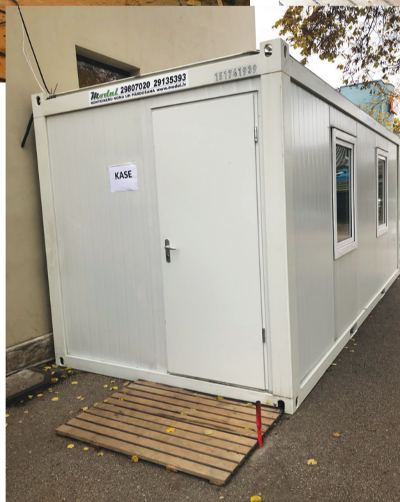
Pašreiz biļetes var iegādāties pie ēkas novietotajā konteinerā.

Iesākumā bija plānots veikt vienkāršotu kosmētisko remontu, bet, sākot darbus, kļuva skaidrs, ka tā gan nebūs. „Ēka ir pietiekami sena, nepieciešama apkures sistēmas maiņa, jo līdz šim tajā bija krāšņu apkure. Vēlamies pieslēgties pilsētas centralizētajai siltumapgādes sistēmai. Par labāko risinājumu atzinām apsildāmo grīdu ierīkošanu, jo gada vēsākajos mēnešos saskaramies ar mitruma radītajām sekām. Arī apgaismojums ir novecojis un neatbilst ugunsdrošības prasībām, tāpat jāierīko atbilstoša ventilācijas sistēma, kas veidos lielākās būvdarbu izmaksas, bet bez tās paveiktie darbi nebūtu ilgtspējīgi. Demontējot krāsnis, skatam pavērs skaista ķieģeļu sienu. To esam paredzējuši saglabāt, līdz ar to izmaksas būs lielākas, nekā plānojām,” teica uzņēmuma valdes priekšsēdētāja. Iesākumā, plānojot kosmētisko remontu, darbus bija paredzēts pabeigt divu mēnešu laikā, tagad, pieaugot darbu