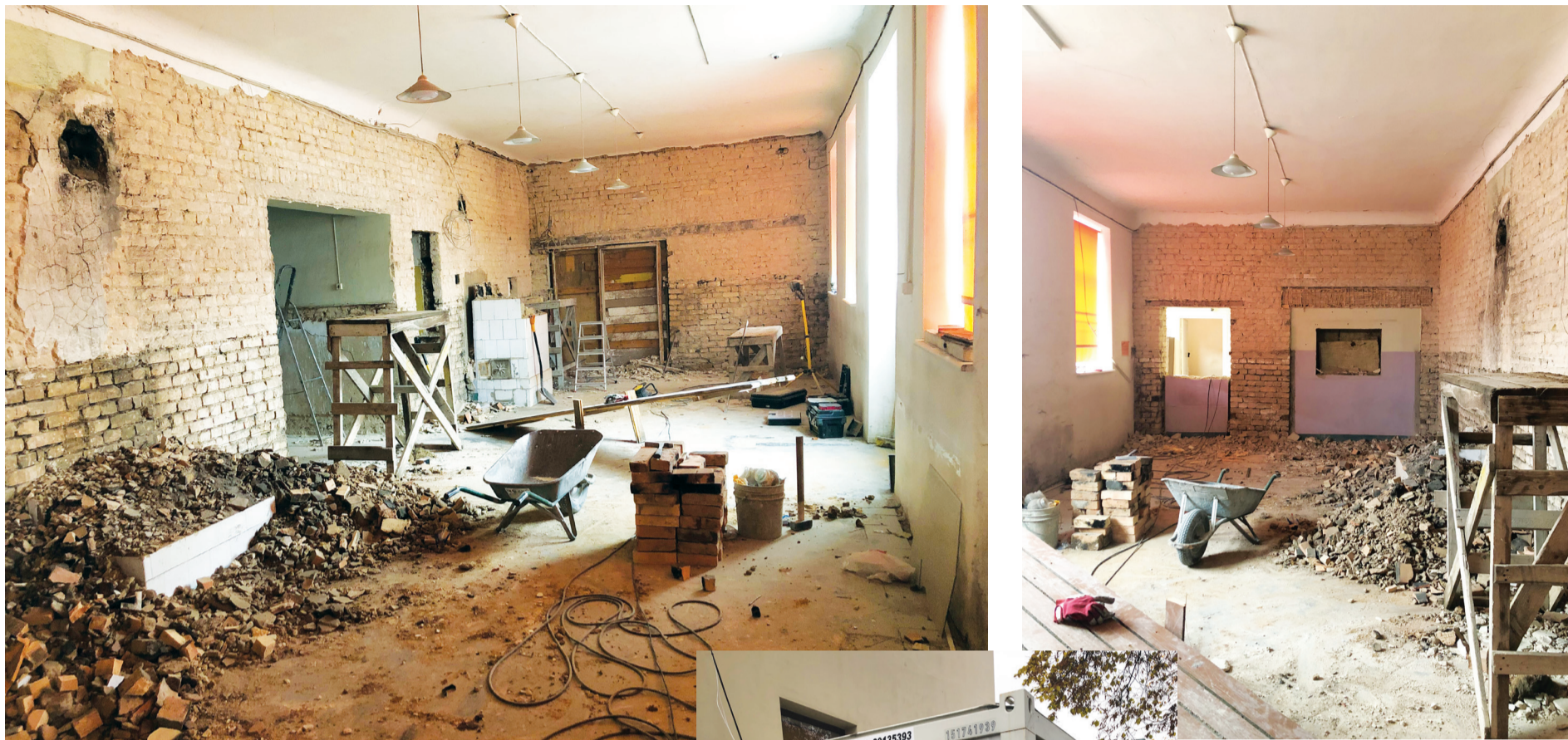
Tā šobrīd izskatās Talsu autoostas iekštelpas.

A/s „Talsu autotransports” ir liels spēlētājs Talsu novada uzņēmējdarbības vidē. Tā pamata nozare ir sabiedriskā transporta pakalpojumu sniegšana, un viena no šā darba sastāvdaļām ir arī autoostas uzturēšana Talsos. Jau 2014. gadā a/s „Talsu autotransports” uzlaboja autoostas ēkas ārpusi, atjaunojot fasādi, bruģējot teritoriju, izvietojot nojumes un elektroniskus tablo, bet nu ievērojamas pārmaiņas piedzīvos arī ēkas 1. stāva iekštelpas.