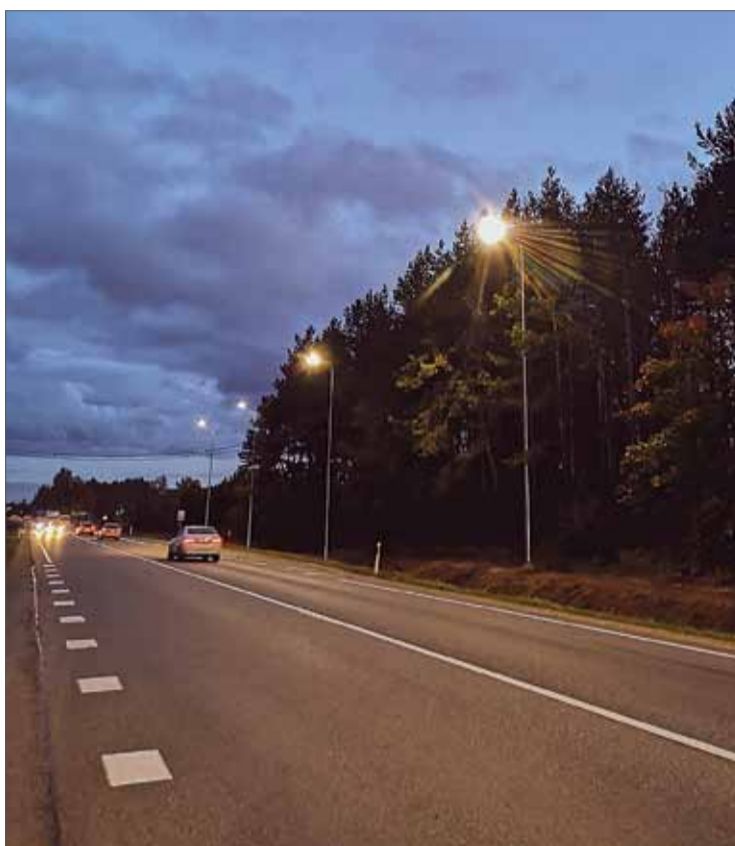
Uzstādītais jaunais LED apgaismojums.