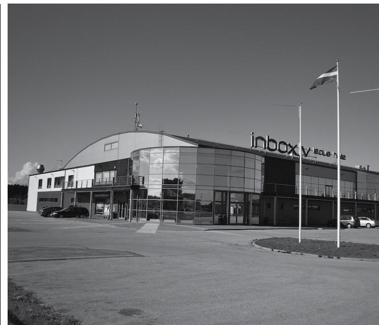
„Inbox.lv” ledus halle.

Babītes novada pašvaldības izglītības darba speciāliste