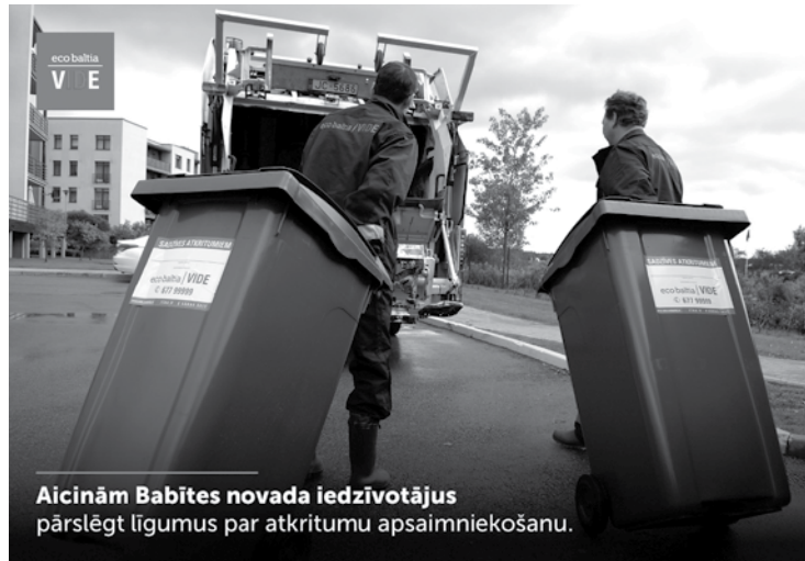
Aicinām Babītes novada iedzīvotājus pārslēgt līgumus par atkritumu apsaimniekošanu.

Saskaņā ar iepirkuma procedūras rezultātiem un SIA „Eco Baltia vide” un Babītes novada domes noslēgto līgumu nešķirotu sadzīves atkritumu izvešanas maksa no šā gada 1. decembra būs 13,69 EUR (bez PVN) jeb 16,56 EUR (ar PVN) par vienu kubikmetru. 2014. gadā pašvaldības un SIA „Eco Baltia vide” noslēgtajā līgumā maksa par sadzī-