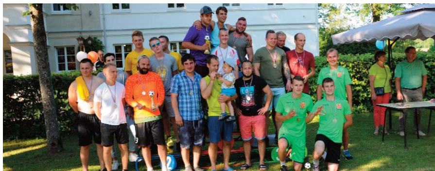
20.jūlijā Ērberģes muižā kuplā skaitā pulcējās sportotgribētāji ne tikai no Neretas novada, bet arī kaimiņu novadiem. Attēlā: minifutbola spēles uzvarētāji (1.vietā – Ērberģes komanda, 2. vietā – Neretas komanda un 3.vietā – viesītieši)