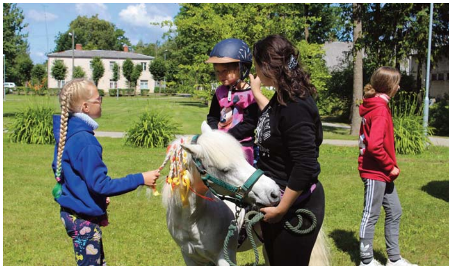
Neretas novada 10 gadu jubilejas rīts sākās ar dažādām atrakcijām bērniem, piemēram, viena no izklaides iespējām bija doties nelielā izjādē ar poniju