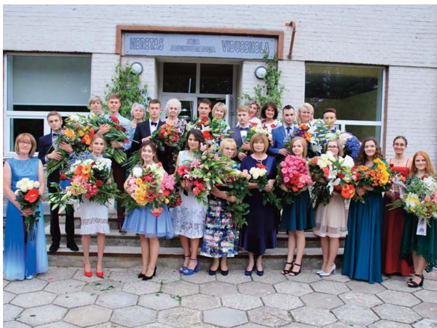
Neretas Jāņa Jaunsudrabiņa vidusskolas 12. klases izlaidums