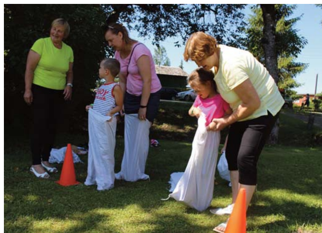
Bērniem tika piedāvāta ļoti plaša atrakciju programma, ko bija sarūpējušas biedrības “Ērberģietes” pārstāves