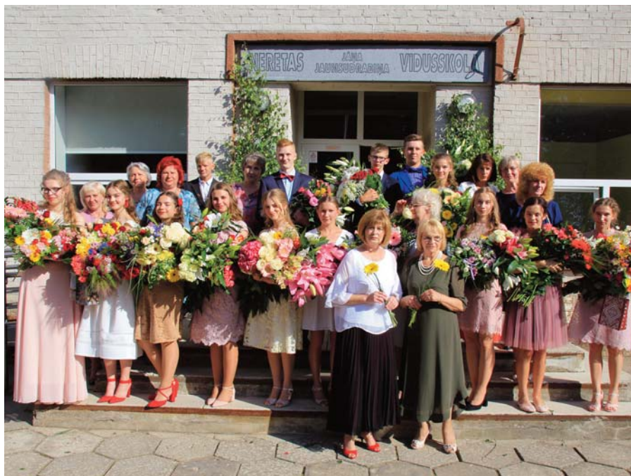
Neretas Jāņa Jaunsudrabiņa vidusskolas 9. klases izlaidums

Jūnijā iestājas astronomiskā vasara, ap Jāņiem augi uzņēmuši sevī visu vērtīgāko, lai palīdzētu tiem, kam tas ir vajadzīgs. Tā notiek dabā. Bet skolā saņemtās gudrības tiek vērtētas eksāmenos: 9. klases skolēni kārto četrus, 12. klases – obligātos eksāmenus latviešu valodā un matemātikā maijā. 2018./ 2019. mācību gadā eksāmenus gan devītie, gan divpadsmitie nokārtojuši ļoti labi, kas liecina par labu sadarbību starp Neretas Jāņa Jaunsudrabiņa vidusskolas skolēniem un skolotājiem.