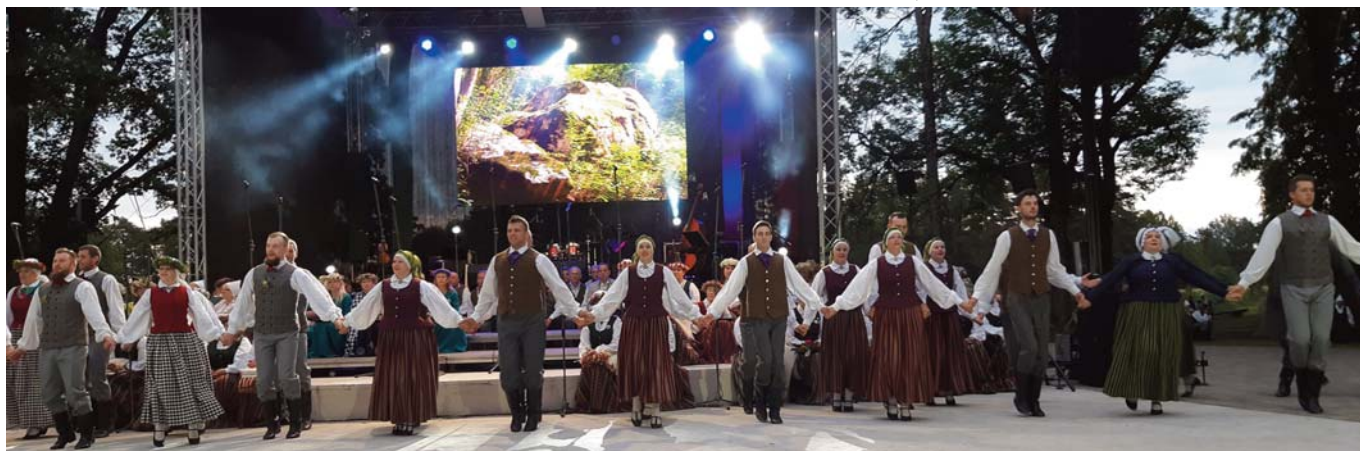
“Sēlija rotā” piedalījās arī Neretas vidējās paaudzes deju kolektīvs “Sēļi” (vadītāja I.Kalniņa)

Tradicionāli sēļi no Sēlijas novadu apvienības novadiem – Neretas, Jaunjelgavas, Aknīstes, Salas, Ilūkstes, Jēkabpils un Viesītes, pieaicinot krustpīliešus, ik gadu pulcējas kādā no novadiem uz saviem tautas mākslas svētkiem “Sēlija rotā”.