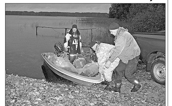
Novada kārtībnieki, kas ir atbildīgi arī par zivju resursu uzraudzību novada ezeros, piedalās zandartu mazuļu ielaistā.

Ezeri ir ļoti svarīgi vides tūrisma attīstībai Riebiņu novadā. Zivju resursu pavairošana ir būtisks