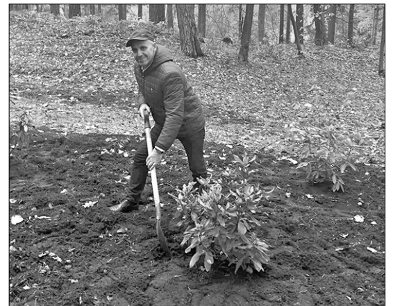
Riebiņu novada domes priekšsēdētājs Pēteris Rožinskis kopā ar citiem pašvaldību vadītājiem iestādīja rodo- dendru, veidojot Mežaparka Lielās estrādes teritorijā rododendru dārzu.

Pašvaldības katra savu rododendru stādīja atbil- stoši novada vai pilsētas atrašanās vietai kultūrvēs-