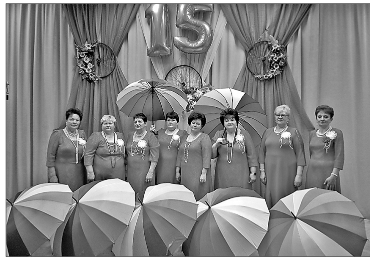
Gaviļnieces – vienmēr krāsainās un atraktīvās vokālā ansambļa «Zapevočki» dalībnieces.

Ansambļa dalībniecēm ir daudz jauku atmiņu par koncertēšanu dažādās vietās: Starptautiskajā festivālā Daugavpilī, kur tika piedāvāta aizraujoša iespēja dziedāt arī muzikālajā tramvajā; Starptautiskajā festivālā Indrā ļoti labi skanēja, jo uzstājāmies uz skatuves pašā upes malā; Grāveros estrādes atklāšana notika spēcīga lietus laikā, kas mūs neaizkavēja, jo bijām samirkušas, bet priecīgas; neaizmirstams gleznainais skats no Mākoņkalna uz Rāznas ezeru, kur uzbraucām augšā un dziedājām; aizkustināja cilvēku viesmīlība Audriņos, Strūžānos, Maltā, Silmalā, Pušā, Viļānos, Preiļos, Līvānos, Riebiņos, Galēnos, Silajānos, Krāslavā, Rušonā un Rožupes estrādē. Kaut arī ārā bija auksti, silti jutāmies Meteņdienas rotaļās Sokolku pagastā, Viļānu stadionā, Ārdavā,