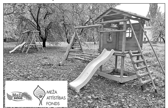
Ierīkojot laukumu bērniem Riebiņu muižas parkā, tika sakārtota un papildināta Riebiņu muižas parka vide, kas piesaistīs arvien vairāk apmeklētāju un popularizēs Riebiņu novadu.

Teritorija, kas izvēlēta projekta mērķim, atrodas Riebiņu ciemata Riebiņu parka teritorijā, kuru bieži pastaigām izvēlas ģimenes ar bērniem. Parka teri- torija ir skaista, tā tiek kopta katru gadu. Lai parka teritorija kļūtu vēl daudz pievilcīgāka, bija nepie- ciešams ierīkot rotaļu laukumu bērniem no koka konstrukcijām, kas uzlabotu parka vizuālo tēlu, kā arī nodrošinātu bērniem vietu, kur rotaļāties gan pa- sākumu norises laikā, gan brīvā laikā, jo katru gadus Riebiņu parka estrādē notiek dažnedažādi kul- tūras pasākumi. Kopumā vasaras periodā estrādē rī- kotos pasākumus apmeklē ap 5000 apmeklētāju. Tieši tādēļ jaunizveidotais bērnu rotaļu laukums at- rodas pie Riebiņu estrādes, lai gan vecāki varētu budīt koncertus, gan bērni – rotaļāties.