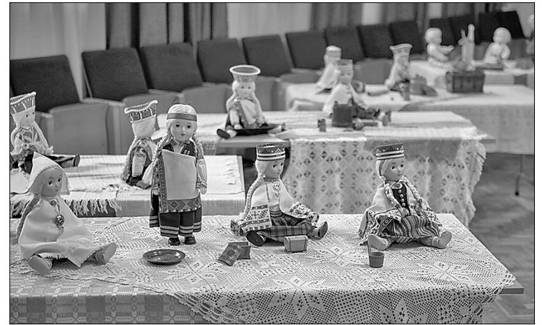
Latviskās vērtības var pasniegt arī šādi – savulaik fabrikā «Straume» darinātās lelles ietēptas tautas tērpos.