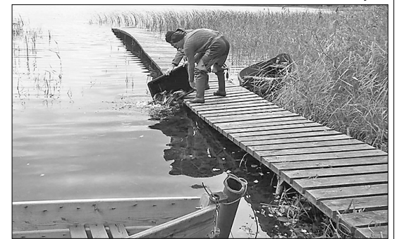
Salmeja un Kaučera ezerā kopā ielaisti 14 000 līdaku mazuļu.

Projekta rezultātā ir palielināti zivju krājumi Salmeja un Kaučera ezerā, līdz ar to ir radīti labvēlīgi apstākļi makšķerēšanas rekreācijas un tūrisma attīstībai Riebiņos. Tāpat ir veicināta Salmeja un Kaučera ezera apsaimniekošanas attīstība Riebiņu novadā. Papildinot zivju resursus Riebiņu novada Salmeja un Kaučera ezerā, tika radīti dabiskai atražošanai labvēlīgi apstākļi, bet Riebiņu novadā nodrošināti ilgtspējīgi izmantojami un daudzveidīgi publiski pieejamie Riebiņu novada ezera zivju resursi. Projekts ir atbilstošs Pārtikas drošības, dzīv-